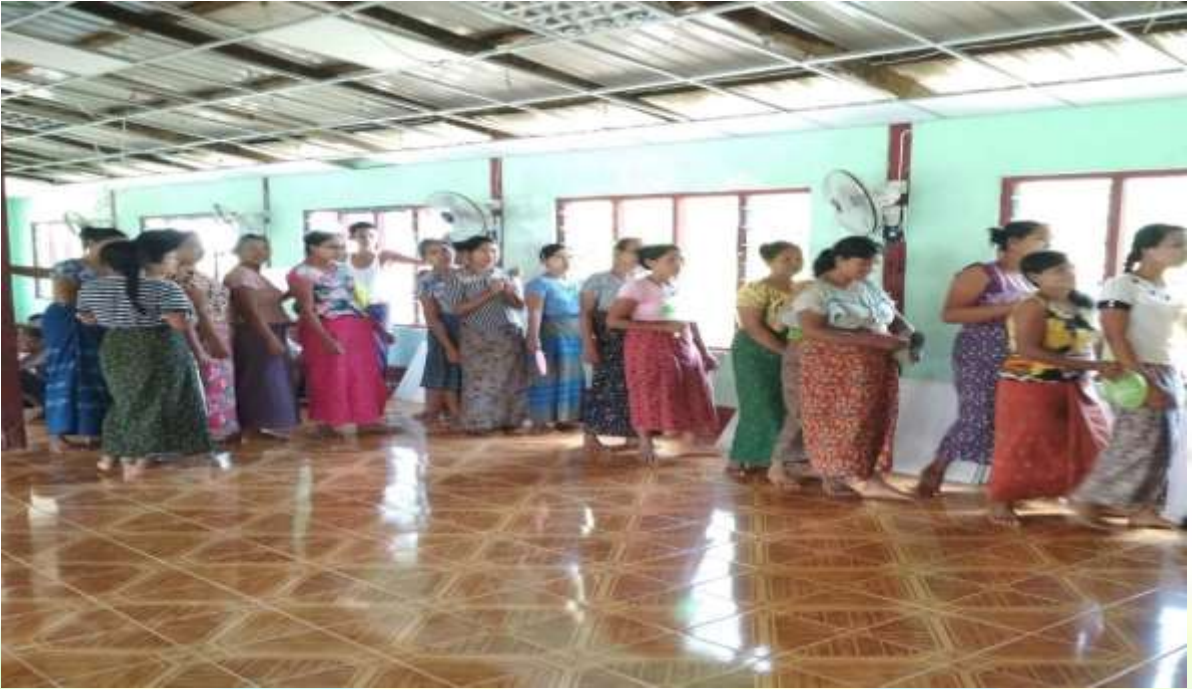
မိတ်ဆက်အစည်းအဝေးပြုလုပ်သည့် မှတ်တမ်းဓါတ်ပုံ ( စေတနာ့ဝန်ထမ်း ရွေးချယ်ခြင်း)