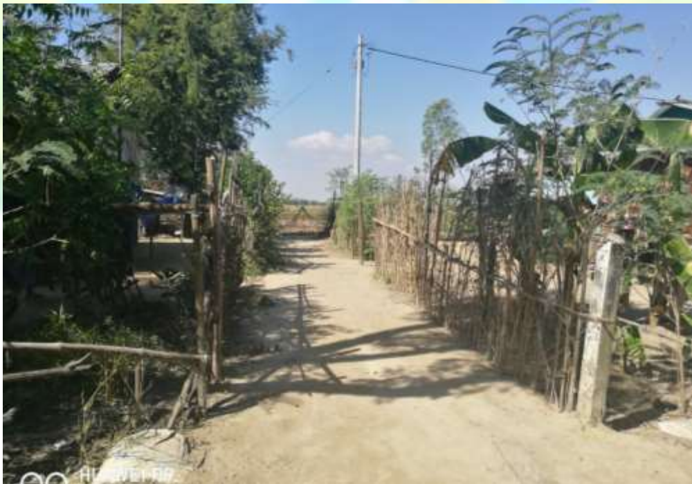
စီမံကိန်းလုပ်ငန်းခွဲ မစတင်မီ မှတ်တမ်းဓာတ်ပုံ