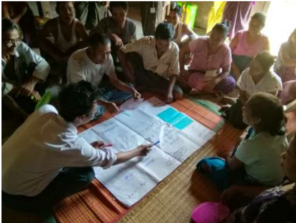
ကျေးရွာမှ PRA များဆွေးနွေးနေပုံ