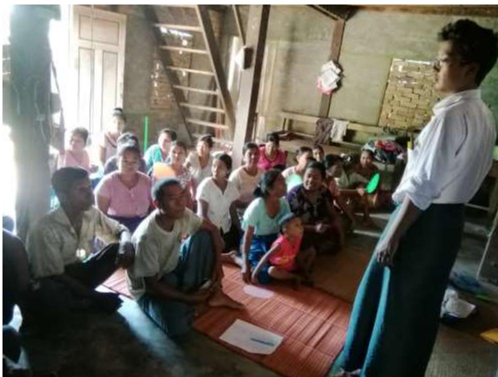
ကျေးရွာပထမဒုတိယအကြိမ်အစည်းအဝေး