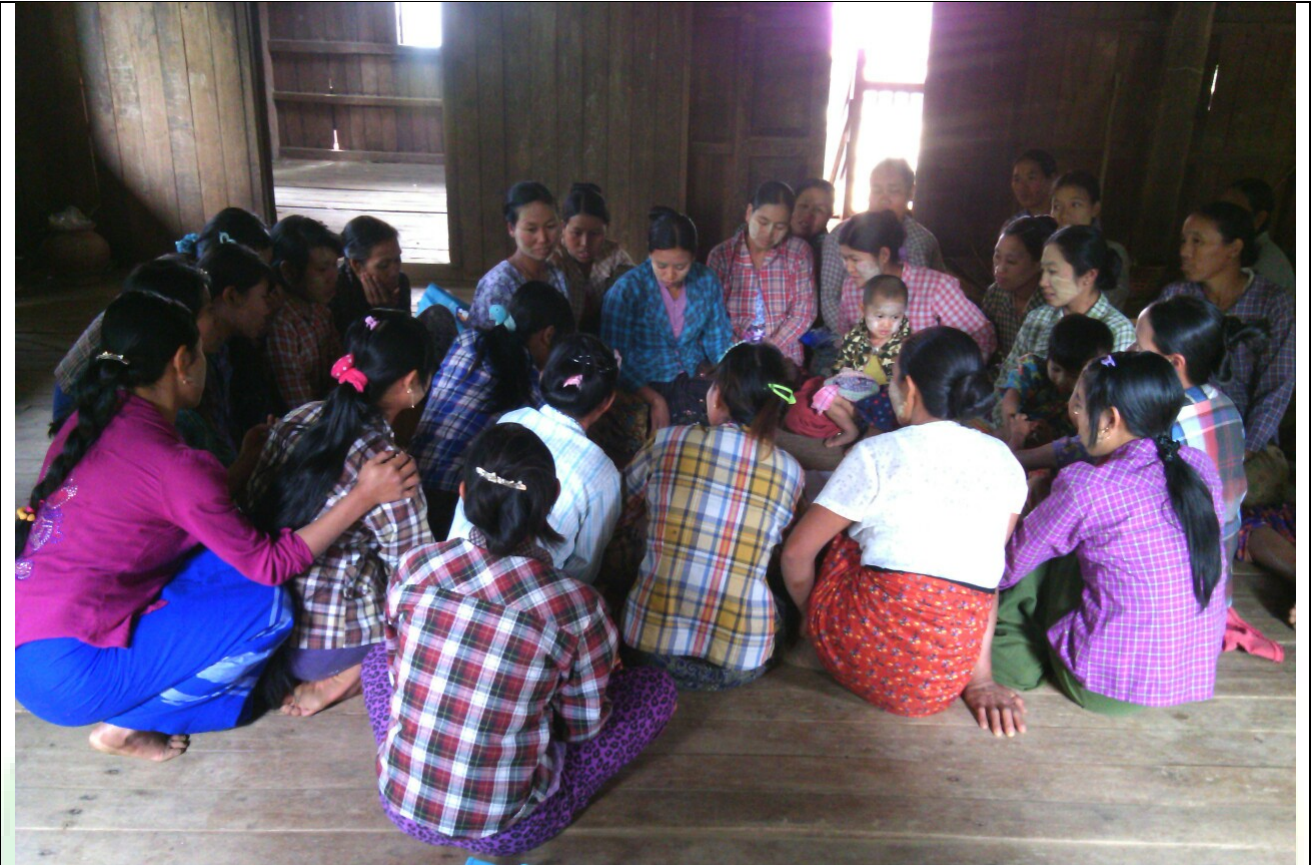
အမျိုးသမီးအုပ်စု၏မှတ်တမ်းခါတ်ပုံ