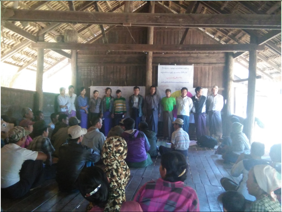
ကော်မတီ မှတ်တမ်းခါတ်ပုံ