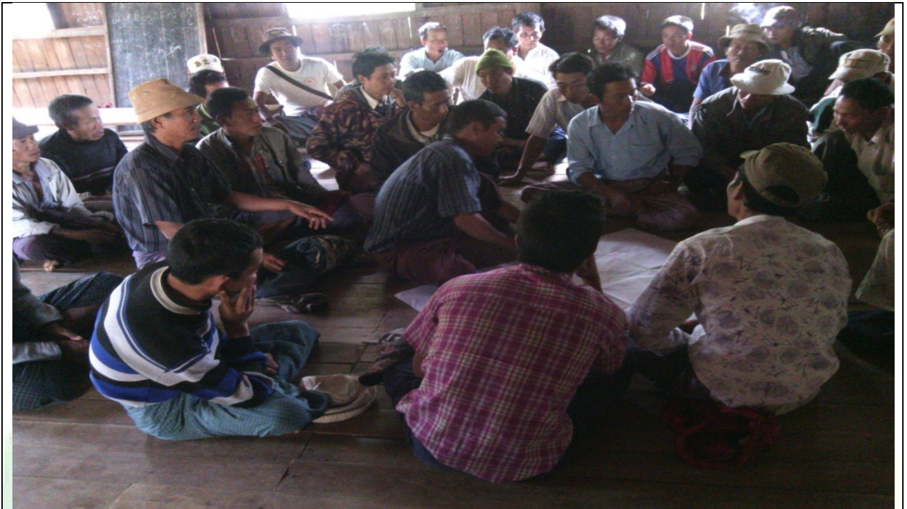
အမျိုးသားအုပ်စု၏မှတ်တမ်းခါတ်ပုံ