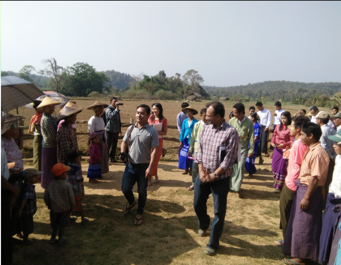
ကျွေးမွေးရေးအစီအစဉ်ရေးဆွဲခြင်မှတ်တမ်းခါတ်ပုံ