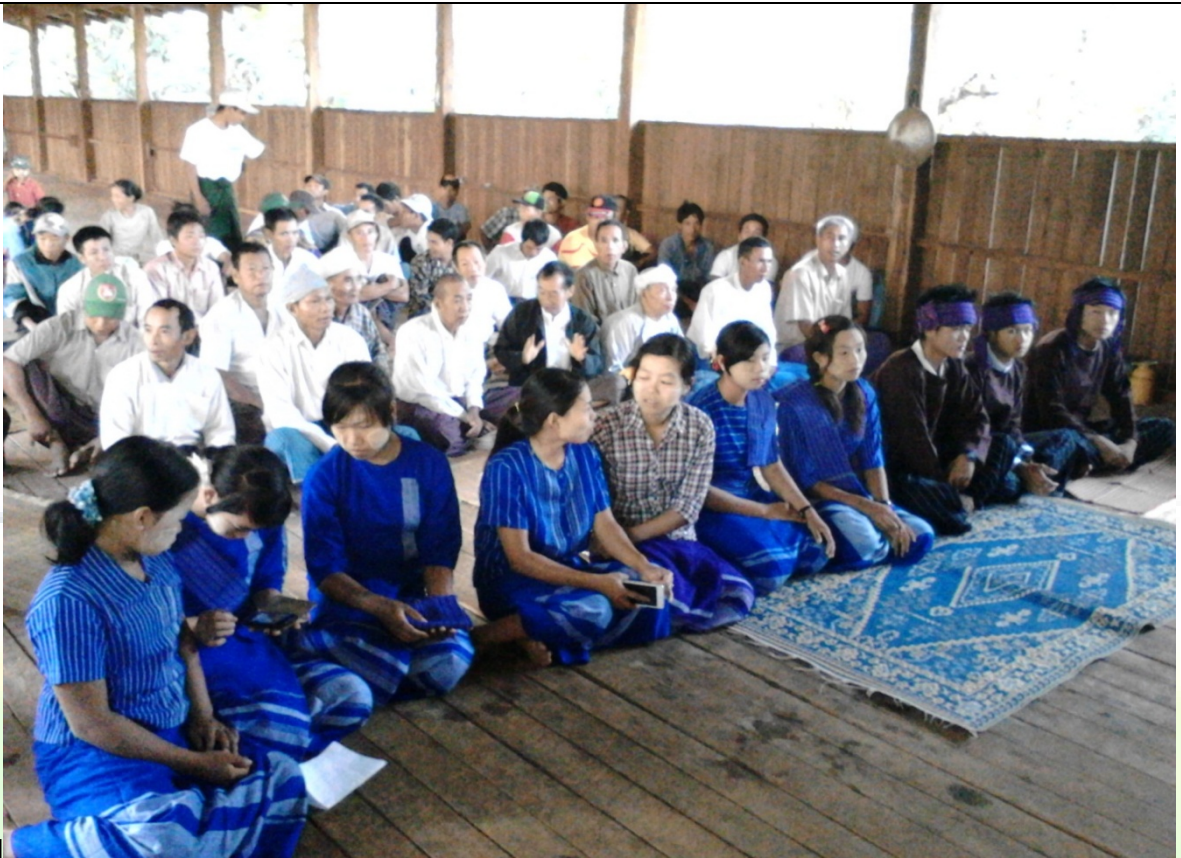
စေတနာ့ဝန်ထမ်းများရွေးချယ်ခြင်းမှတ်တမ်းဓာတ်ပုံ