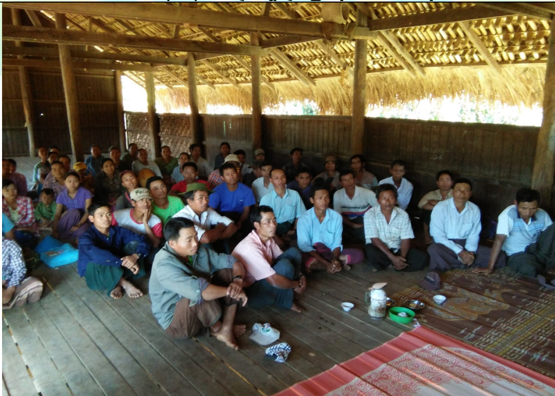
ကော်မတီရွေးချယ်ခြင်းမှတ်တမ်းဓာတ်ပုံ