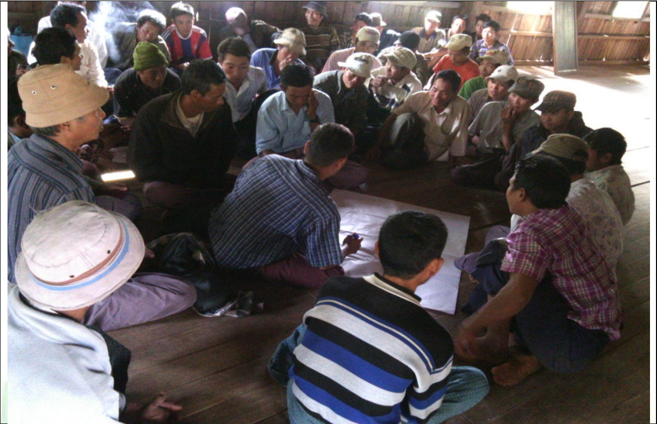
ဖွံ့ဖြိုးရေးအစီအစဉ်ရေးဆွဲခြင်မှတ်တမ်းခါတ်ပုံ