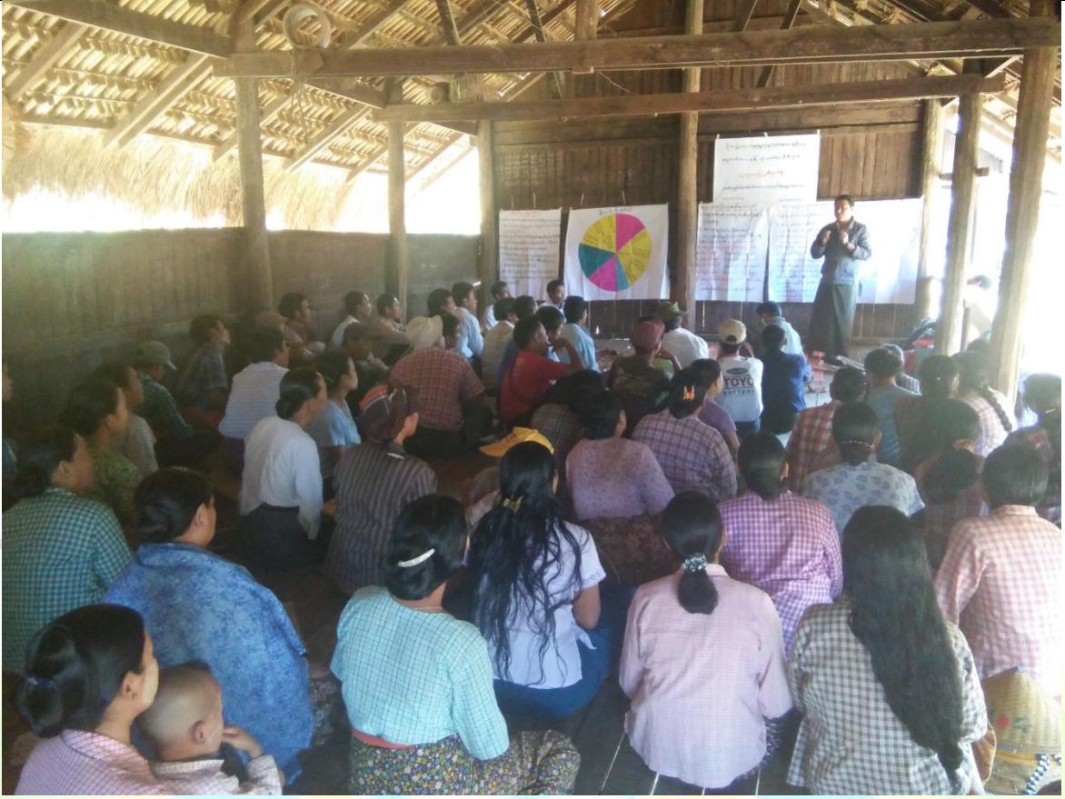
အစည်းအဝေး မှတ်တမ်းခါတ်ပုံ