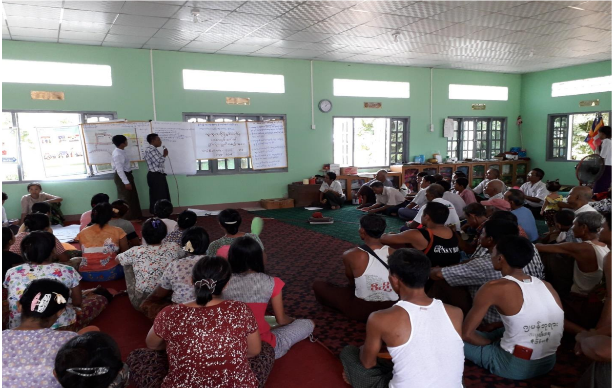
လူမှုဆန်းစစ်ခြင်းများအား ကျေးရွာသားမှ ပြန်လည်ရှင်းလင်းတင်ပြနေမှု