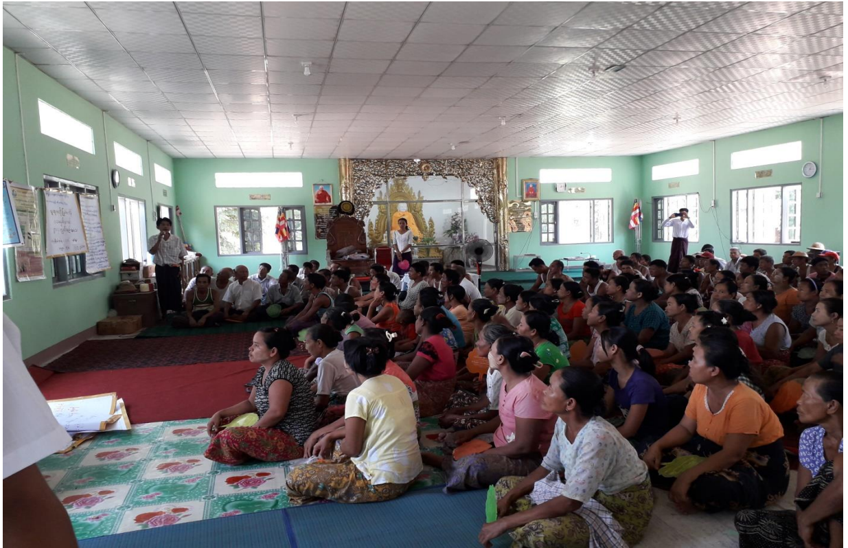
“ပထမအကြိမ်” အစည်းအဝေးစတင်နေမှု အခြေအနေ