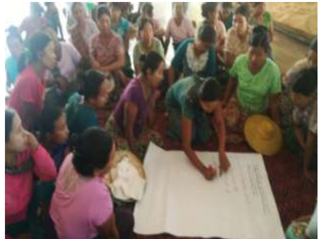
ကျေးရွာ အခက်အခဲ ပြဿနာများအား ဖော်ထုတ်ခြင်း