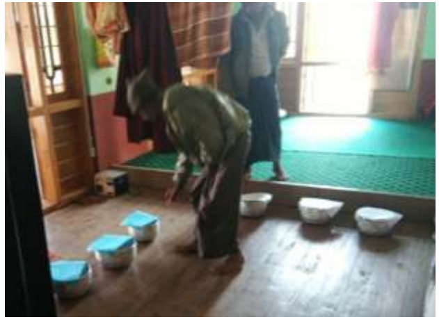
ကျေးရွာမှ ဖွံ့ဖြိုးရေး လုပ်ငန်းများအား မဲပေးရွေးချယ်ခြင်း