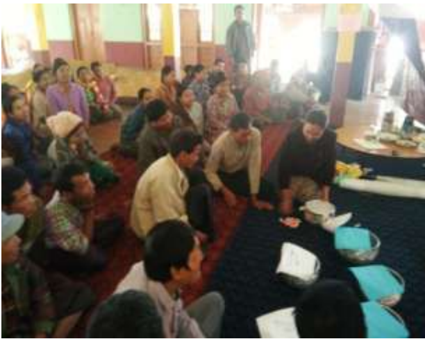
မဲများအား ရေတွက်ခြင်း