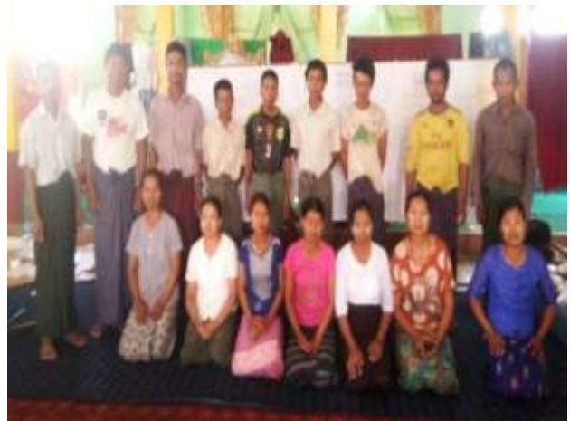
ကျေးရွာ ဖွံ့ဖြိုးရေး ကော်မတီဝင်များ