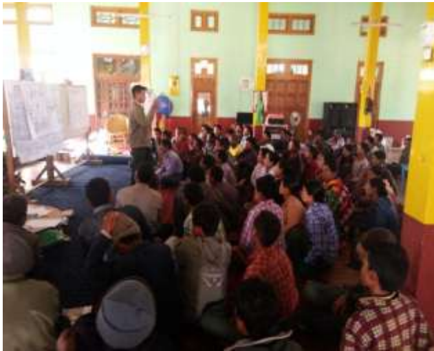
ကျေးရွာအစည်းအဝေးပြုလုပ်ခြင်း

၂၇။ ကျေးရွာ ဖွံ့ဖြိုးရေး အစီအစဉ် ဆောင်ရွက်မှု မှတ်တမ်း ဓါတ်ပုံများ