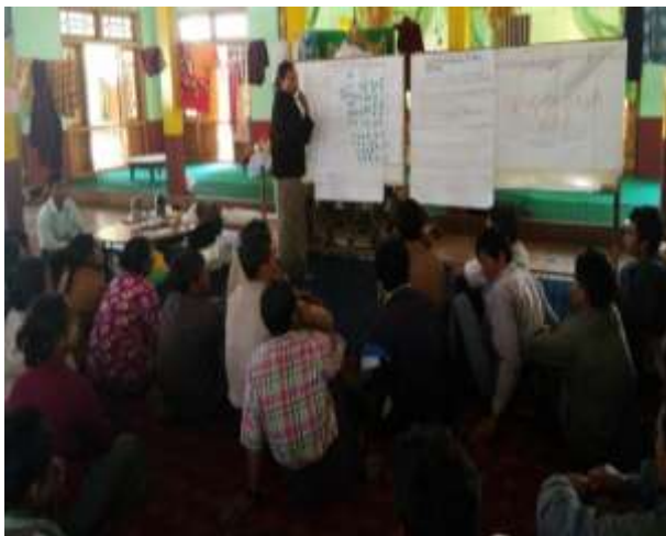
ကျေးရွာမှ ပြန်လည်တင်ပြခြင်း