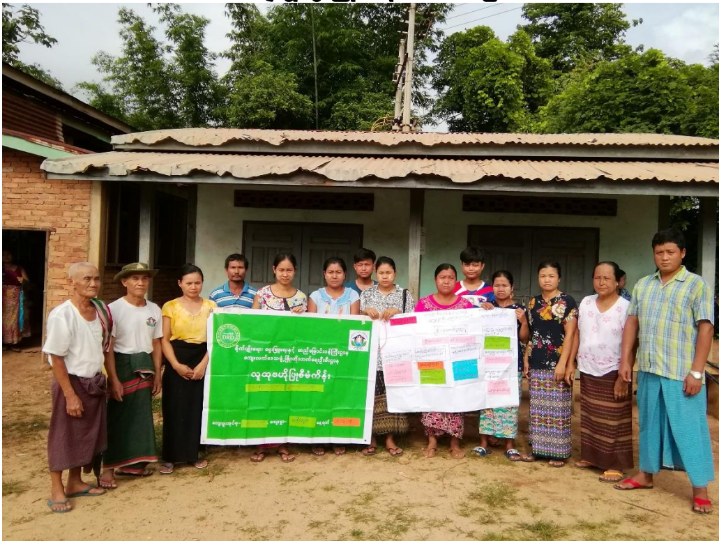
ရေကျော်ကြီးကျေးရွာအုပ်စု၊ တမိုင်ကုန်းကျေးရွာ ၂၀၁၉ ခုနှစ်

လူထုဗဟိုပြုစီမံကိန်း ကော့ကရိတ်မြို့နယ်၊ ကရင်ပြည်နယ် ကျေးရွာဖွံ့ဖြိုးရေးအစီအစဉ်