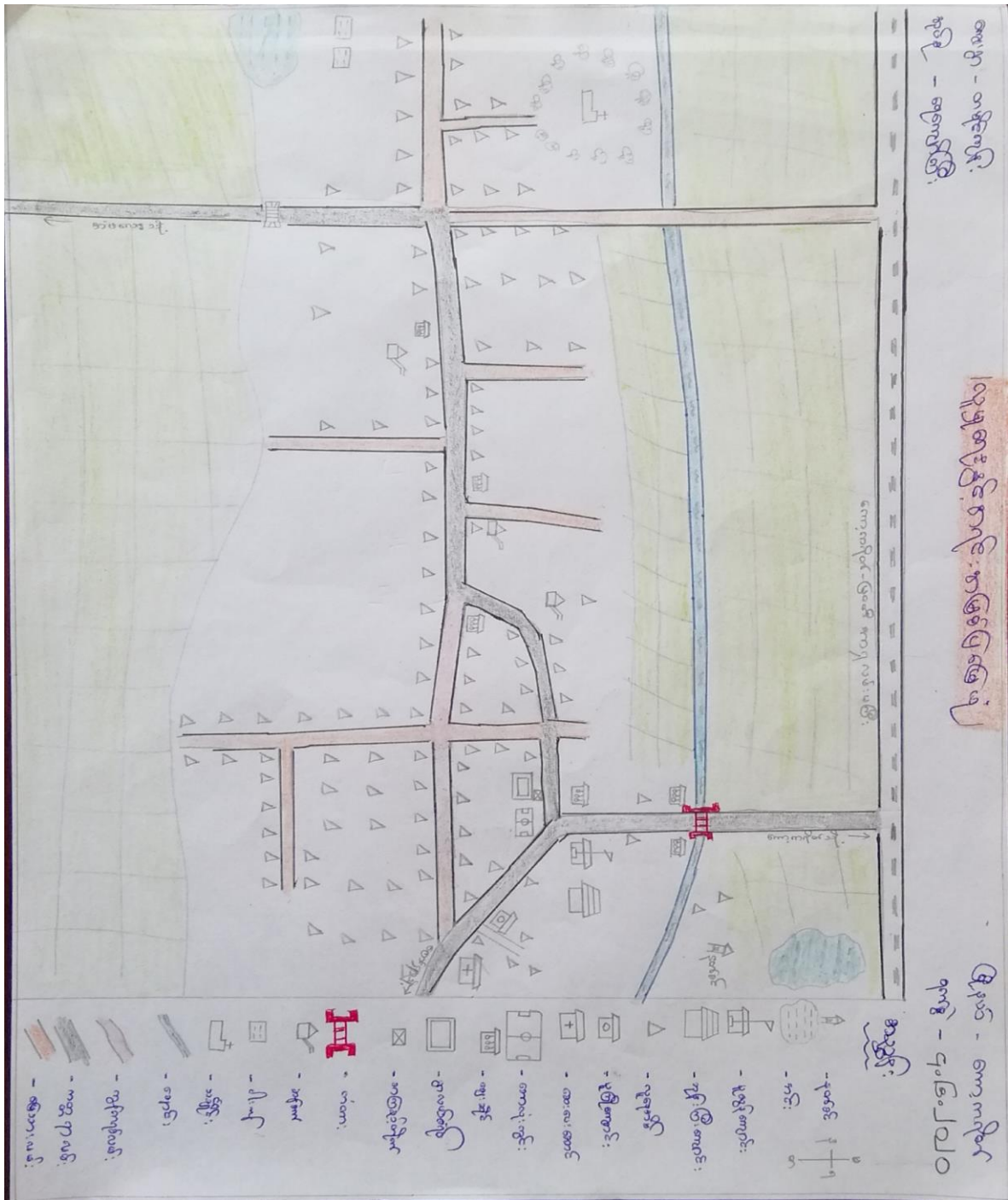
၆.၁။ လူမှုရေးနှင့်အရင်းအမြစ်ပြမြေပုံ (Social and Resource Map)