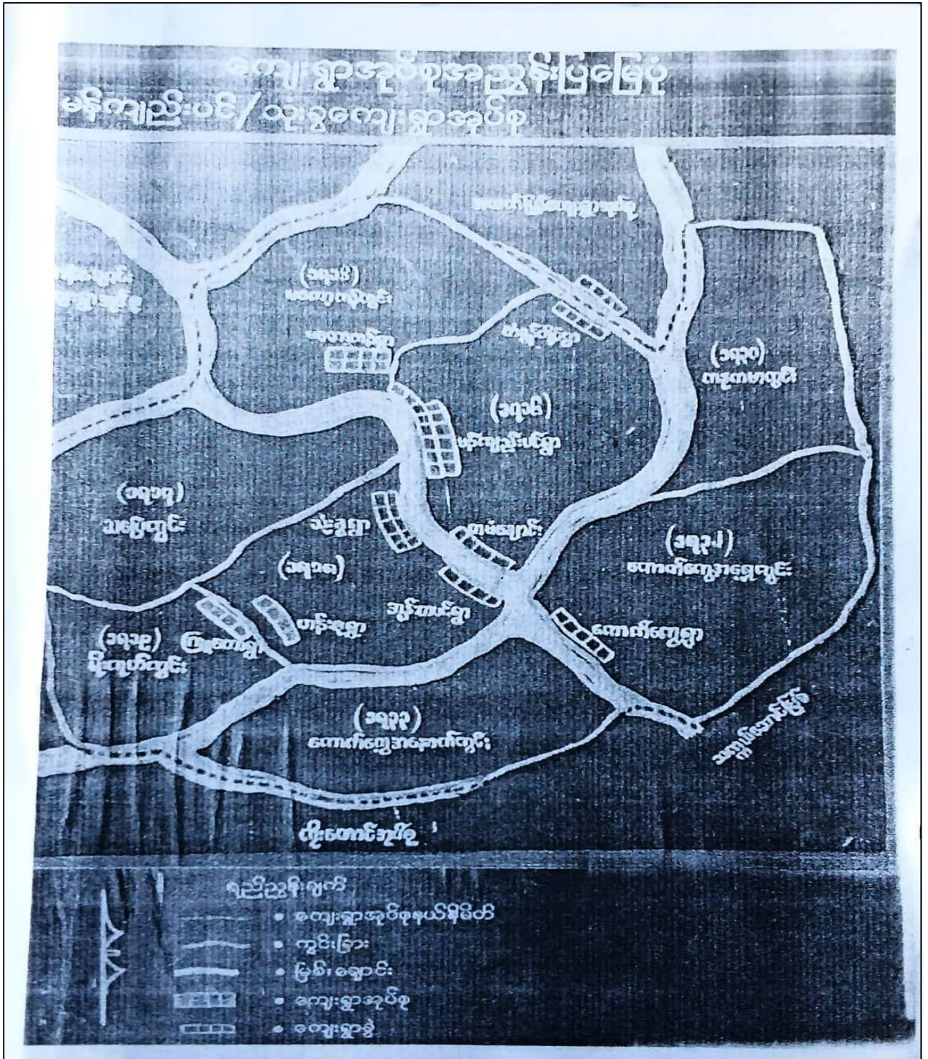
၃။ ကျေးရွာအုပ်စုအတွင်းပါဝင်သော ကျေးရွာများစာရင်း