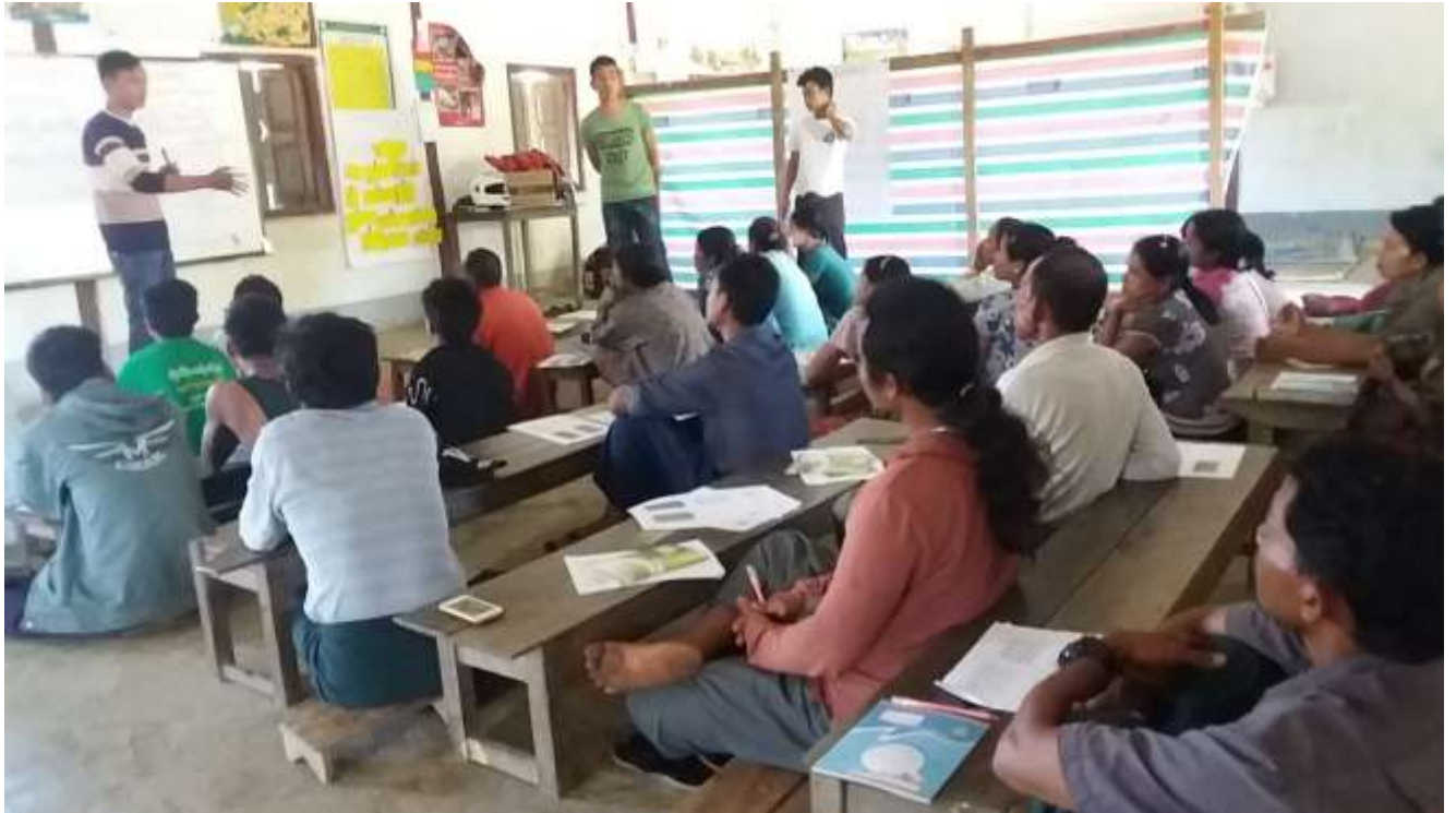
၁၈။ ကော်မတီဝင်များရွေးချယ်ခြင်းနှင့် ကျေးရွာဖွံ့ဖြိုးရေးအစီအစဉ်ဆောင်ရွက်မှုမှတ်တမ်းခါတ်ပုံများ