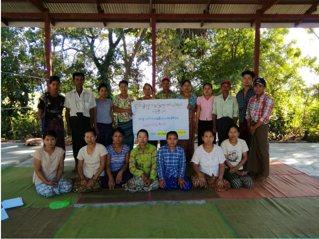
ဒုတိယနှစ်စက်ဝန်း ကျေးရွာအစည်းအဝေးမှတ်တမ်းဓါတ်ပုံများ