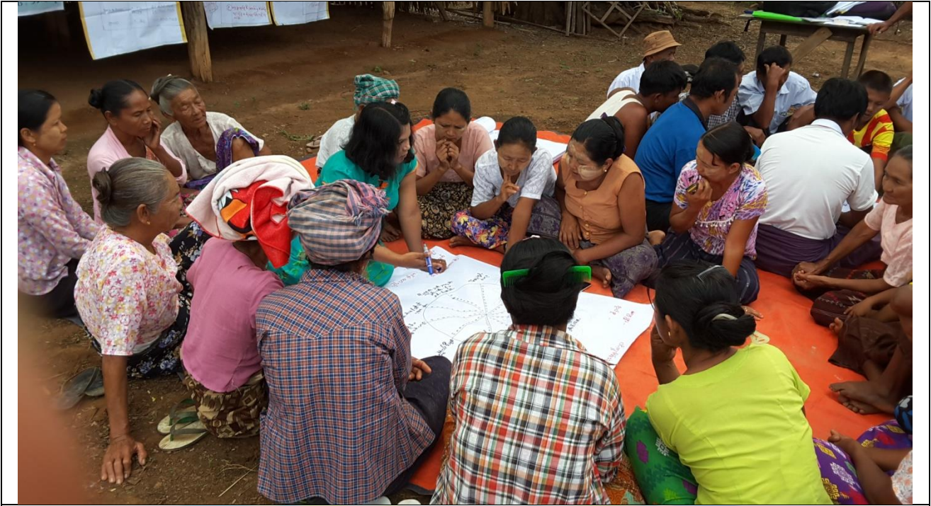
အမျိုးသမီးများပင့်ကူအိမ်ကွန်ယက်ရေးဆွဲနေစဉ် မှတ်တမ်းဓာတ်ပုံ