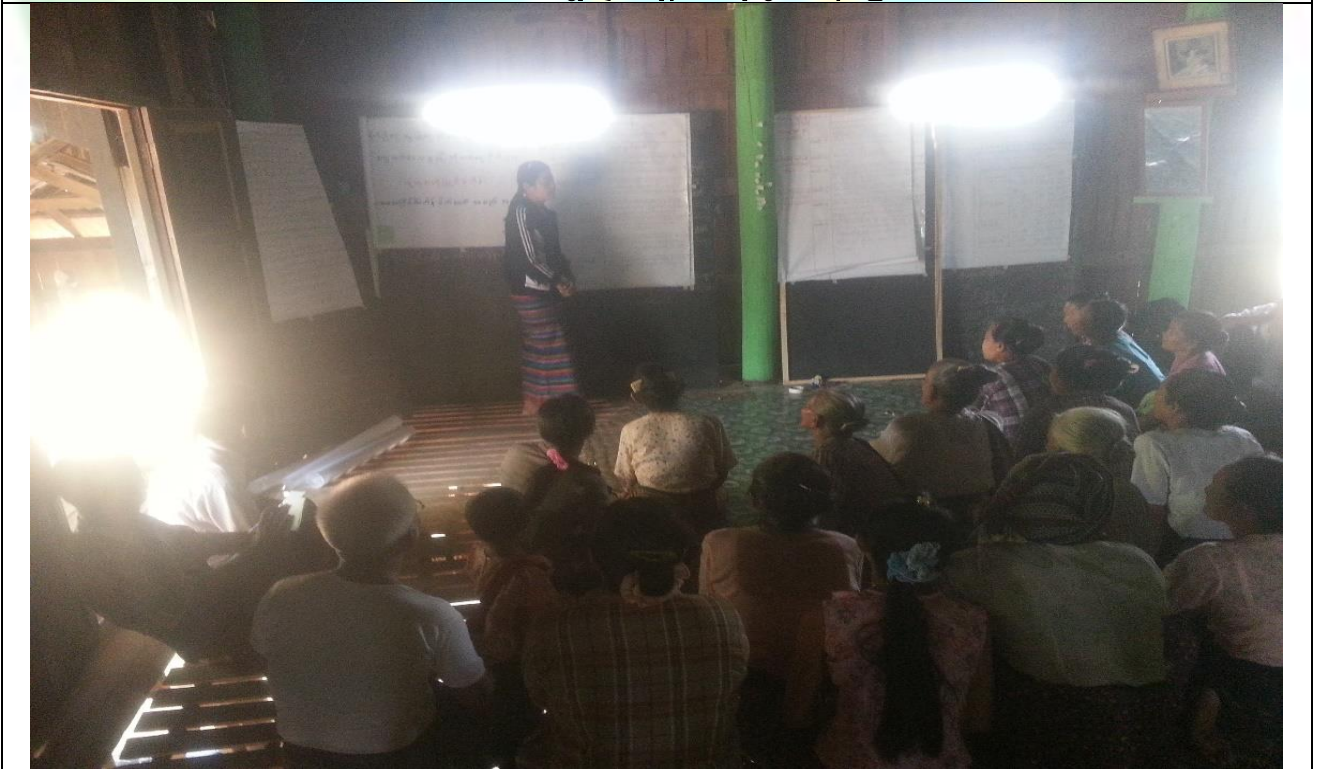
စီမံကိန်းမိတ်ဆက်အစည်းအဝေး မှတ်တမ်းဓါတ်ပုံ