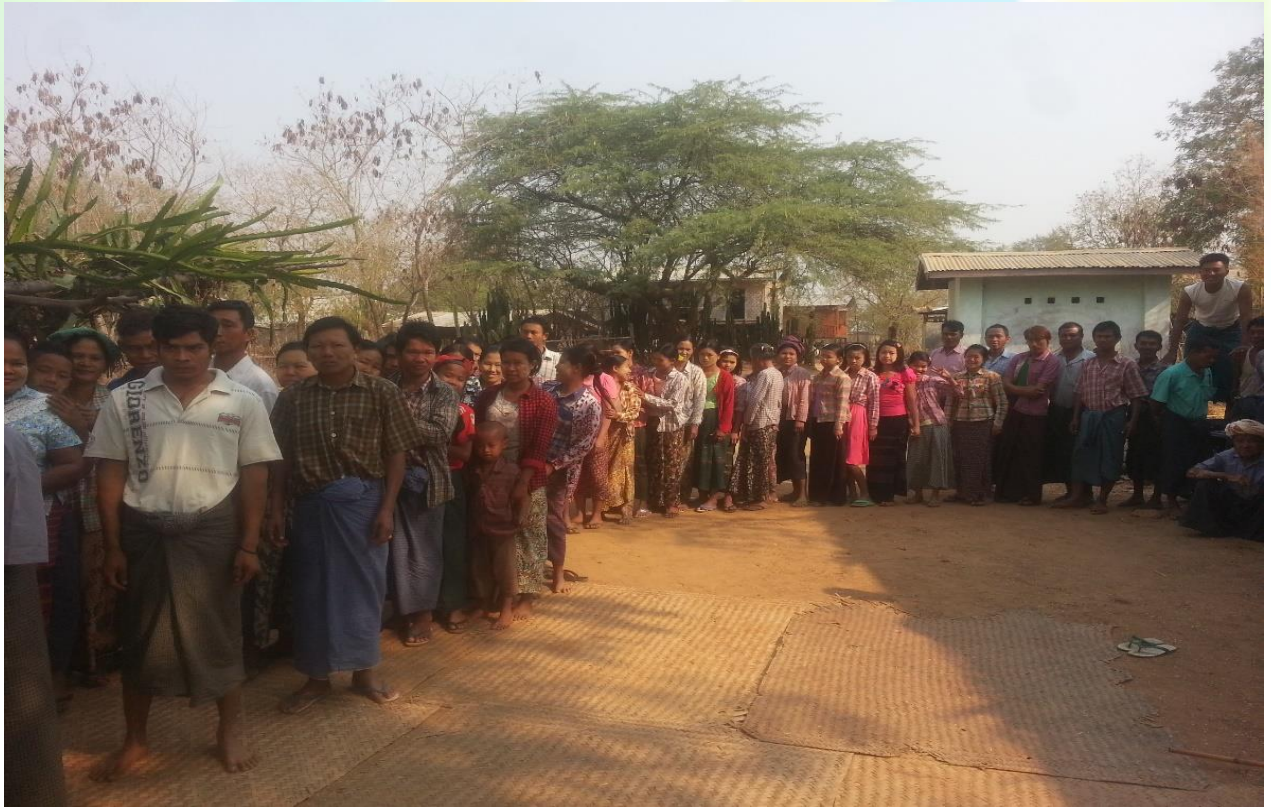
ကျေးရွာဖွံ့ဖြိုးရေးဦးစားပေးမဲပေးရန်တန်းပီနေကြစဉ်