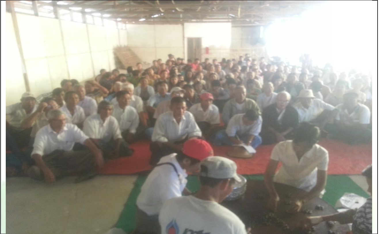
ကော်မတီရွေးချယ်ရန် မဲရေတွက်နေစဉ်