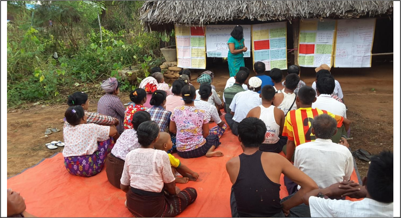
ကျေးရွာလုပ်ငန်းခွဲအတွက်အခက်အခဲများဖော်ထုတ်ဆွေးနွေးစဉ်