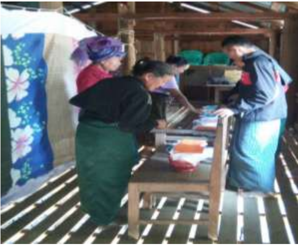
ကျေးရွာမှ ဖွံ့ဖြိုးရေး လုပ်ငန်းများအား မဲပေးရွေးချယ်ခြင်း