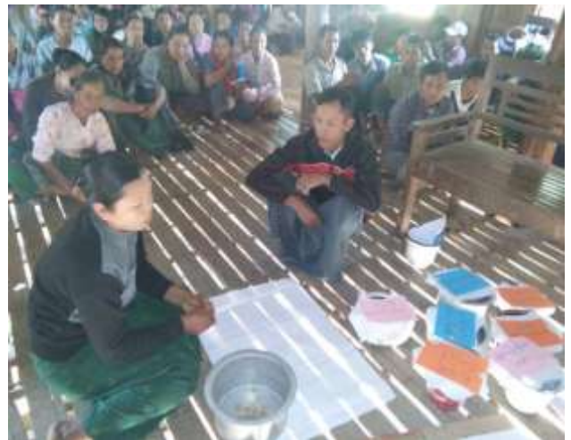
မဲများအား ရေတွက်ခြင်း