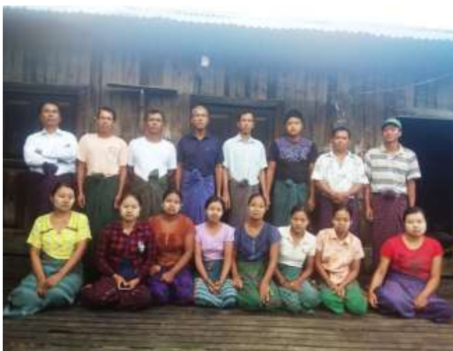
ကျေးရွာ ဖွံ့ဖြိုးရေး ကော်မတီဝင်များ