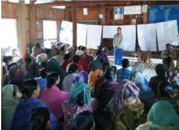
ကျေးရွာအစည်းအဝေးပြုလုပ်ခြင်း

၂၇။ ကျေးရွာ ဖွံ့ဖြိုးရေး အစီအစဉ် ဆောင်ရွက်မှု မှတ်တမ်း ဓါတ်ပုံများ