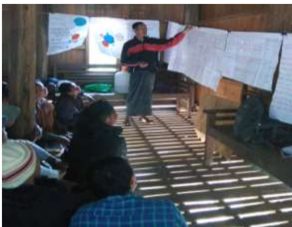
ကျေးရွာမှ ပြန်လည်တင်ပြခြင်း