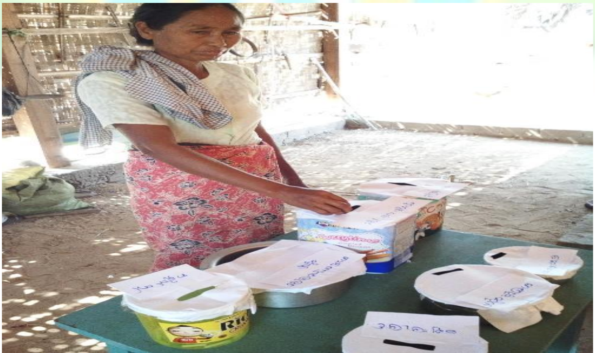
ကျေးရွာဖွံ့ဖြိုးရေးဦးစားပေးမဲပေးရန်တန်းစီနေကြစဉ်