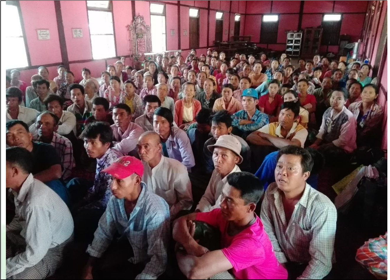
ကျေးရွာလုပ်ငန်းခွဲအတွက်အခက်အခဲများဖော်ထုတ်ဆွေးနွေးစဉ်