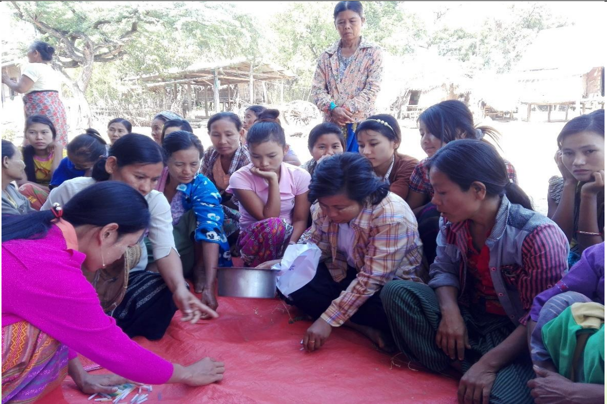
အမျိုးသမီးများပင့်ကူအိမ်ကွန်ယက်ရေးဆွဲနေစဉ်မှတ်တမ်းဓာတ်ပုံ