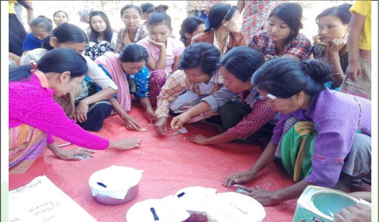
ကော်မတီရွေးချယ်ရန် မဲရေတွက်နေစဉ်