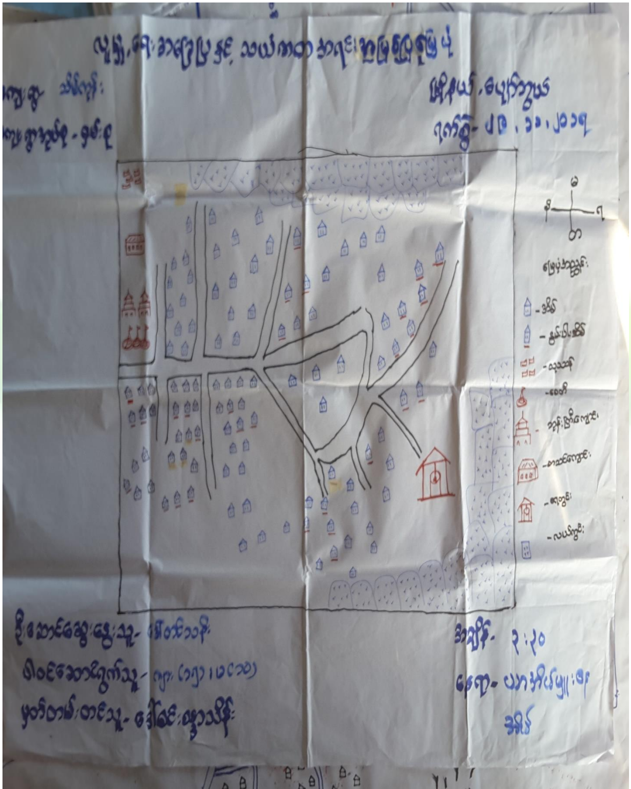
ကျေးရွာမြေပုံသုံးသပ်ချက်။