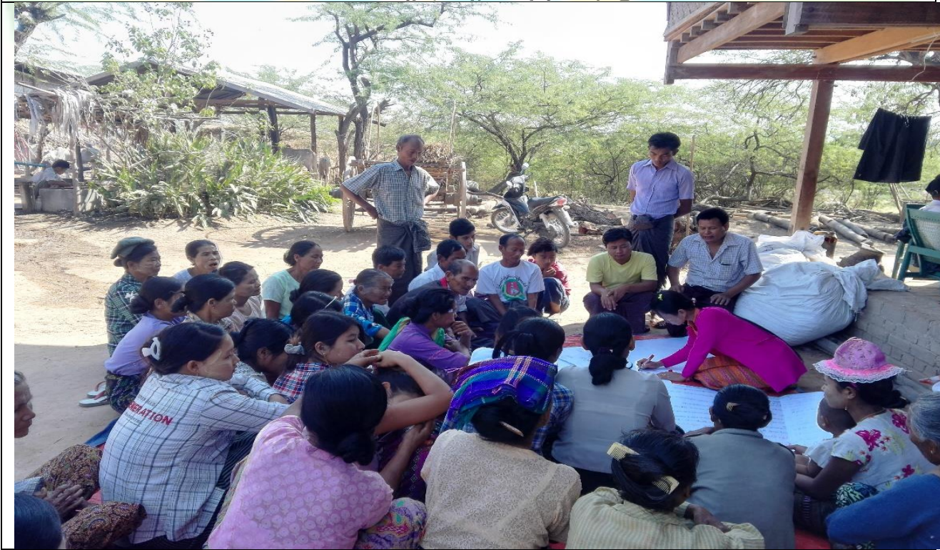
စီမံကိန်းမိတ်ဆက်အစည်းအဝေးမှတ်တမ်းဓါတ်ပုံ