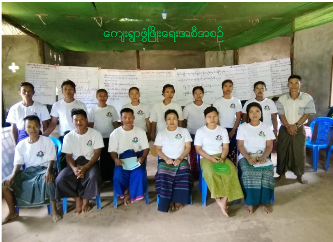
ရွာသာယာကျေးရွာအုပ်စု၊ ရွှေပြည်စုကျေးရွာ