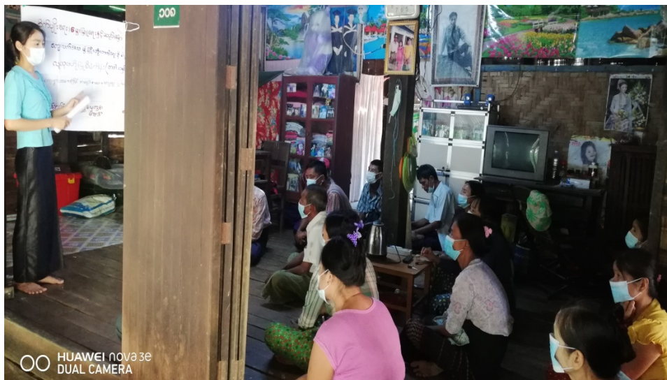
ထန်းပင်ကန်ကျေးရွာအုပ်စု၊ ရွှေလှေကွင်းကျေးရွာ