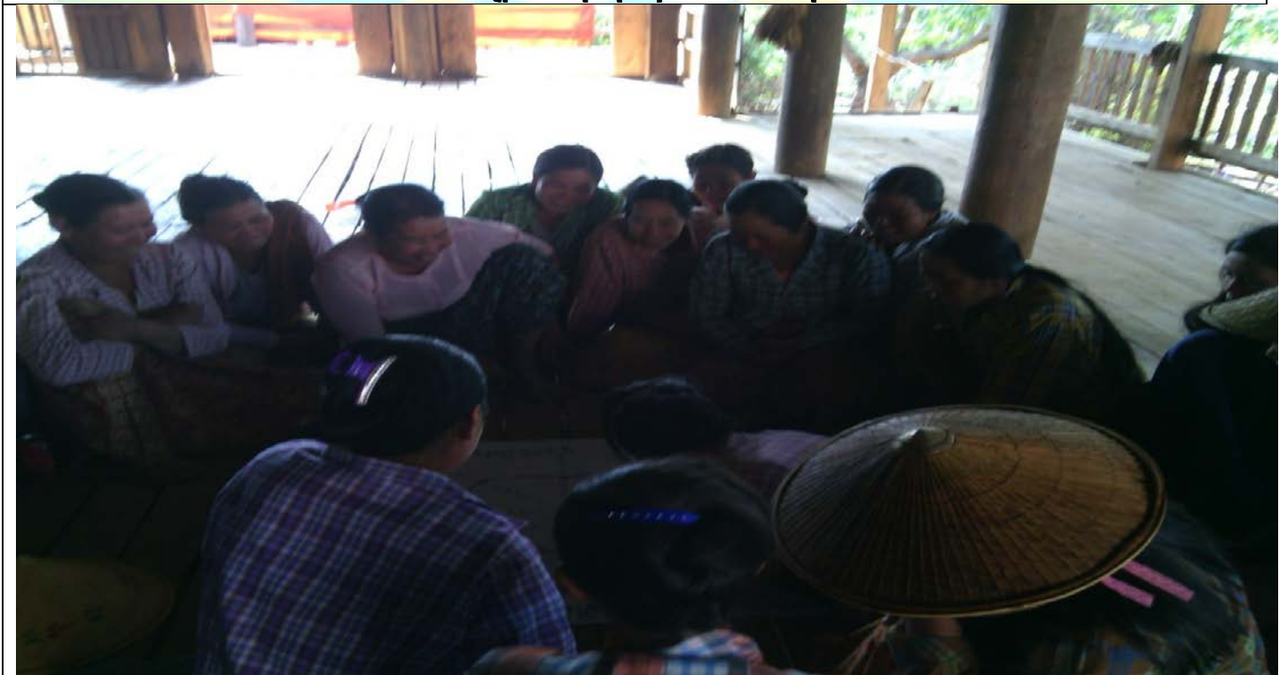
အမျိုးသမီးအုပ်စု၏မှတ်တမ်းခါတ်ပုံ