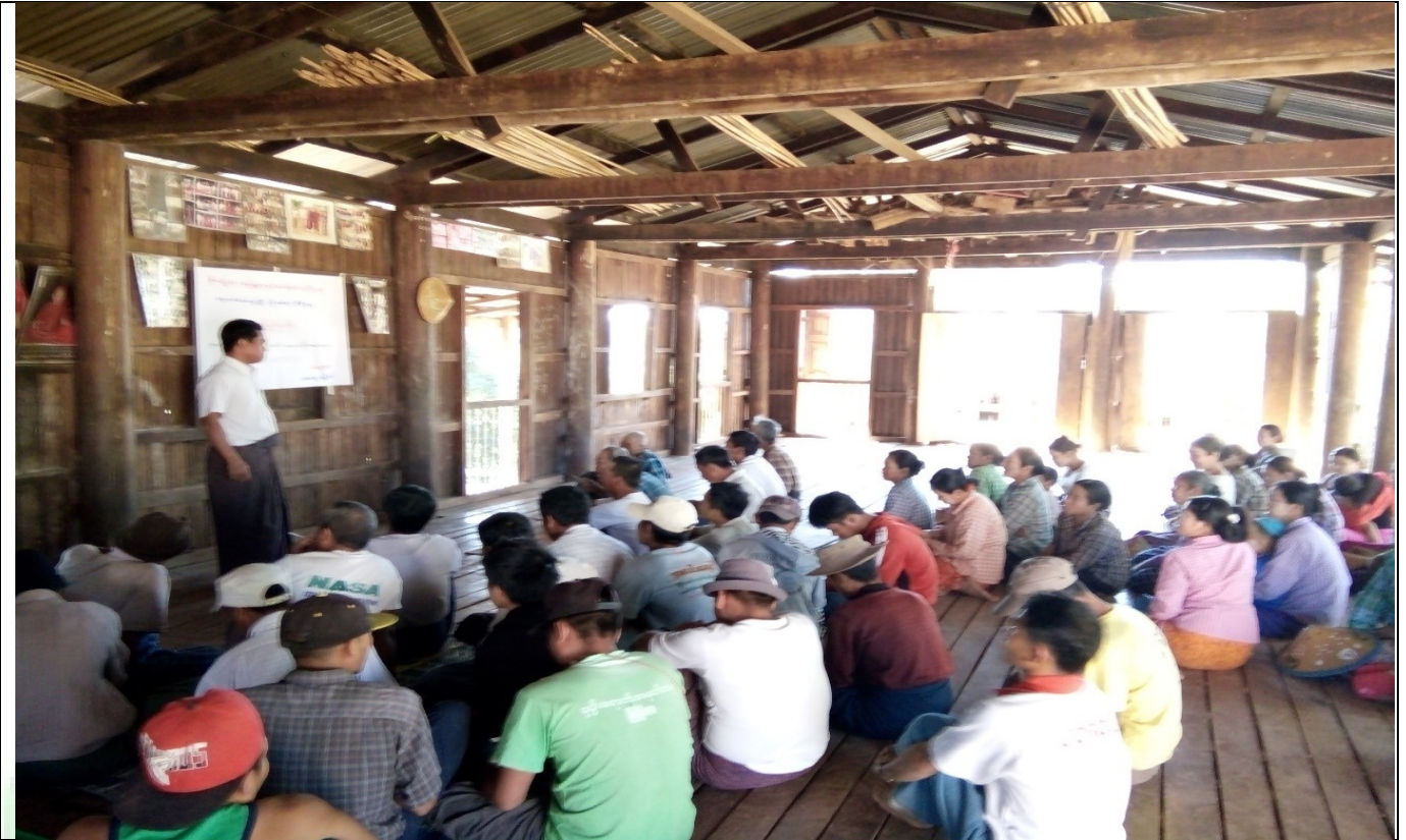
ဖွံ့ဖြိုးရေးအစီအစဉ်ရေးဆွဲခြင်မှတ်တမ်းခါတ်ပုံ