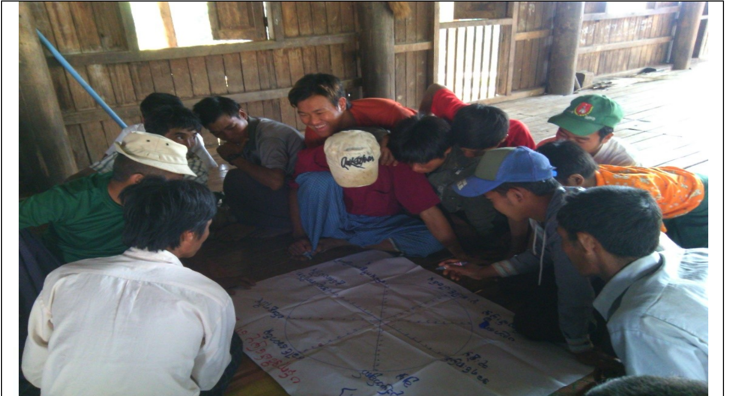
အမျိုးသားအုပ်စု၏မှတ်တမ်းခါတ်ပုံ