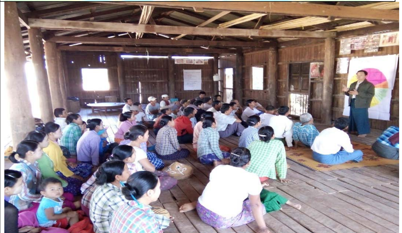
ကော်မတီရွေးချယ်ခြင်းမှတ်တမ်းဓါတ်ပုံ