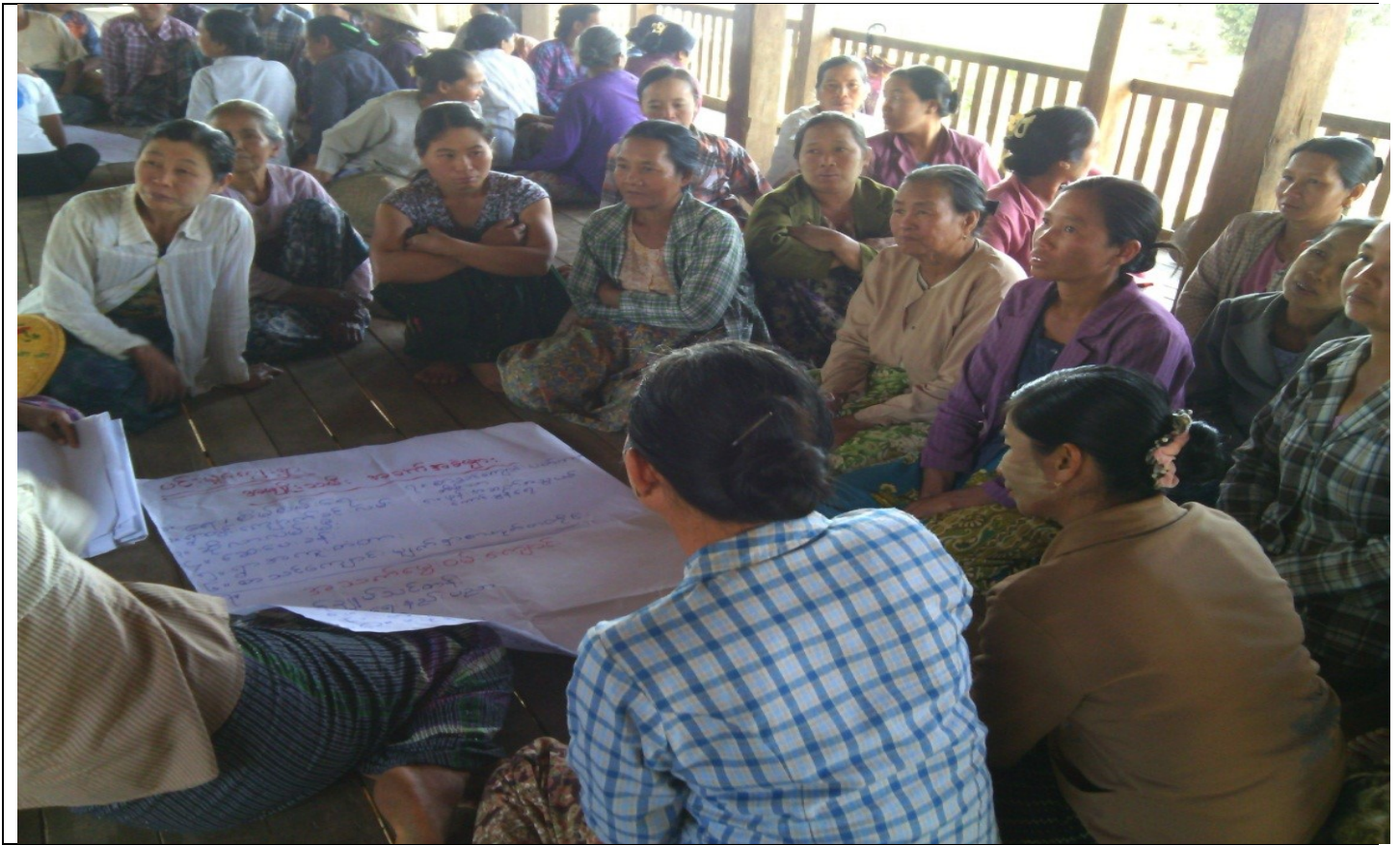
လူငယ်အုပ်စု၏မှတ်တမ်းခါတ်ပုံ