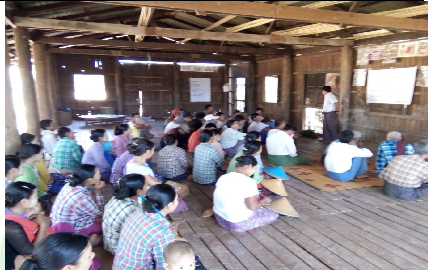
စေတနာ့ဝန်ထမ်းများရွေးချယ်ခြင်းမှတ်တမ်းဓါတ်ပုံ