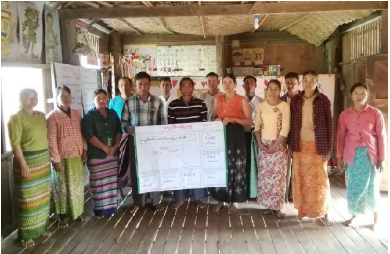
၇။ ကော်မတီဝင်များရွေးချယ်ခြင်းနှင့် ကျေးရွာဖွံ့ဖြိုးရေးအစီအစဉ်ဆောင်ရွက်မှု မှတ်တမ်းဓါတ်ပုံများ