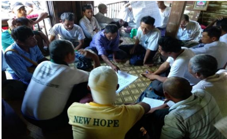
ကျေးရွာမှအခက်အခဲနှင့်မျှော်မှန်းချက်၊လုပ်ငန်းများကိုဆွေးနွေးတင်ပြနေပုံ