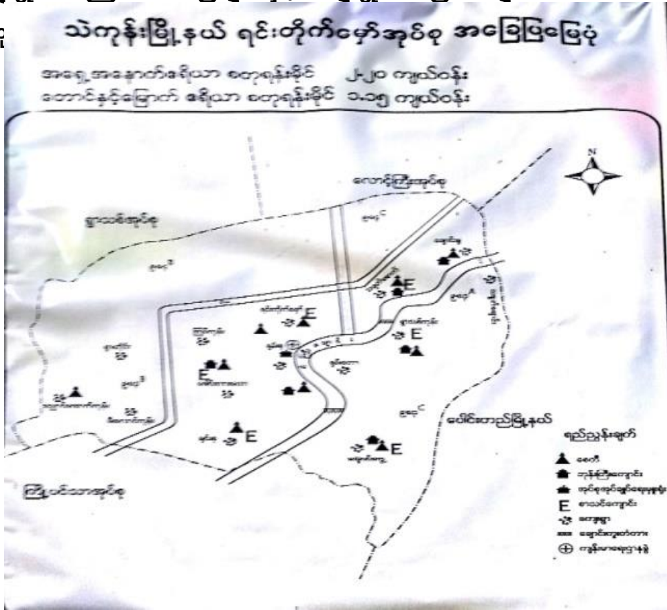
နတ္ထလင်းမြို့နယ်