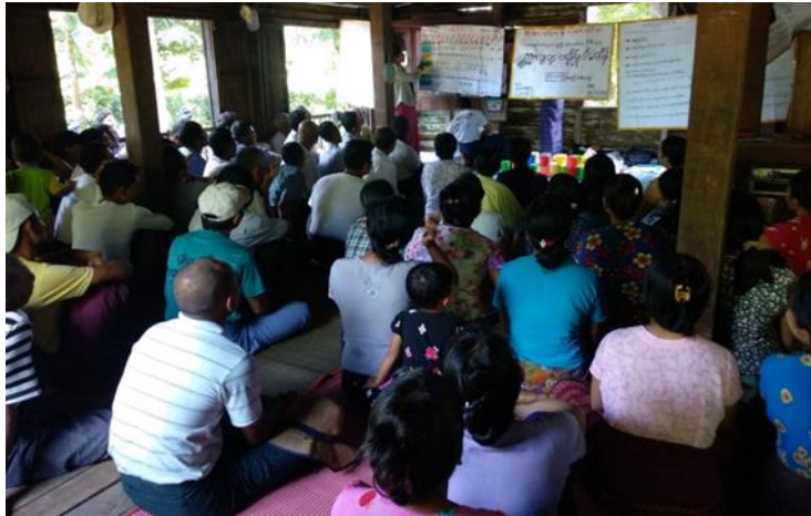
ကျေးရွာမှ (PRA)အားရှင်းလင်းတင်ပြနေပုံ