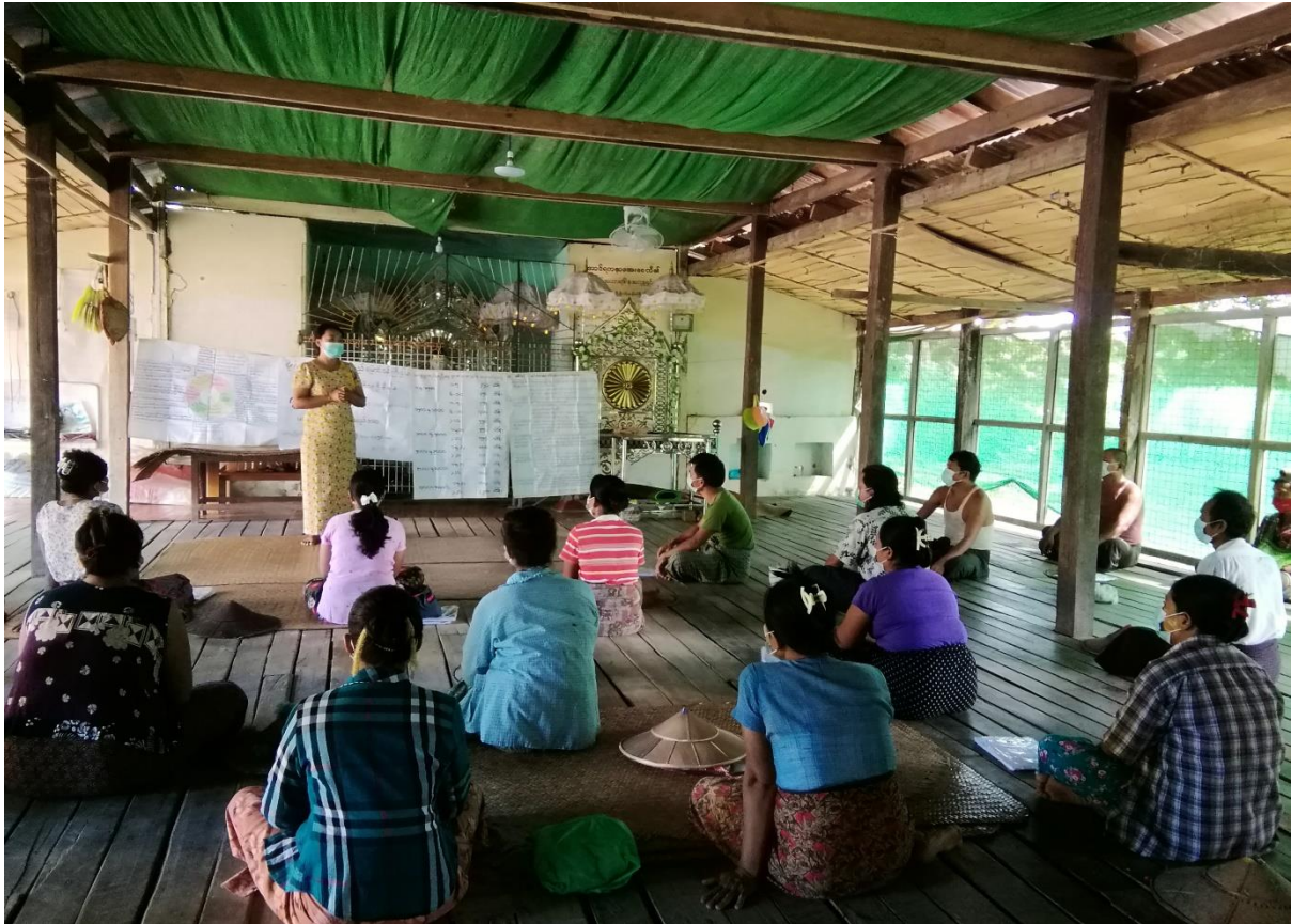
၇။ ကော်မတီများရွေးချယ်ခြင်းနှင့်ကျေးရွာဖွံ့ဖြိုးရေးအစီအစဉ်ဆောင်ရွက်မှု မှတ်တမ်းခါတ်ပုံ