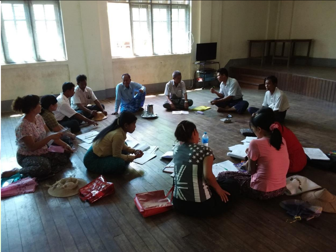
အုပ်စုအစည်းအဝေး၏ မှတ်တမ်းခါတ်ပုံ