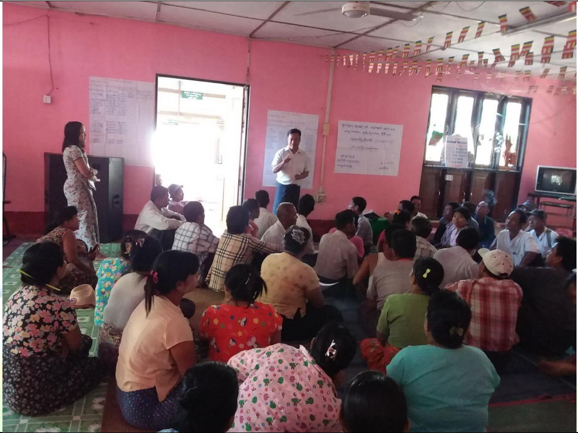
ဝယ်ယူရေးစီမံချက်ရေးဆွဲခြင်း မှတ်တမ်းခါတ်ပုံ