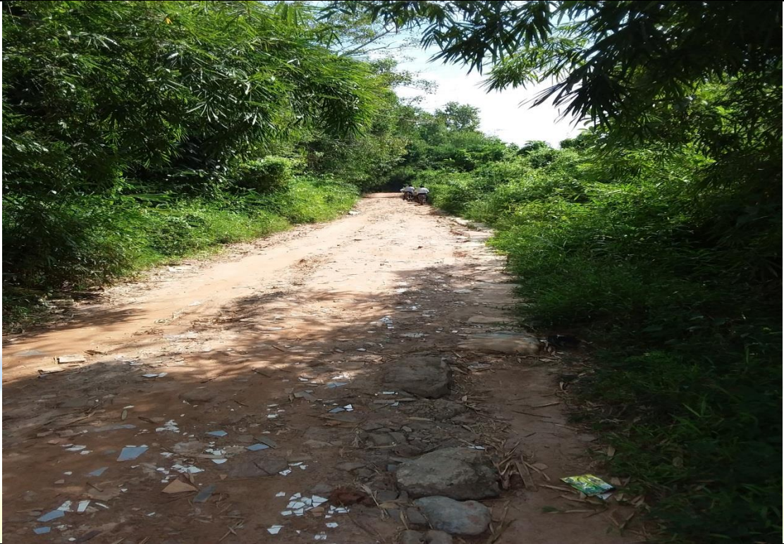
ဒုတိယနှစ်စက်ဝန်း စီမံကိန်းလုပ်ငန်းခွဲ မပြုလုပ်မီ မှတ်တမ်းဓာတ်ပုံ