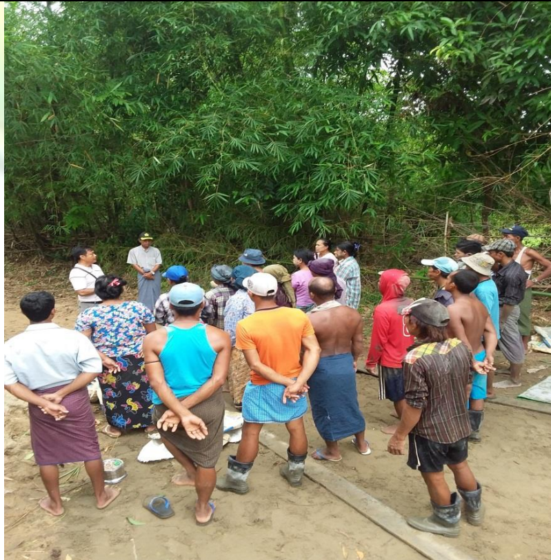
လုပ်ငန်းခွင်အန္တရာယ်ကင်းဝေးရေးအသိပညာပေးမှတ်တမ်းခါတ်ပုံ