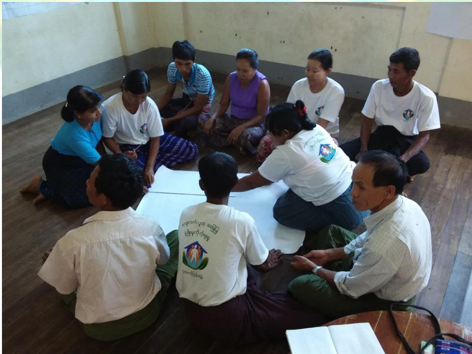
အမျိုးသား/အမျိုးသမီး အုပ်စု မှတ်တမ်းတင်ခါတ်ပုံ။