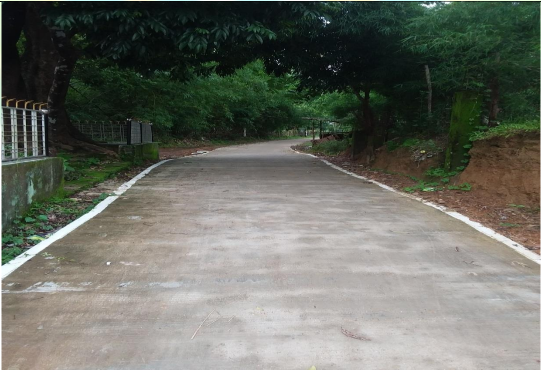
ပထမနှစ်စက်ဝန်း စီမံကိန်းလုပ်ငန်းခွဲ မှတ်တမ်းဓာတ်ပုံ