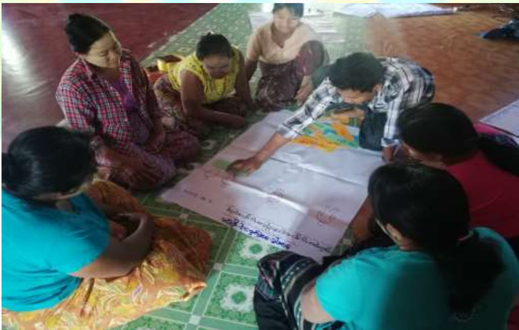
လူမှုဆန်းစစ်ခြင်း မှတ်တမ်းဓါတ်ပုံ