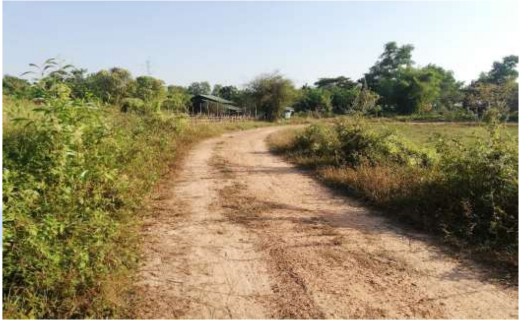
စီမံကိန်းလုပ်ငန်းခွဲ မစတင်မီ မှတ်တမ်းဓာတ်ပုံ