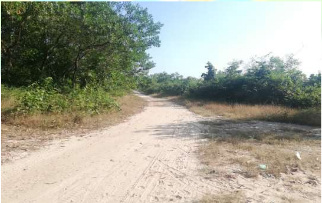
စီမံကိန်းလုပ်ငန်းခွဲ မစတင်မီ မှတ်တမ်းဓာတ်ပုံ