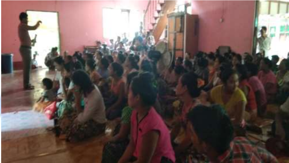
စီမံကိန်းမိတ်ဆက်အစည်းအဝေးမှတ်တမ်းတင်ဓါတ်ပုံ။

၈။ ကော်မတီဝင်များရွေးချယ်ခြင်းနှင့် ကျေးရွာဖွံ့ဖြိုးရေးအစီအစဉ်ဆောင်ရွက်မှု မှတ်တမ်းဓါတ်ပုံများ