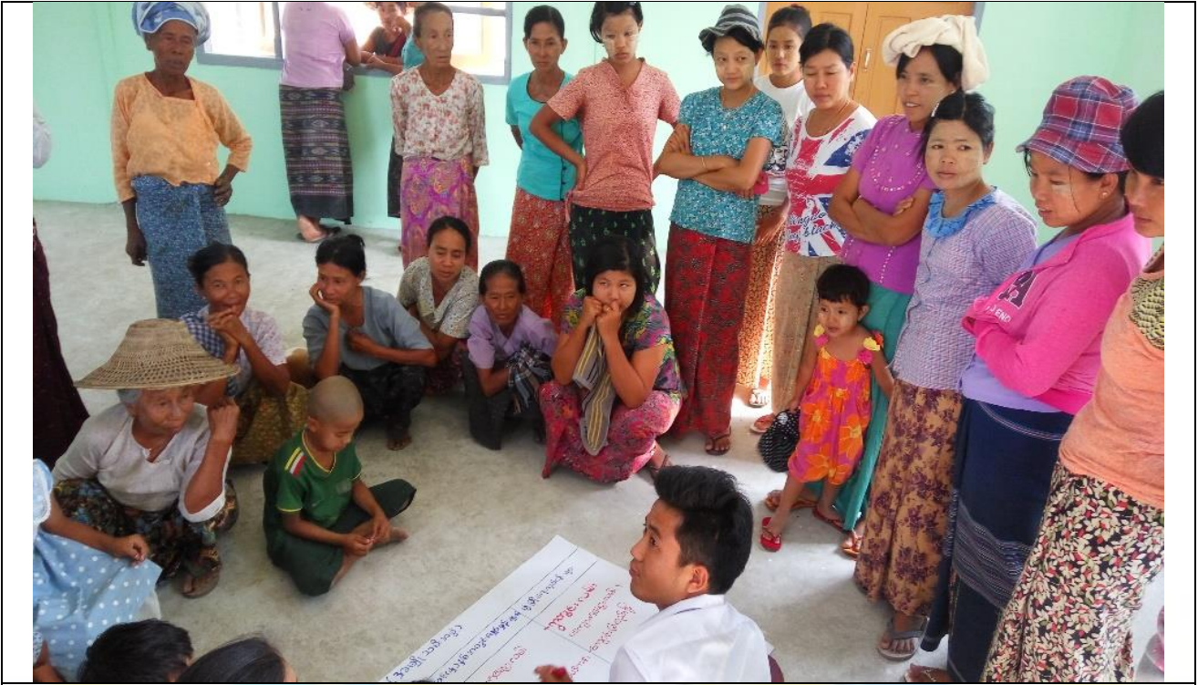
ကျေးရွာလုပ်ငန်းခွဲအတွက်အခက်အခဲများဖော်ထုတ်ဆွေးနွေးစဉ်