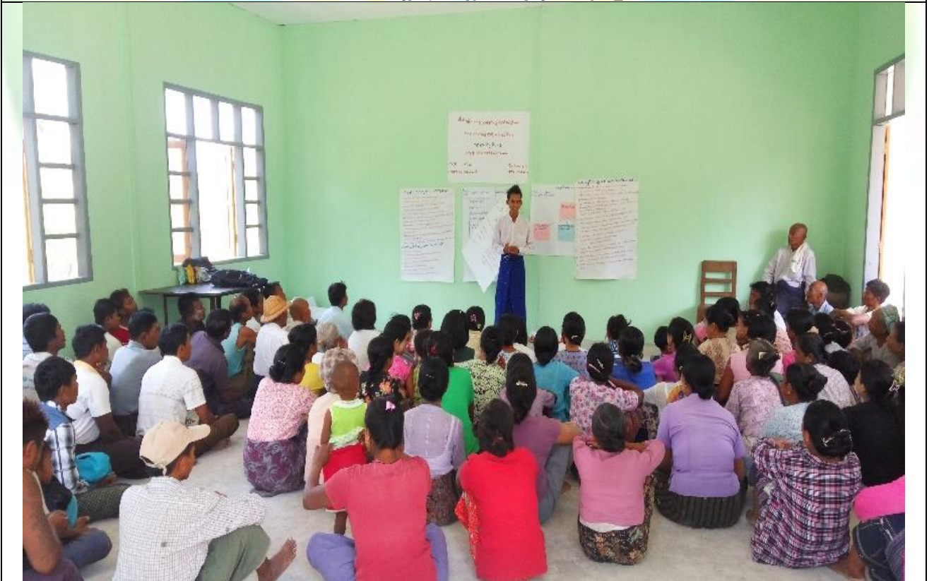
စီမံကိန်းမိတ်ဆက်အစည်းအဝေး မှတ်တမ်းခါတ်ပုံ