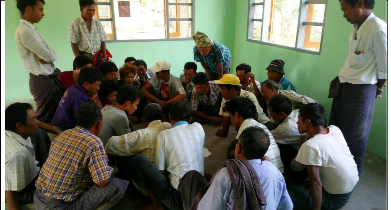
ကော်မတီရွေးချယ်ရန် မဲရေတွက်နေစဉ်