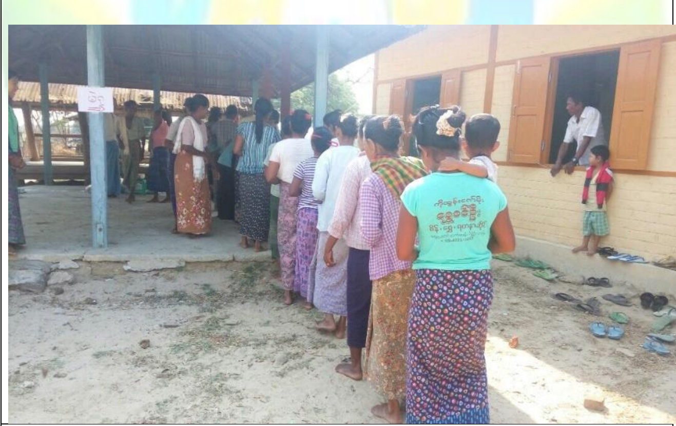
ကျေးရွာဖွံ့ဖြိုးရေးဦးစားပေးမဲပေးရန်တန်းစီနေကြစဉ်