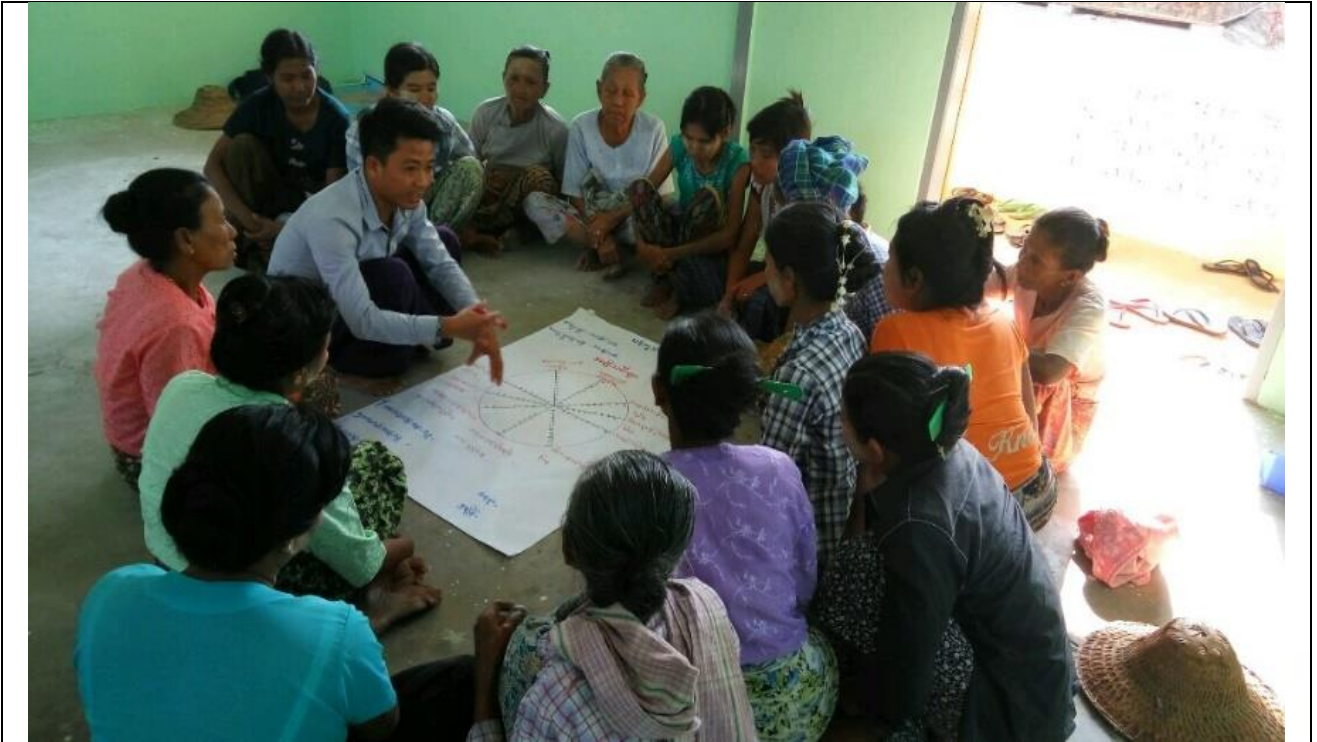
အမျိုးသမီးများပင့်ကူအိမ်ကွန်ယက်ရေးဆွဲနေစဉ် မှတ်တမ်းဓာတ်ပုံ