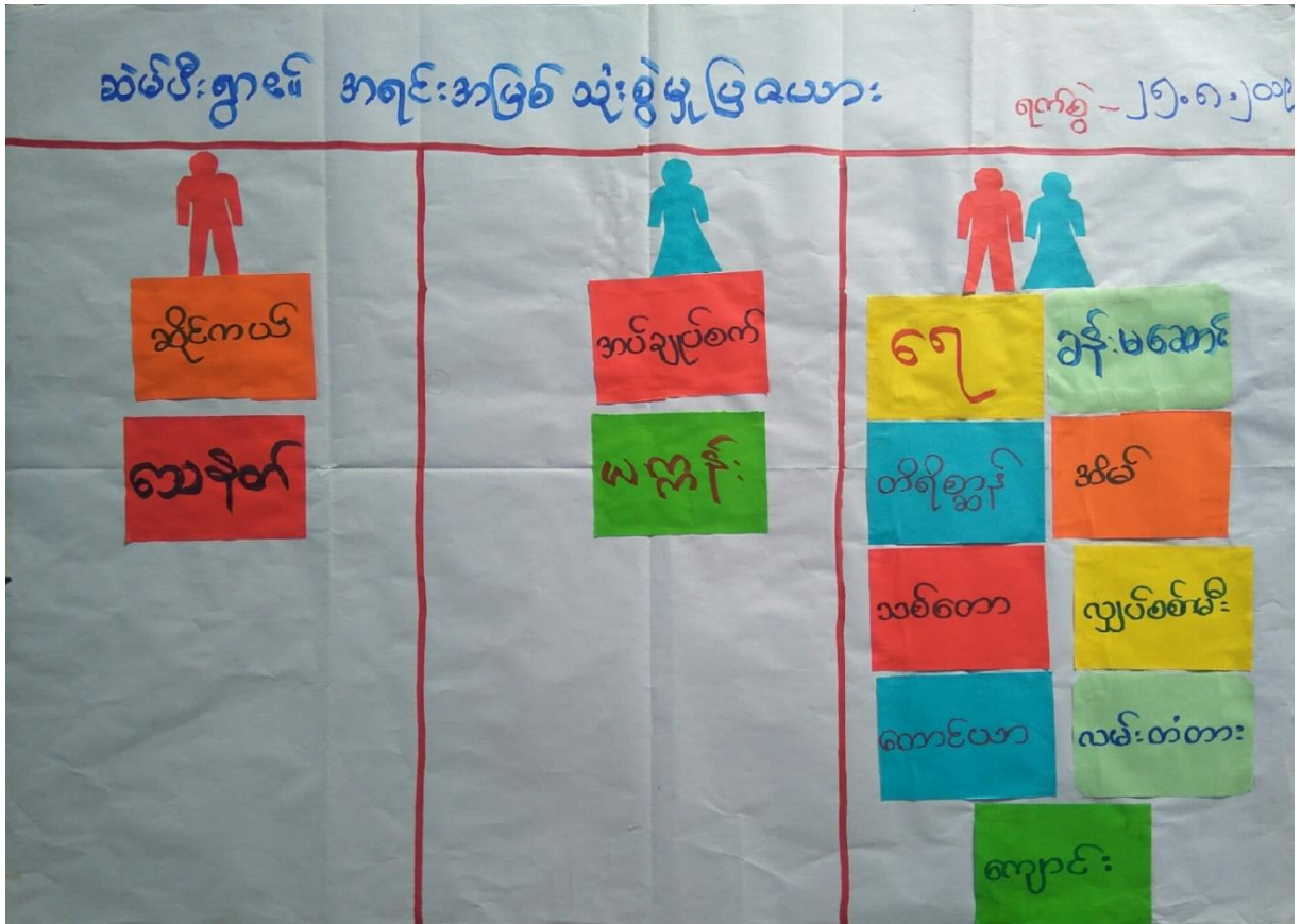
၆.၃။ ကျား/မ ရေးရာပိုင်ဆိုင်မှုသုံးသပ်ခြင်း ဆွေးနွေးခြင်းနှင့်ဆန်းစစ်ချက်