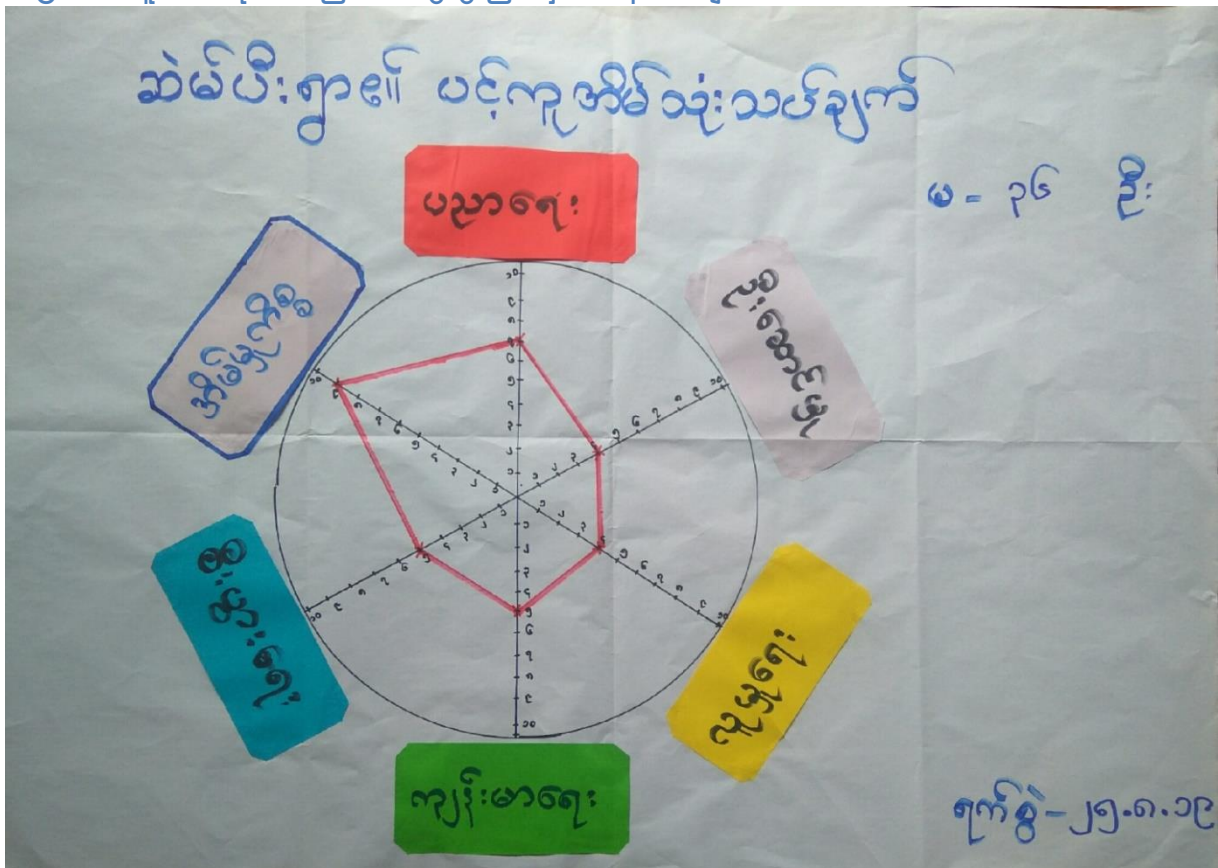
၆.၅။ ပင့်ကူအိမ်သုံးသပ်ခြင်း ဆွေးနွေးခြင်းနှင့်ဆန်းစစ်ချက်