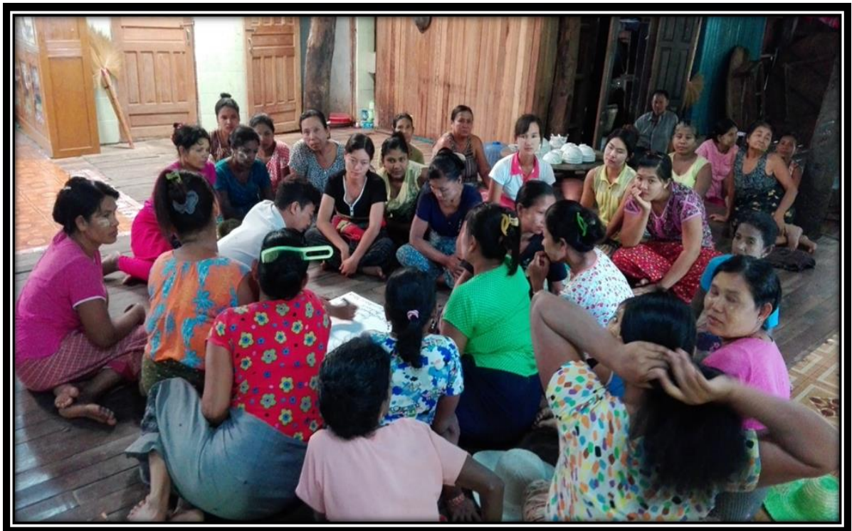
ဆယ်အိမ်စုကျေးရွာ၊ အလုပ်ကျေးရွာအုပ်စု