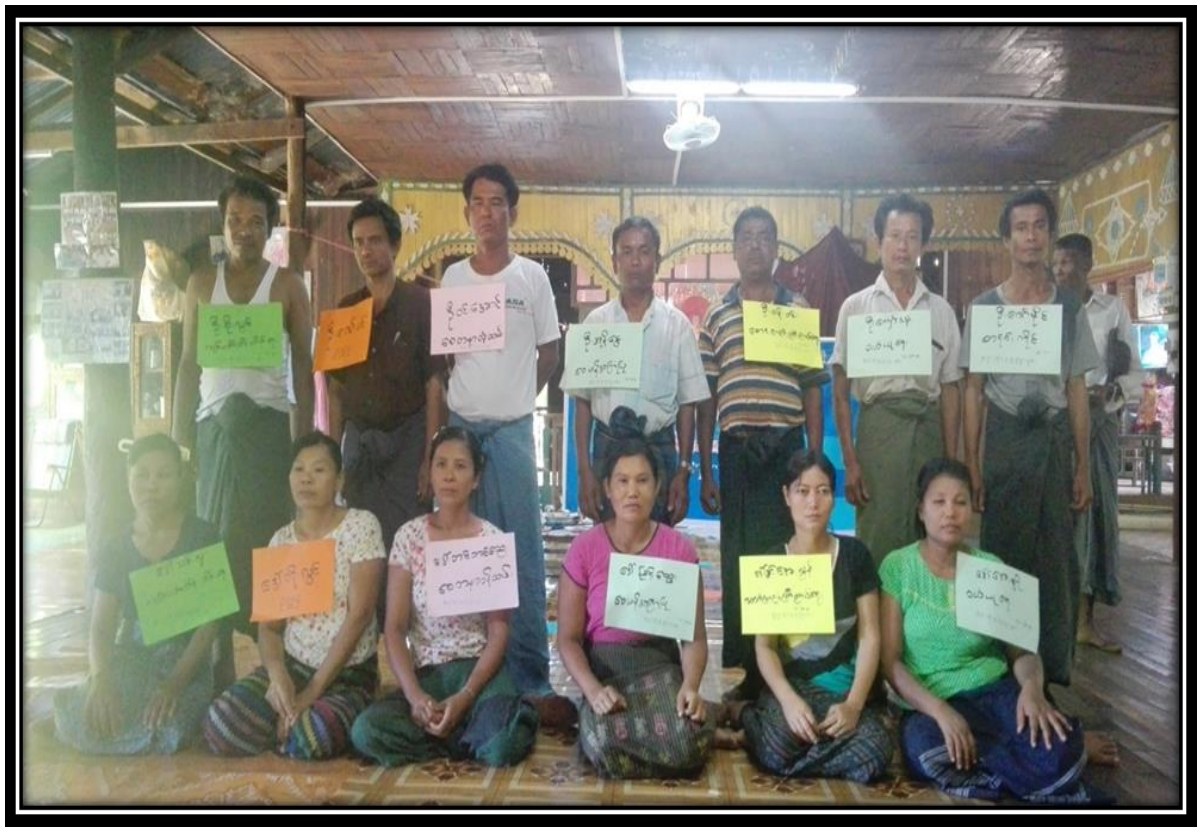
ဆယ်အိမ်စုကျေးရွာ၊ အလုပ်ကျေးရွာအုပ်စု