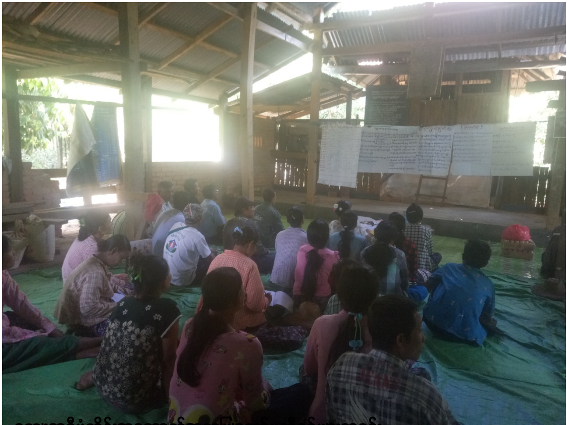
၈။ ကျေးရွာစီမံကိန်းအထောက်အကူပြုကော်ပေါ့ပင်များစာရင်း