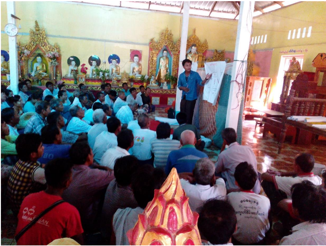
ကျေးရွာသူ၊ ကျေးရွာသားများကျေးရွာလူမှုရေးနှင့် အရင်းအမြစ်ပြုမြေပုံရေးဆွဲနေစဉ်