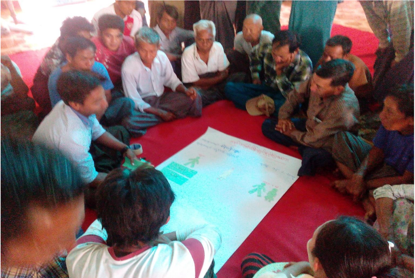
ကျေးရွာသူ၊ ကျေးရွာသားများအရင်းအမြစ် သုံးစွဲမှုနှင့် ထိန်းချုပ်မှုပြဇယားရေးဆွဲနေပုံ