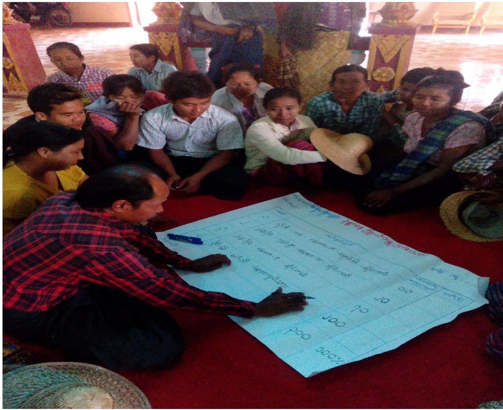
ကျေးရွာသူ၊ ကျေးရွာသားများရာသီခွင်ပြုပြင်ကွဲဒိန်ရေးဆွဲနေပုံ