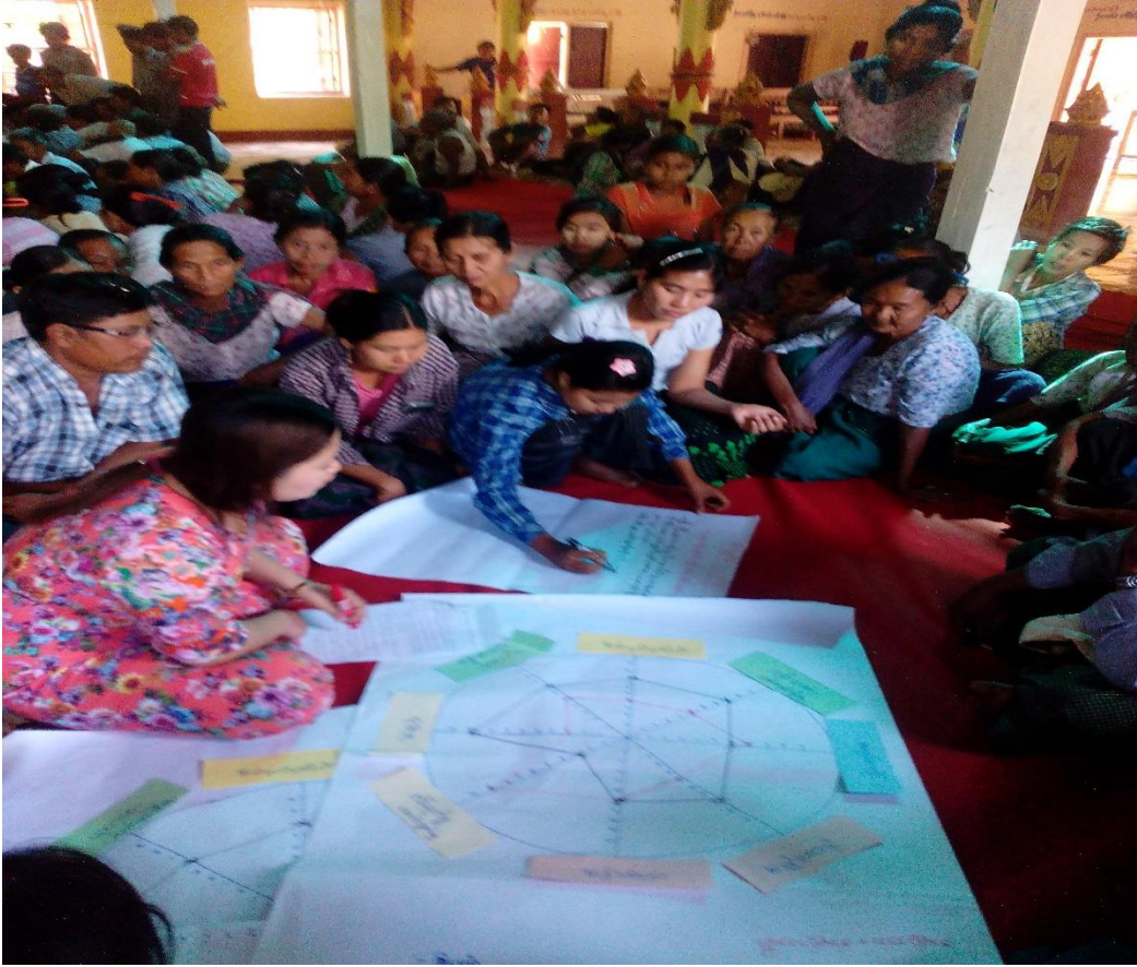
ကျေးရွာသူ၊ ကျေးရွာသားများပင့်ကူအိမ်သုံးသင်ချက်ပြဇယားရေးဆွဲနေပုံ