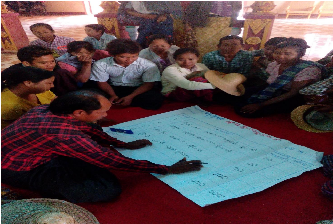
ကျေးရွာသူ၊ ကျေးရွာသားများဥစ္စာနေကြွယ်ဝမှုပြဇယားရေးဆွဲနေပုံ