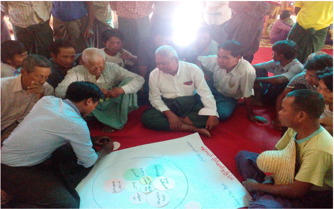
ကျေးရွာသူ၊ ကျေးရွာသားများအဖွဲ့အစည်းချိတ်ဆက်မှုပြု မြေပုံရေးဆွဲနေပုံ