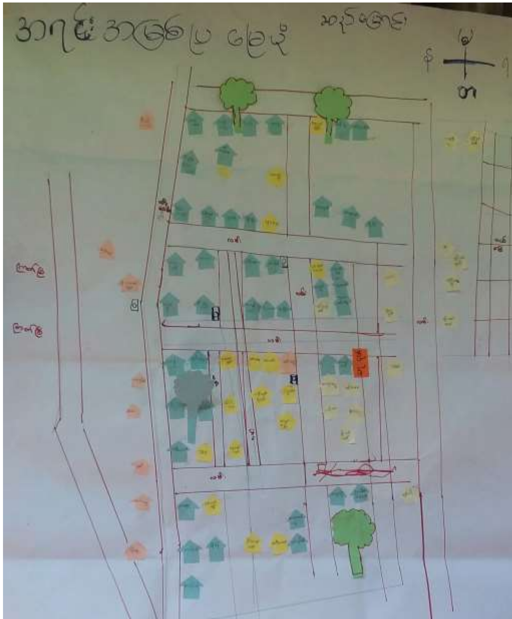
ကျေးရွာမြေပုံဆန်းစစ်ချက်