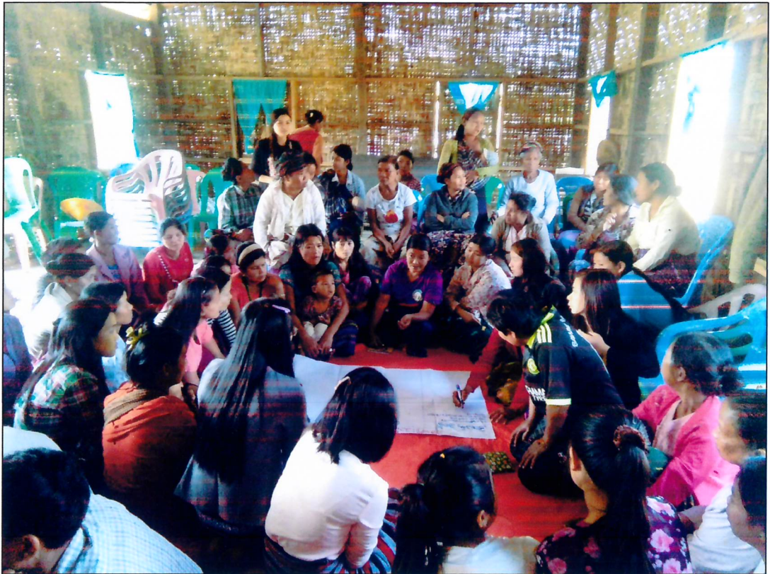
ဆောင်းခါကျေးရွာအုပ်စု၊ ဆောင်းခါကျေးရွာ အခက်အခဲများဖော်ထုတ်နေပုံ