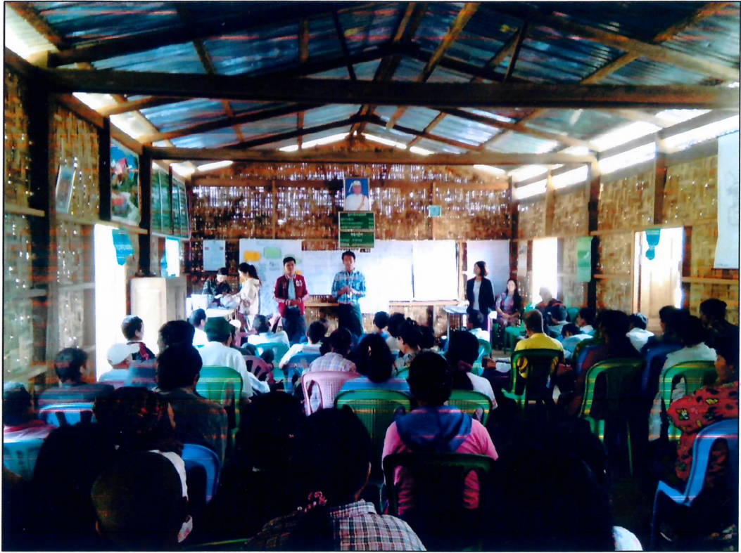
ဆောင်းခါကျေးရွာအုပ်စု၊ ဆောင်းခါကျေးရွာ ပထမနေ့ အစည်းအဝေး