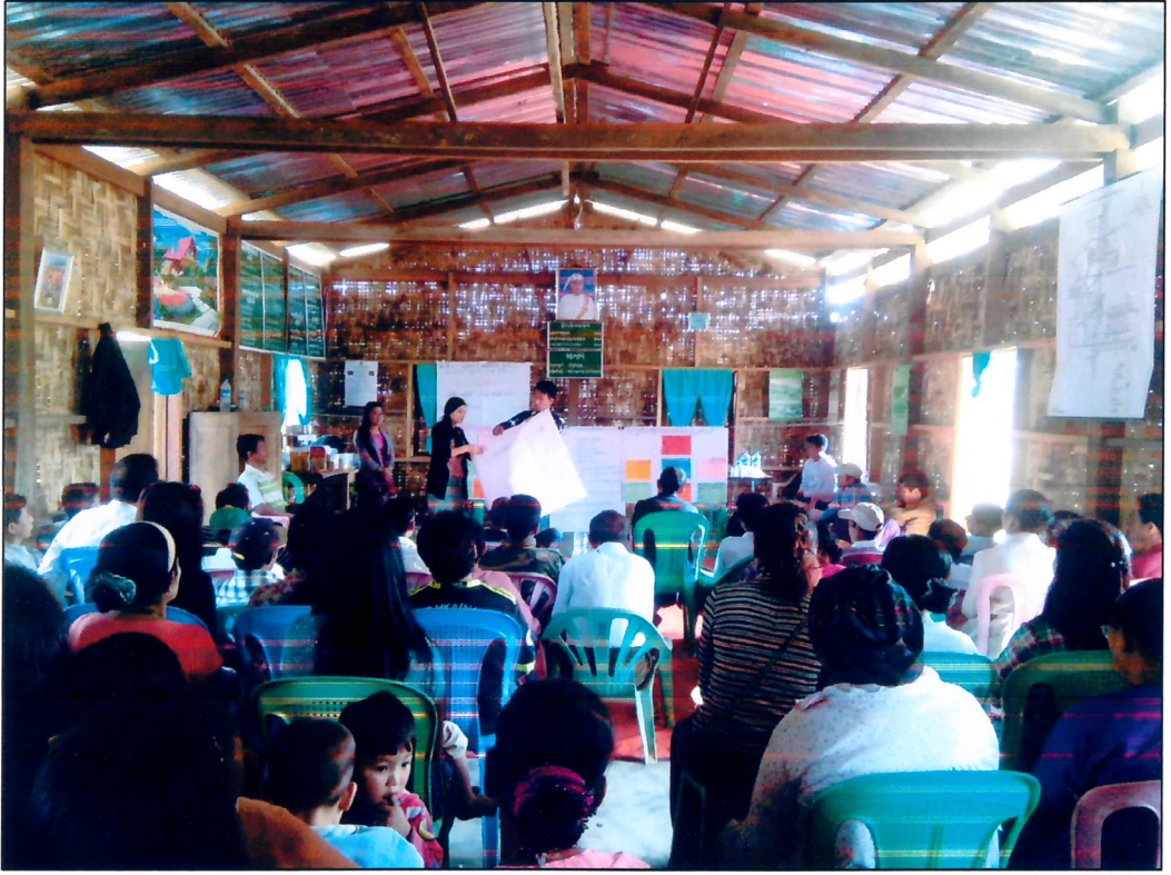
ဆောင်းခါကျေးရွာအုပ်စု၊ ဆောင်းခါကျေးရွာ ဒုတိယနေ့ အစည်းအဝေး