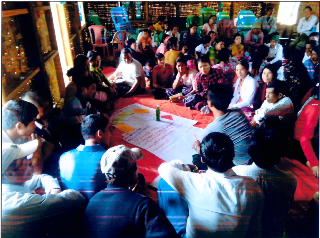
ဆောင်းခါကျေးရွာအုပ်စု၊ ဆောင်းခါကျေးရွာ VDP ရေးဆွဲနေပုံ