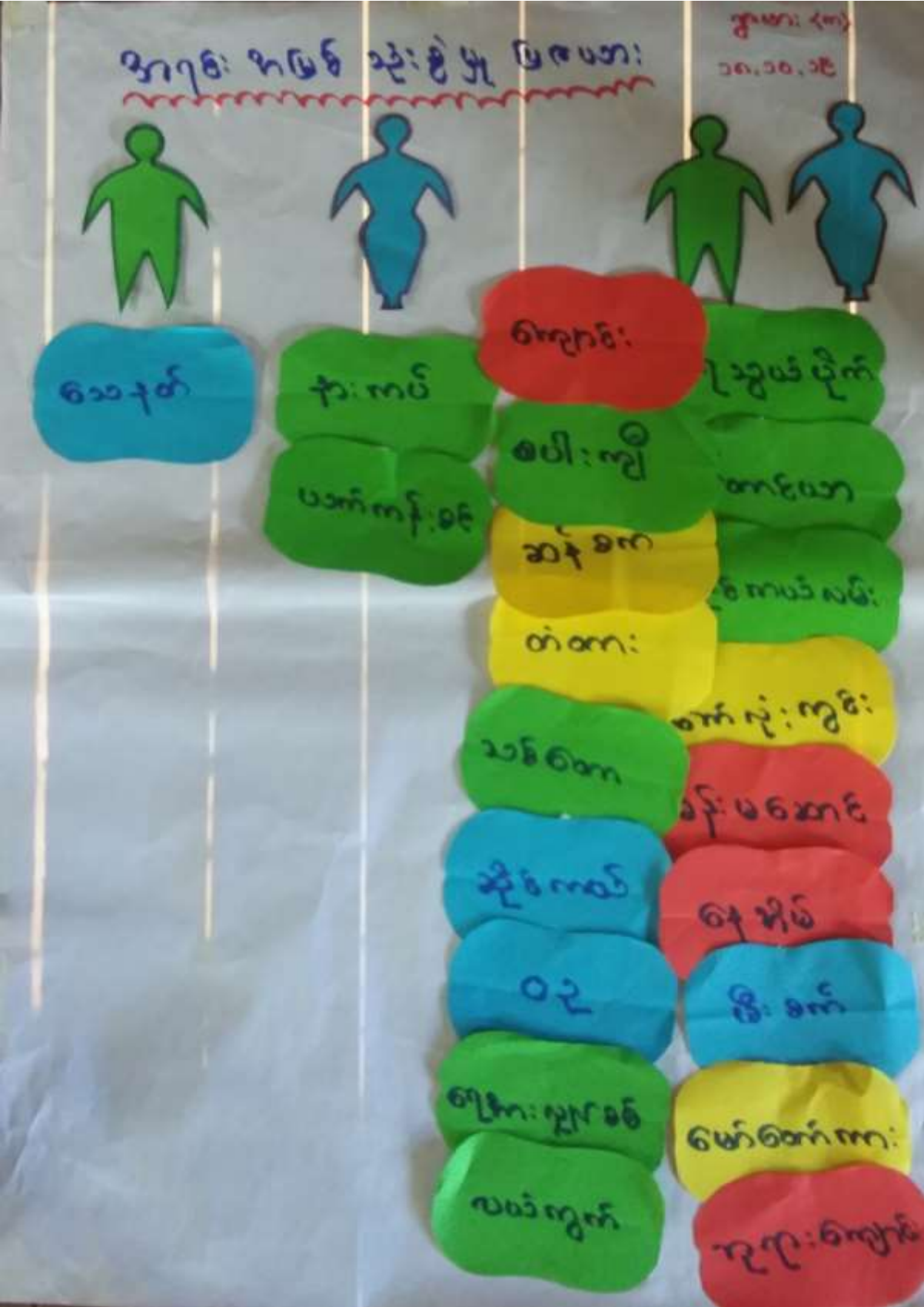
၆.၃။ ကျား/မ ရေးရာပိုင်ဆိုင်မှုသုံးသပ်ခြင်း ဆွေးနွေးခြင်းနှင့်ဆန်းစစ်ခြင်း