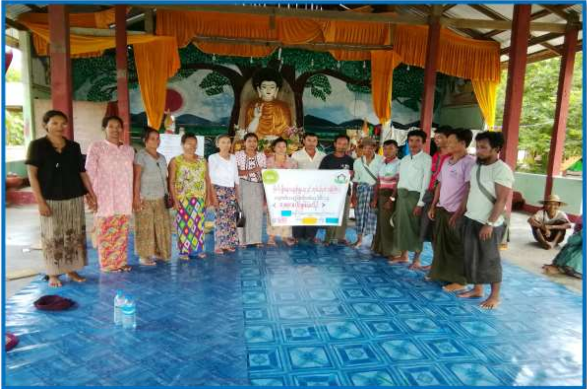
၇။ ကော်မတီဝင်များရွေးချယ်ခြင်းနှင့် ကျေးရွာဖွံ့ဖြိုးရေးအစီအစဉ်ဆောင်ရွက်မှု မှတ်တမ်းဓာတ်ပုံများ