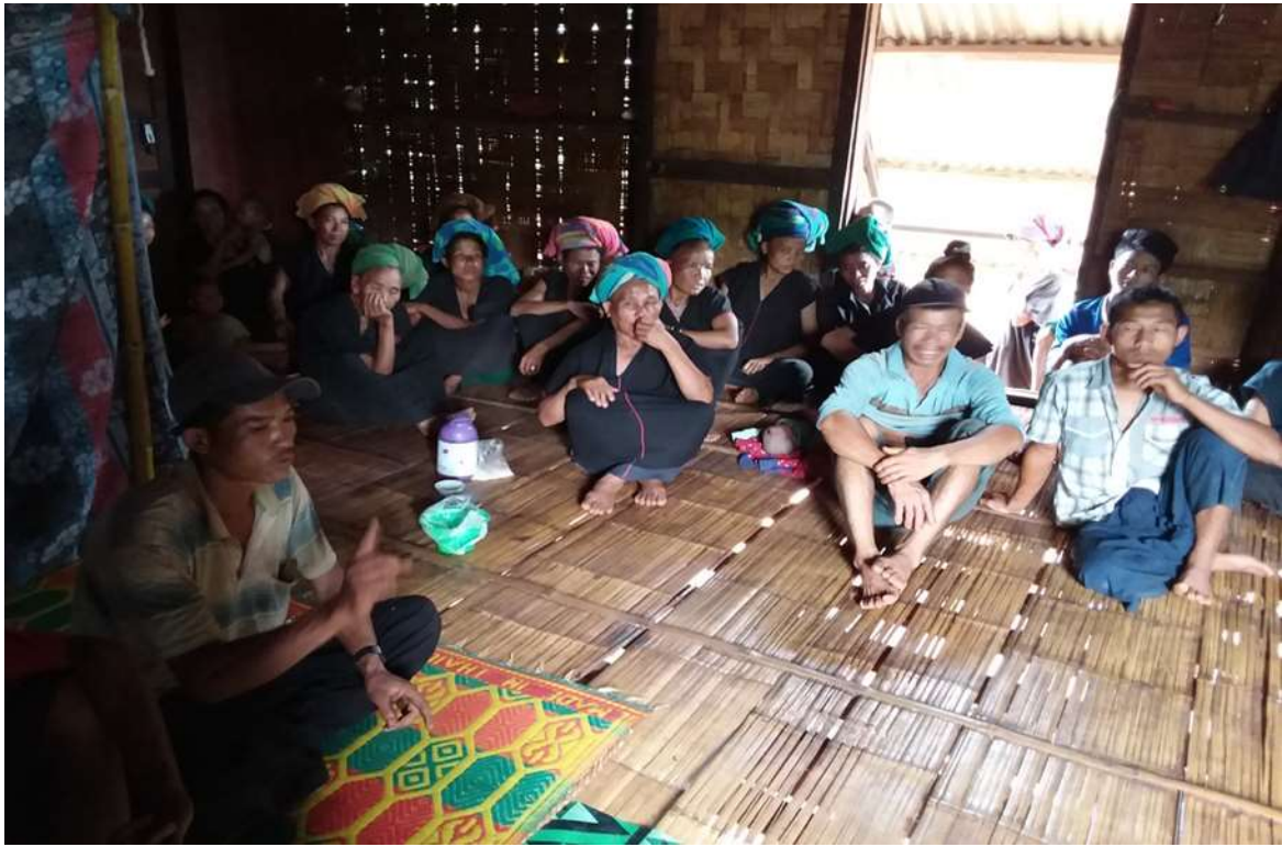
၇။ ကော်မတီဝင်များရွေးချယ်ခြင်းနှင့် ကျေးရွာဖွံ့ဖြိုးရေးအစီအစဉ် ဆောင်ရွက်မှု မှတ်တမ်းဓာတ်ပုံများ