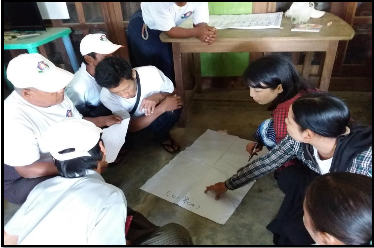
၇။ ကော်မတီဝင်များရွေးချယ်ခြင်းနှင့် ကျေးရွာဖွံ့ဖြိုးရေးအစီအစဉ်ဆောင်ရွက်မှုမှတ်တမ်းဓါတ်ပုံများ