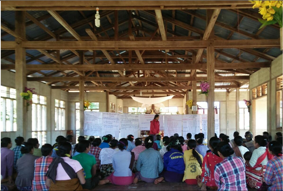
စေတနာ့ဝန်ထမ်းများ ရွေးချယ်ခြင်း မှတ်တမ်းခါတ်ပုံ