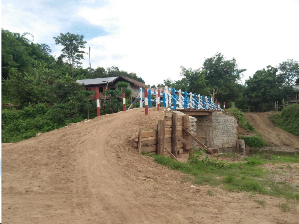
ဒုတိယနှစ်စီမံကိန်းလုပ်ငန်းခွဲဆောင်ရွက်ပြီးစီးမှုမှတ်တမ်းဓာတ်ပုံ