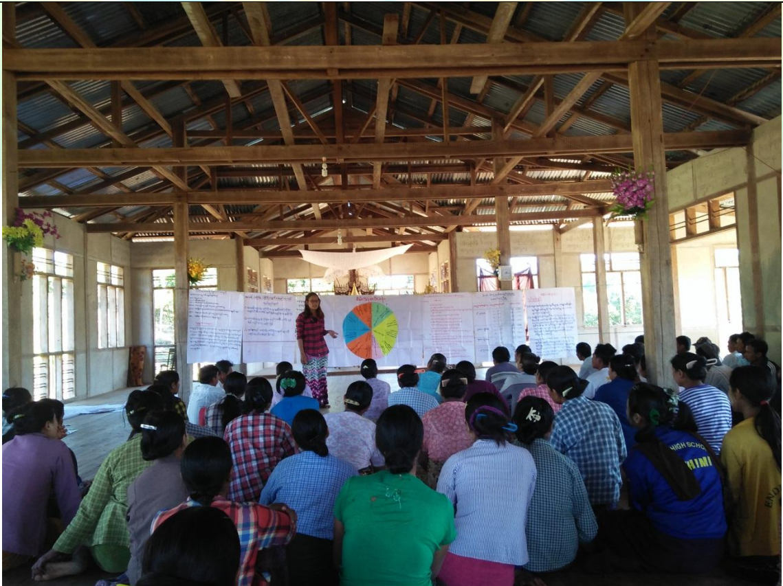
ကော်မတီရွေးချယ်ခြင်း မှတ်တမ်းခါတ်ပုံ