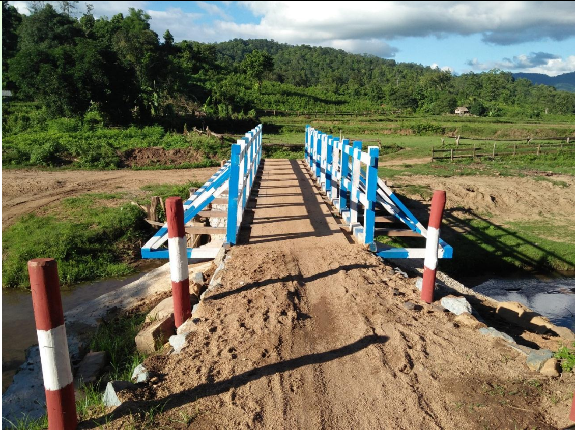
ဒုတိယနှစ်စီမံကိန်းလုပ်ငန်းခွဲဆောင်ရွက်ပြီးစီးမှုမှတ်တမ်းဓာတ်ပုံ