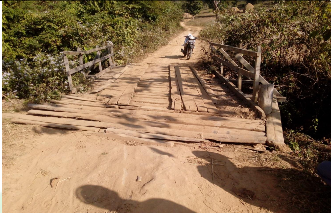
လုပ်ငန်းခွဲ၏မပြုလုပ်မီ မှတ်တမ်းခတ်ပုံ