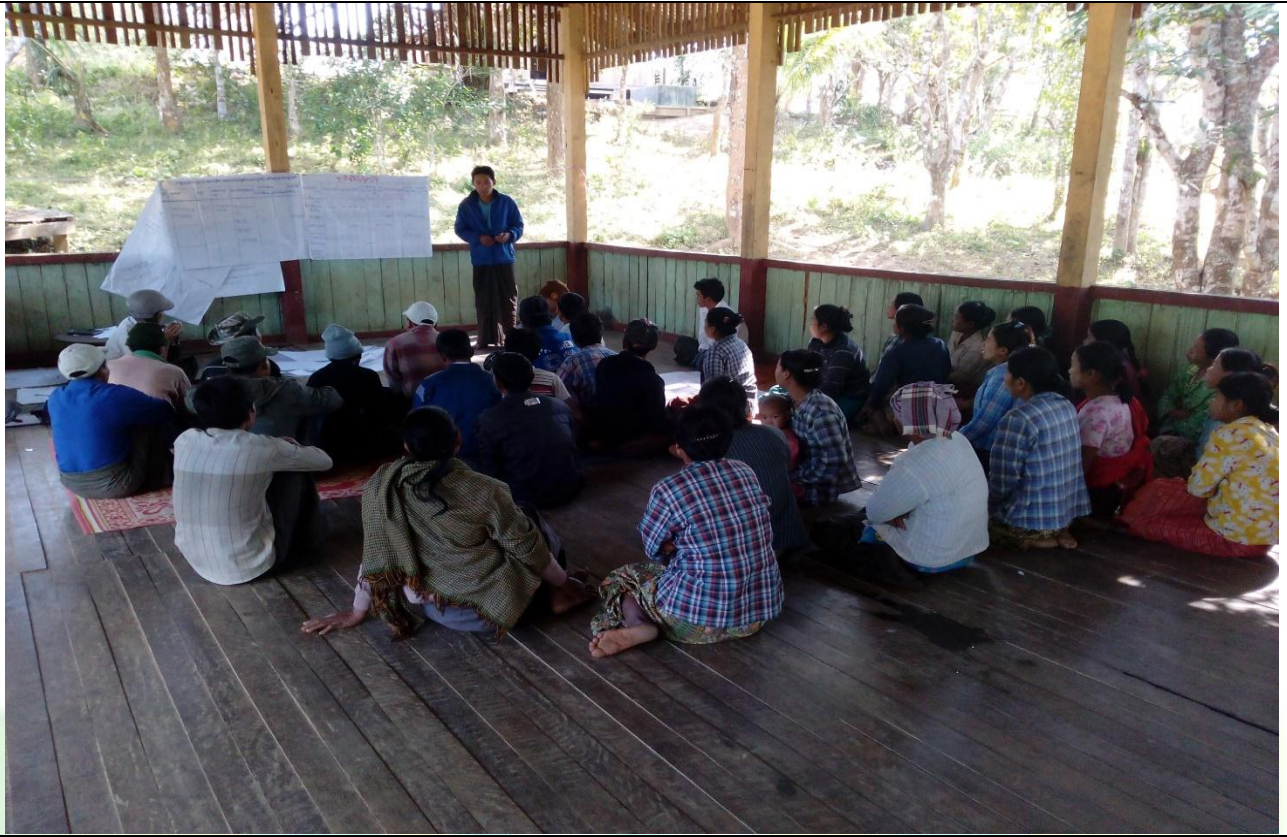
စေတနာ့ဝန်ထမ်းများ ရွေးချယ်ခြင်း မှတ်တမ်းဓါတ်ပုံ