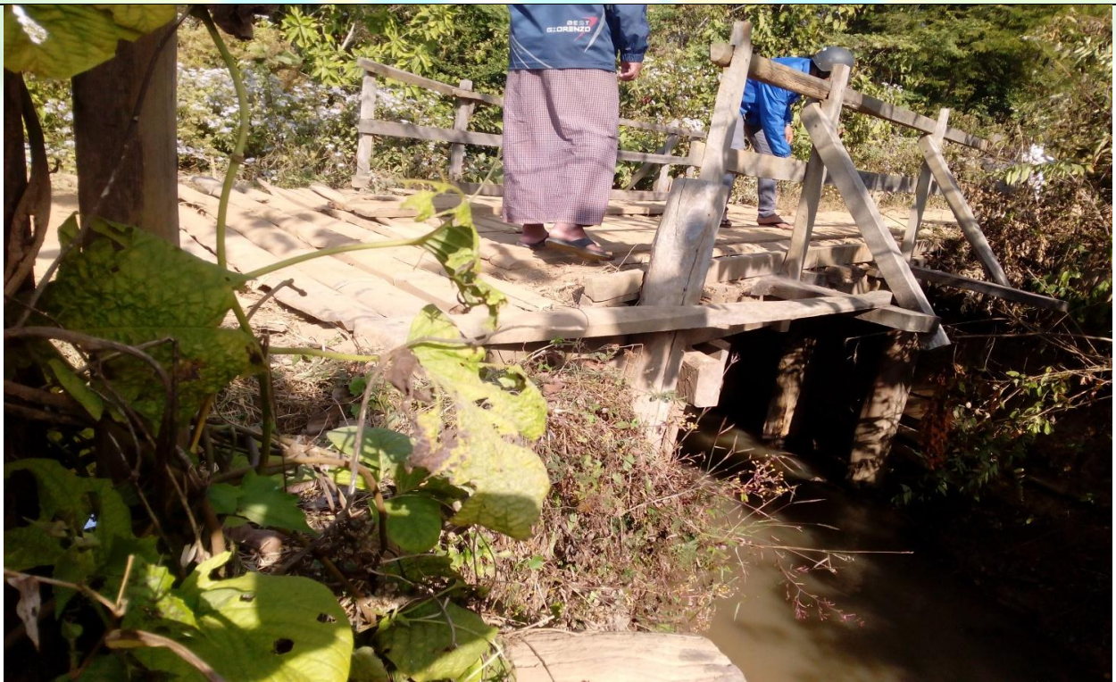
လုပ်ငန်းခွဲ၏မပြုလုပ်မီ မှတ်တမ်းခတ်ပုံ