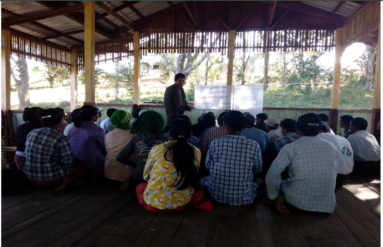
ကော်မတီရွေးချယ်ခြင်း မှတ်တမ်းဓါတ်ပုံ