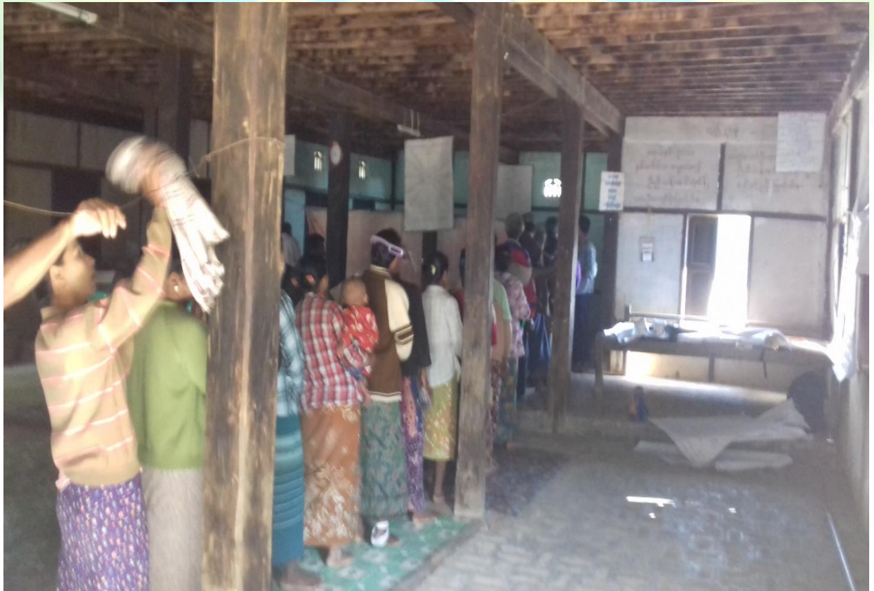
ကျေးရွာဖွံ့ဖြိုးရေးဦးစားပေးမဲပေးရန်တန်းစီနေကြစဉ်