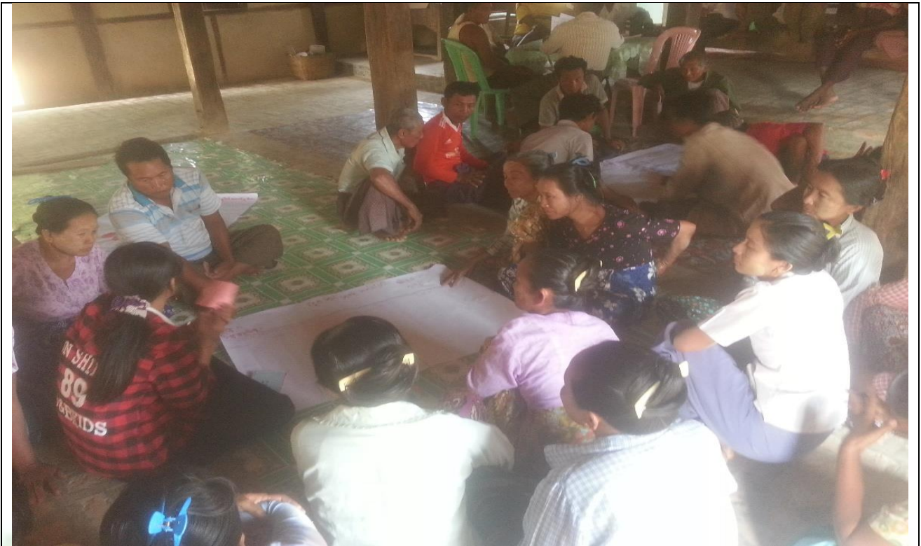
အမျိုးသမီးများပင့်ကူအိမ်ကွန်ယက်ရေးဆွဲနေစဉ် မှတ်တမ်းဓာတ်ပုံ