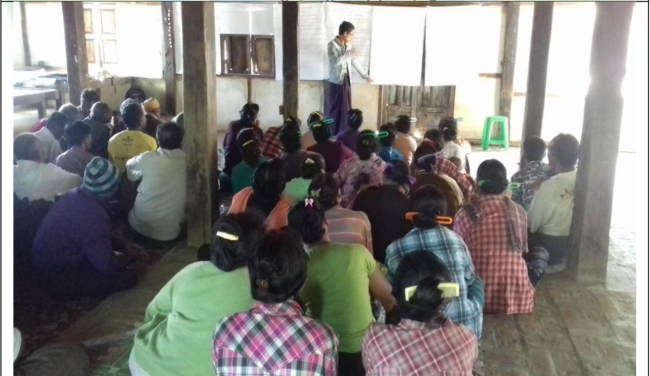
စီမံကိန်းမိတ်ဆက်အစည်းအဝေး မှတ်တမ်းခါတ်ပုံ