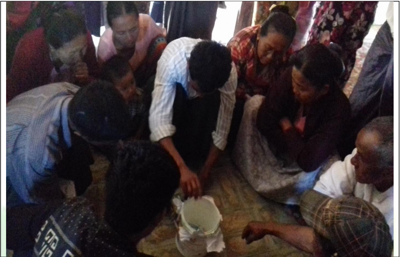
ကော်မတီရွေးချယ်ရန် မဲရေတွက်နေစဉ်

၆။ ကော်မတီဝင်များရွေးချယ်ခြင်းနှင့်ကျေးရွာဖွံ့ဖြိုးရေးအစီအစဉ်ဆောင်ရွက်မှုမှတ်တမ်းခါတ်ပုံများ