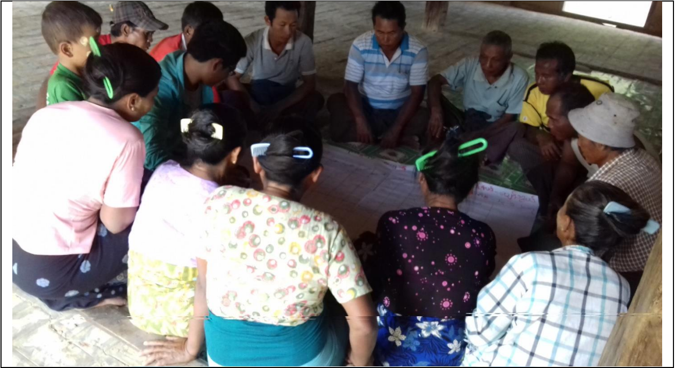
ကျေးရွာလုပ်ငန်းခွဲအတွက်အခက်အခဲများဖော်ထုတ်ဆွေးနွေးစဉ်