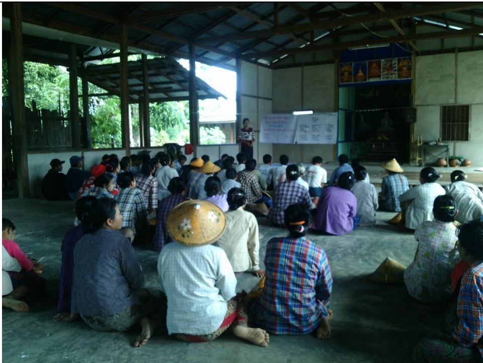
ကော်မတီရွေးချယ်ခြင်း မှတ်တမ်းဓါတ်ပုံ