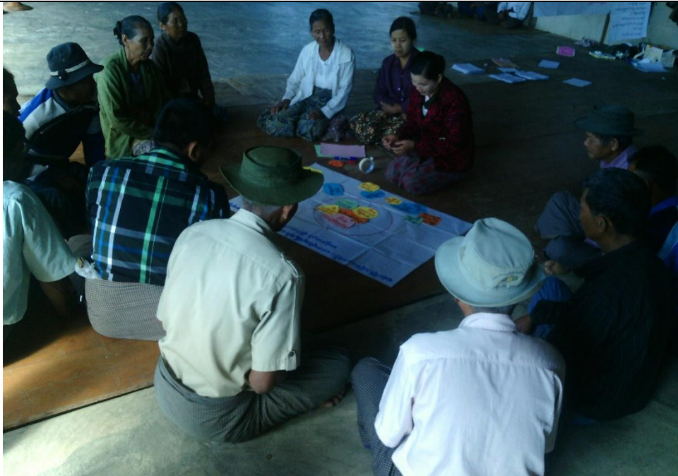
ထိခိုက်လွယ်အုပ်စုများ၏ မှတ်တမ်းခတ်ပုံ