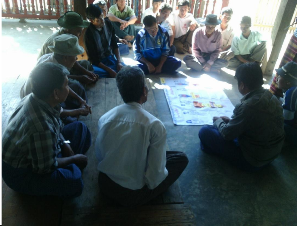
အမျိုးသားအုပ်စု၏ မှတ်တမ်းဓါတ်ပုံ