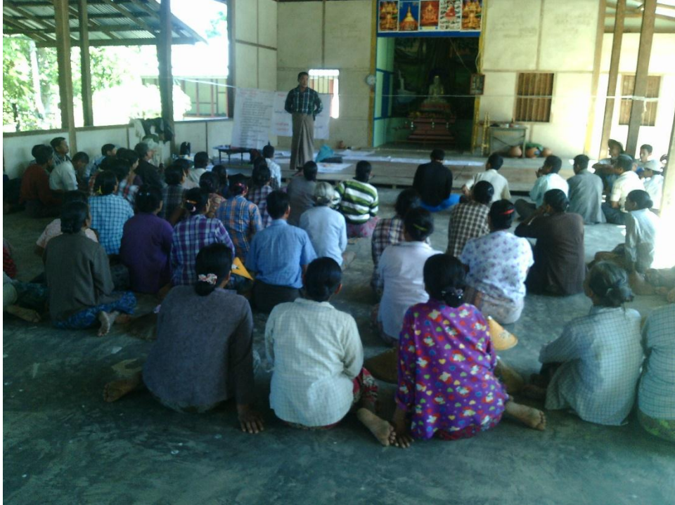
စေတနာ့ဝန်ထမ်းများ ရွေးချယ်ခြင်း မှတ်တမ်းဓါတ်ပုံ