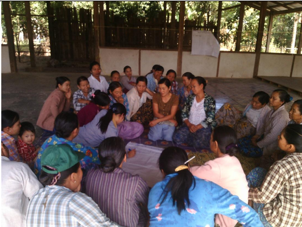
အမျိုးသမီးအုပ်စု၏ မှတ်တမ်းဓါတ်ပုံ