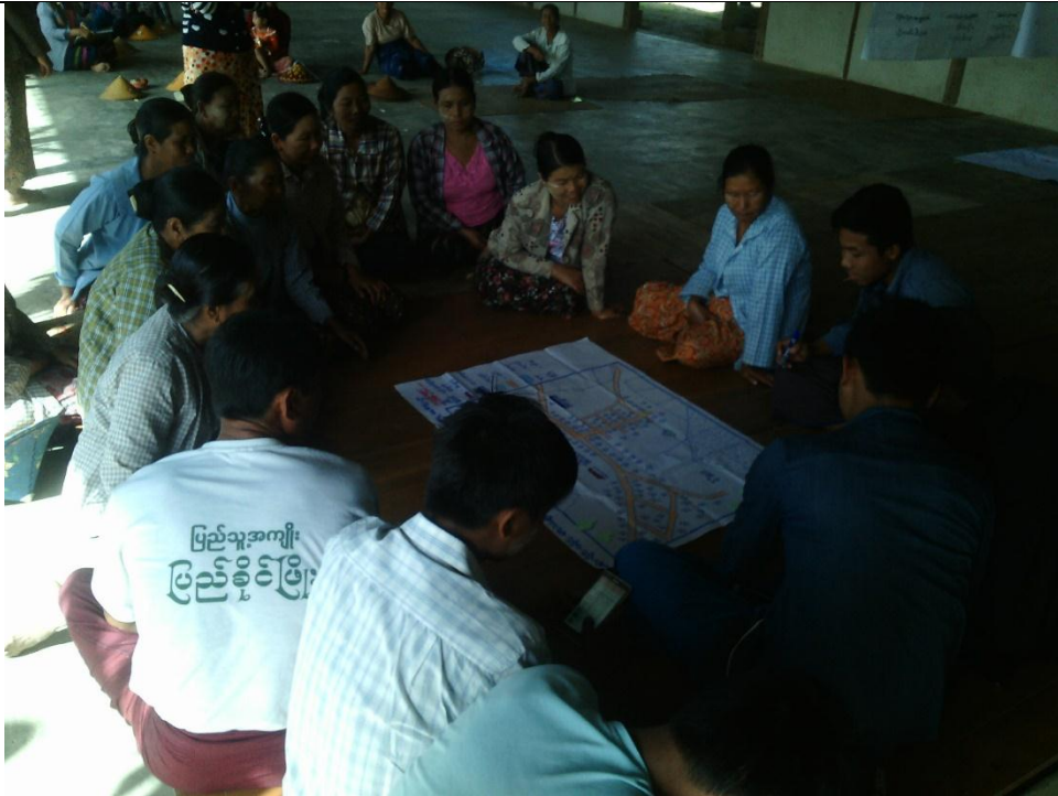
လူငယ်အုပ်စု၏ မှတ်တမ်းခတ်ပုံ