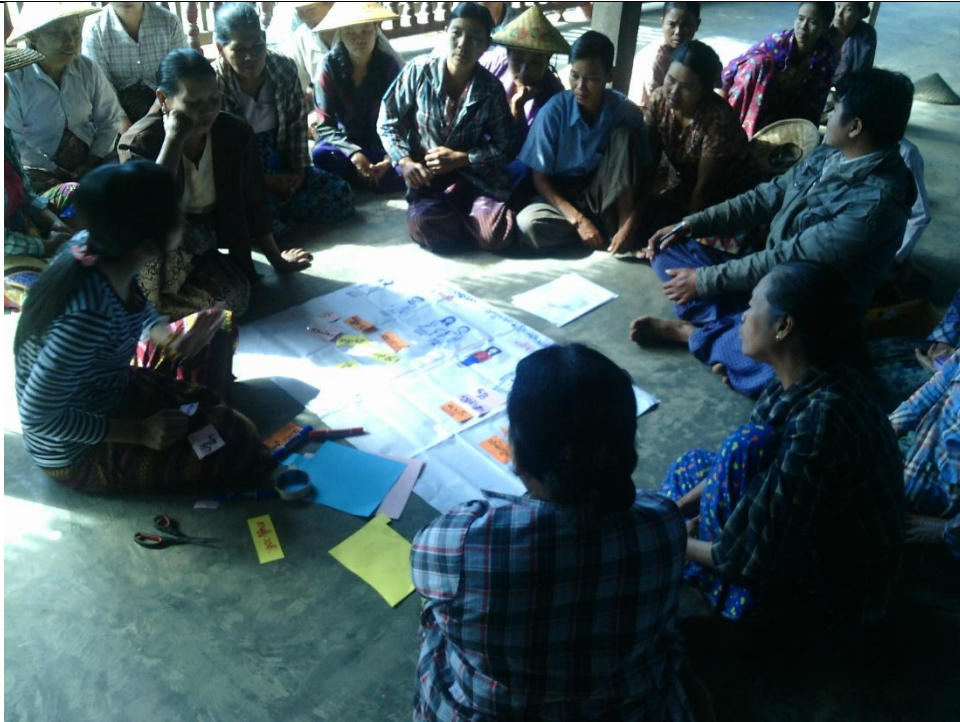
ဖွံ့ဖြိုးရေးအစီအစဉ်ရေးဆွဲခြင်း မှတ်တမ်းဓာတ်ပုံ