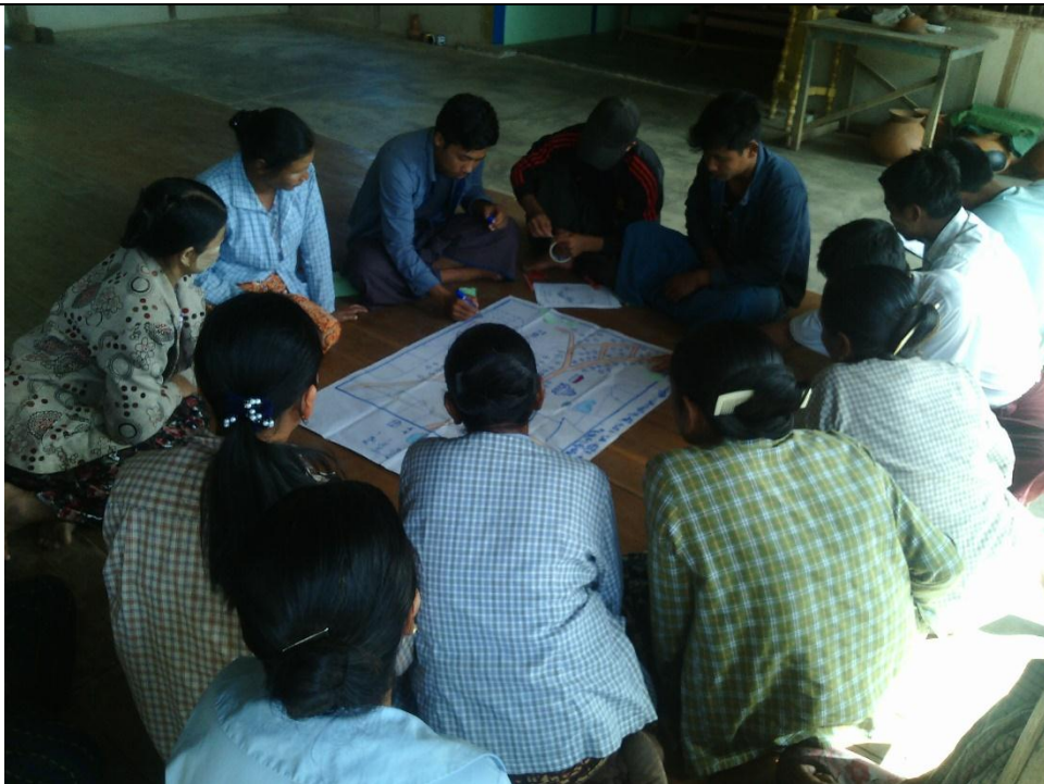
ဖွံ့ဖြိုးရေးအစီအစဉ်ရေးဆွဲခြင်း မှတ်တမ်းဓာတ်ပုံ