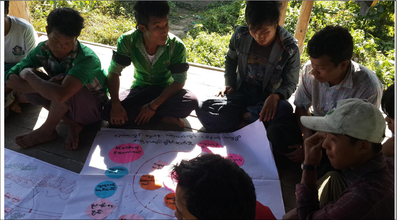
လူငယ်အုပ်စု၏ မှတ်တမ်းဓါတ်ပုံ