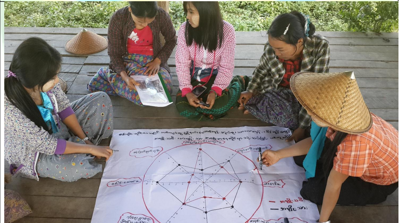
ထိခိုက်လွယ်အုပ်စုများ၏ မှတ်တမ်းဓါတ်ပုံ