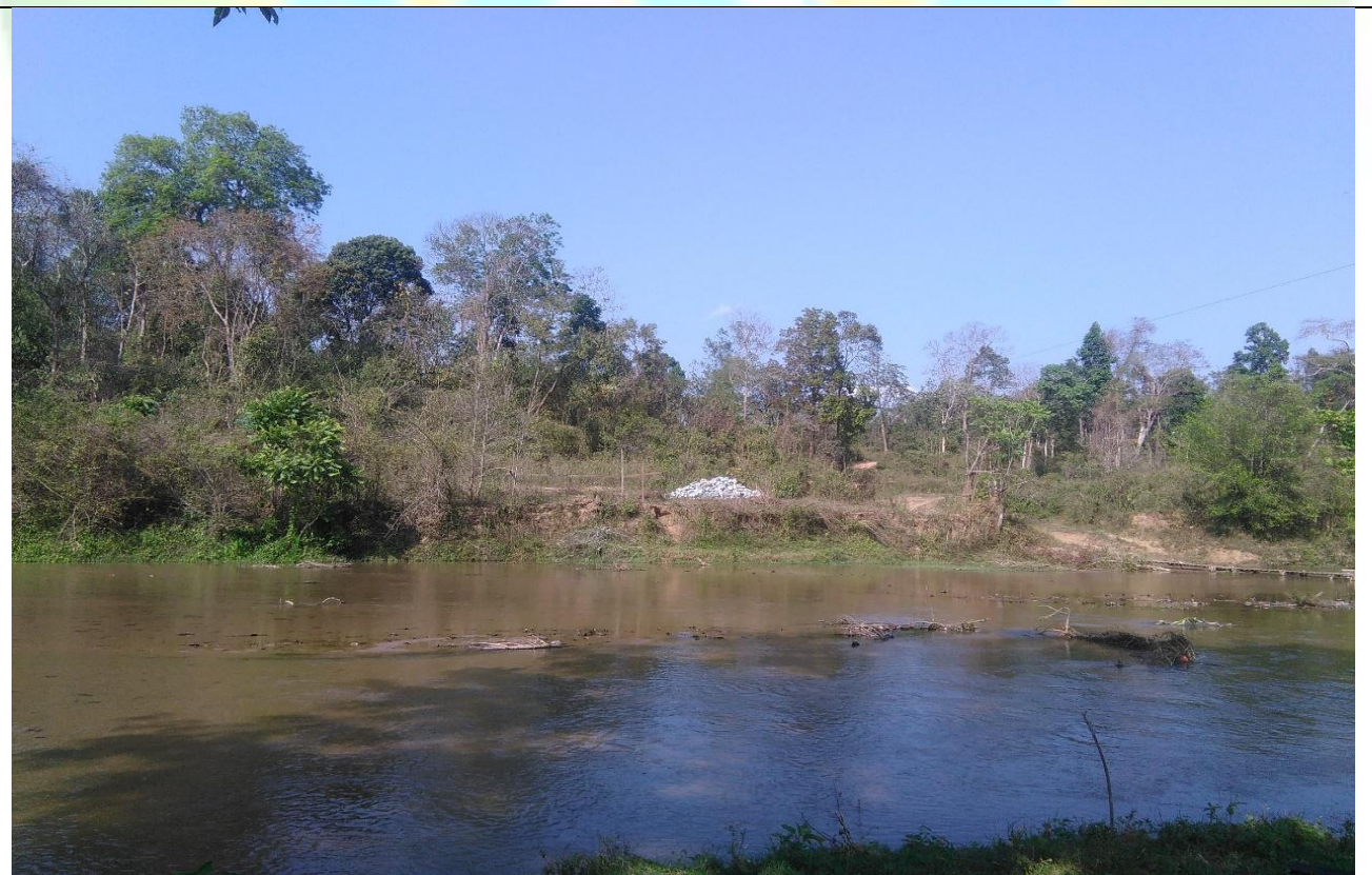
လုပ်ငန်းခွဲ၏မပြုလုပ်မီ မှတ်တမ်းဓာတ်ပုံ