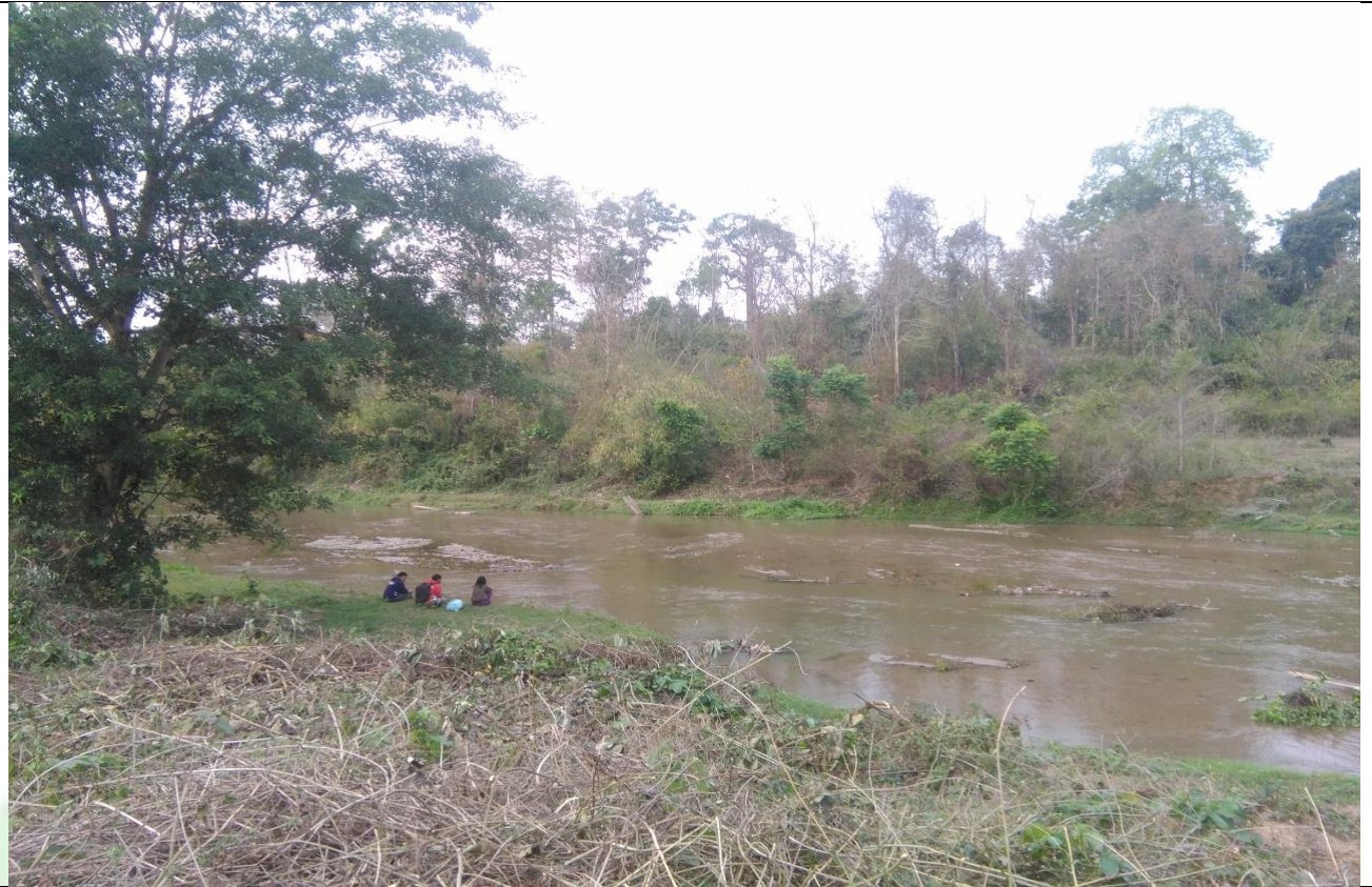
လုပ်ငန်းခွဲ၏မပြုလုပ်မီ မှတ်တမ်းဓာတ်ပုံ