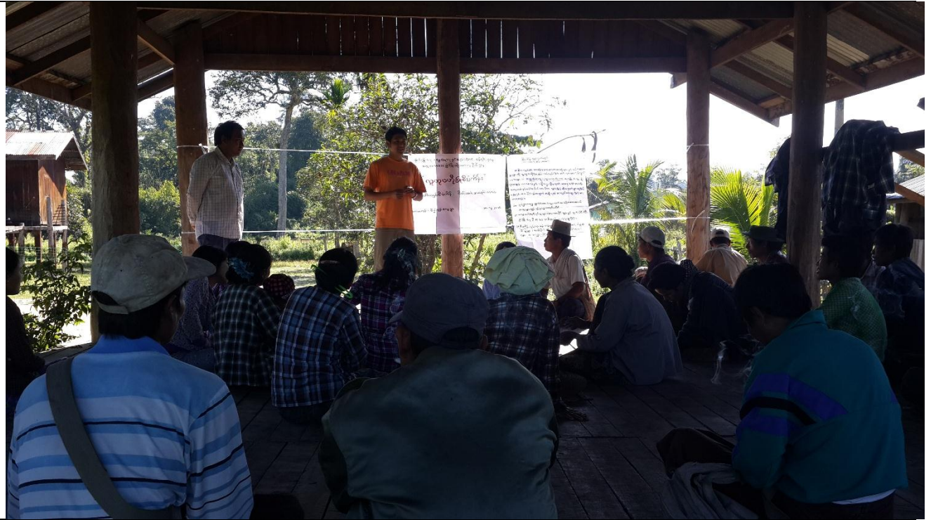
စေတနာ့ဝန်ထမ်းများ ရွေးချယ်ခြင်း မှတ်တမ်းဓါတ်ပုံ