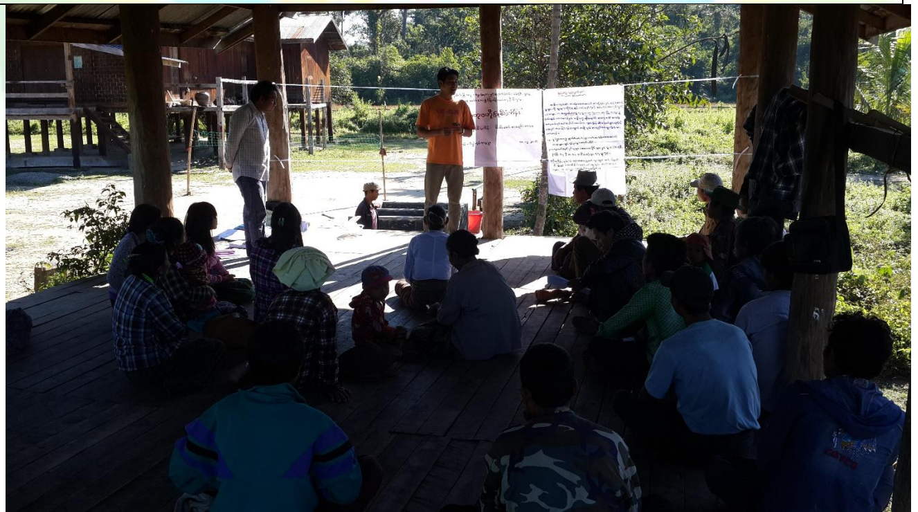
ကော်မတီရွေးချယ်ခြင်း မှတ်တမ်းဓါတ်ပုံ