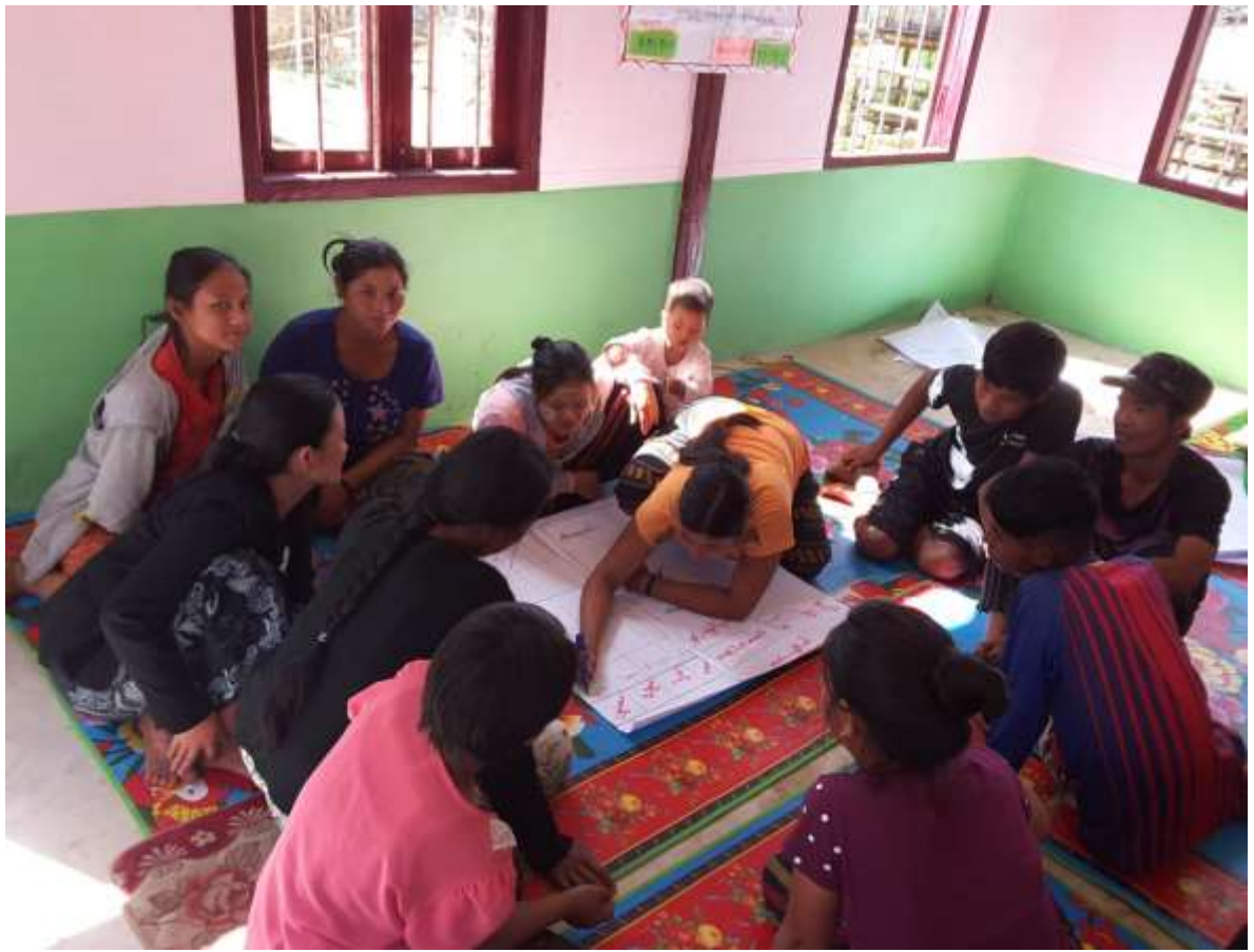
၇။ ကော်မတီဝင်များရွေးချယ်ခြင်းနှင့် ကျေးရွာဖွံ့ဖြိုးရေးအစီအစဉ် ဆောင်ရွက်မှု မှတ်တမ်းဓါတ်ပုံများ