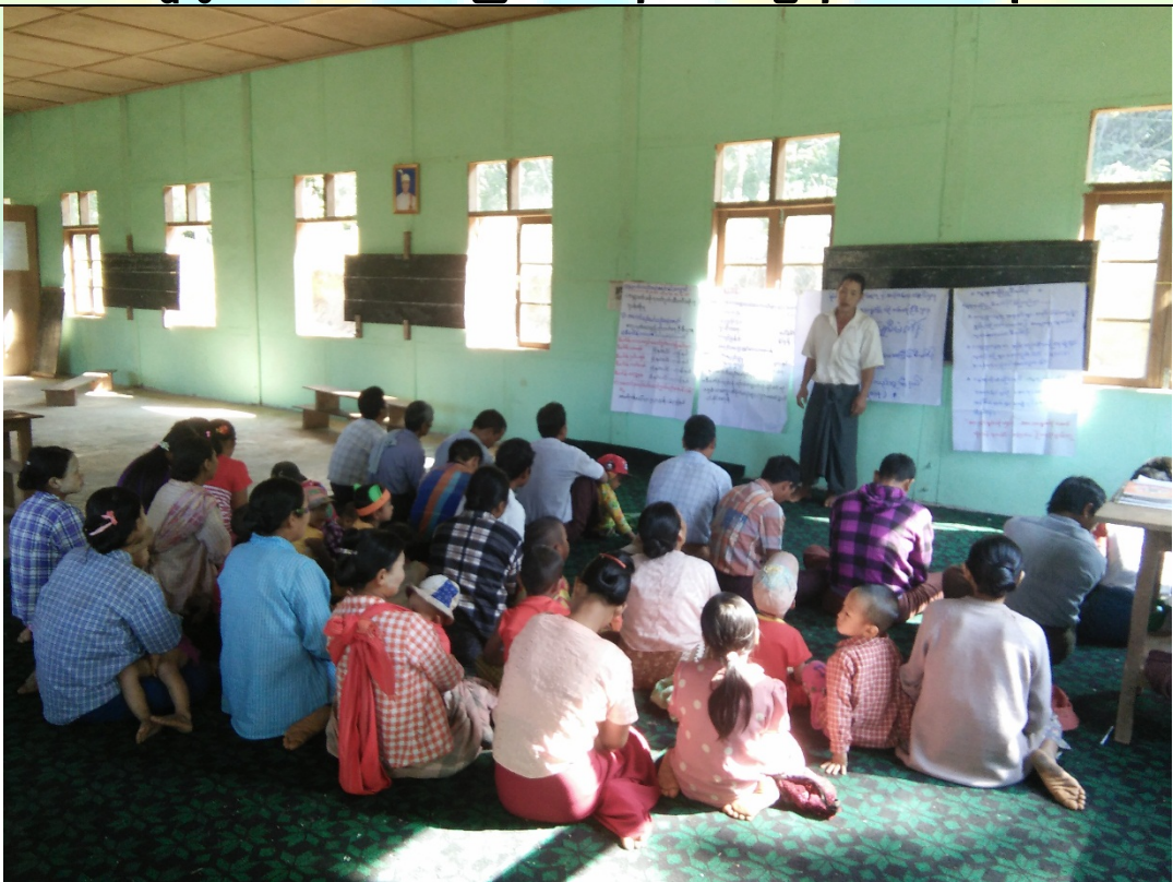
ဖွံ့ဖြိုးရေးအစီအစဉ်ရေးဆွဲခြင်အစည်းအဝေးမှတ်တမ်းခါတ်ပုံ