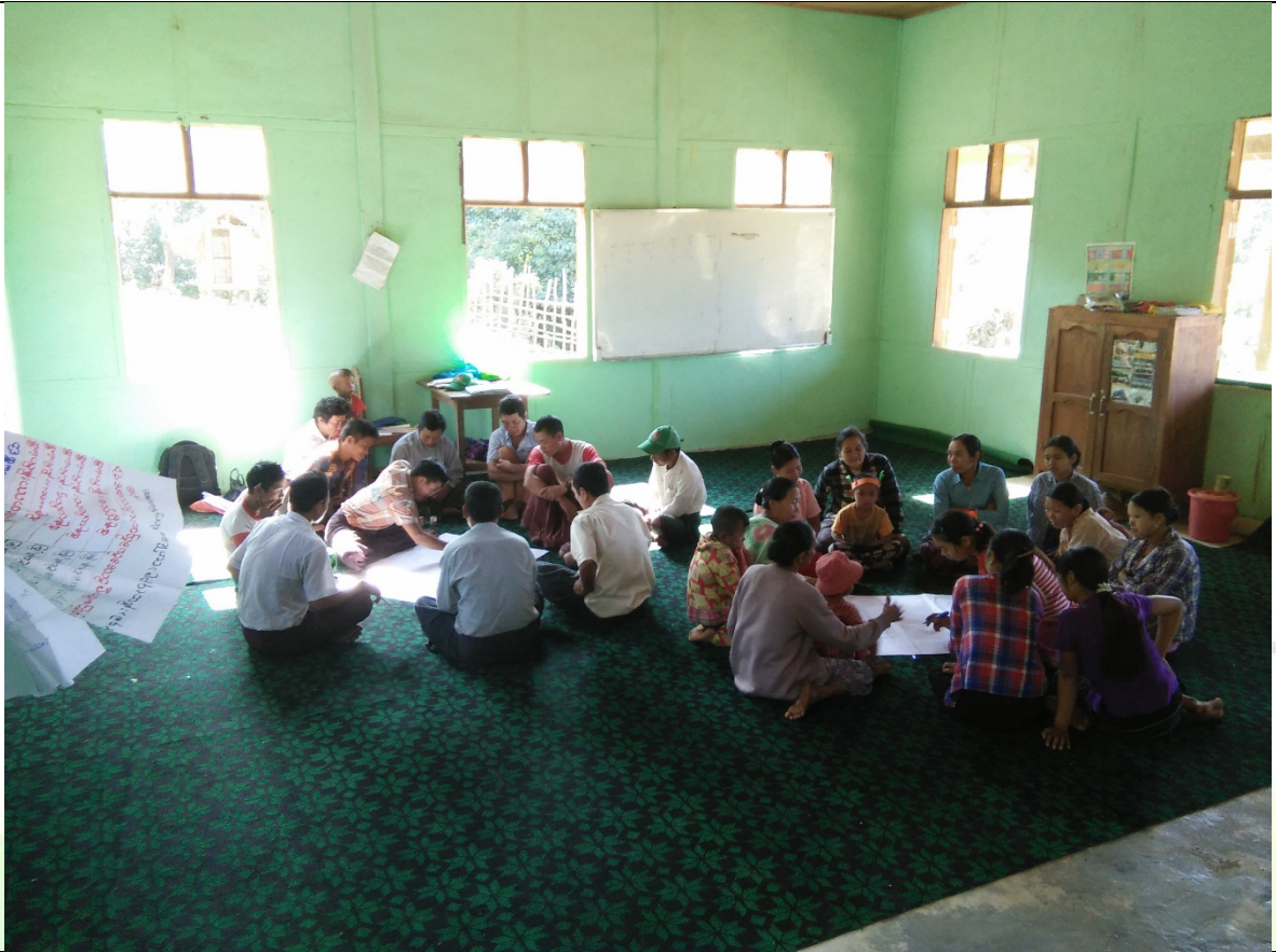
ဖွံ့ဖြိုးရေးအစီအစဉ်ရေးဆွဲခြင်းအစည်းအဝေးမှတ်တမ်းဓာတ်ပုံ