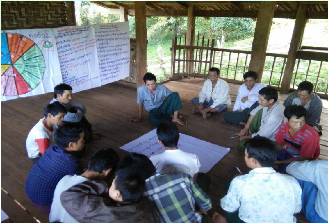
ဖွံ့ဖြိုးရေးလုပ်ငန်းများအစီအစဉ်ရေးဆွဲခြင်းအစည်းအဝေးမှတ်တမ်းဓာတ်ပုံ