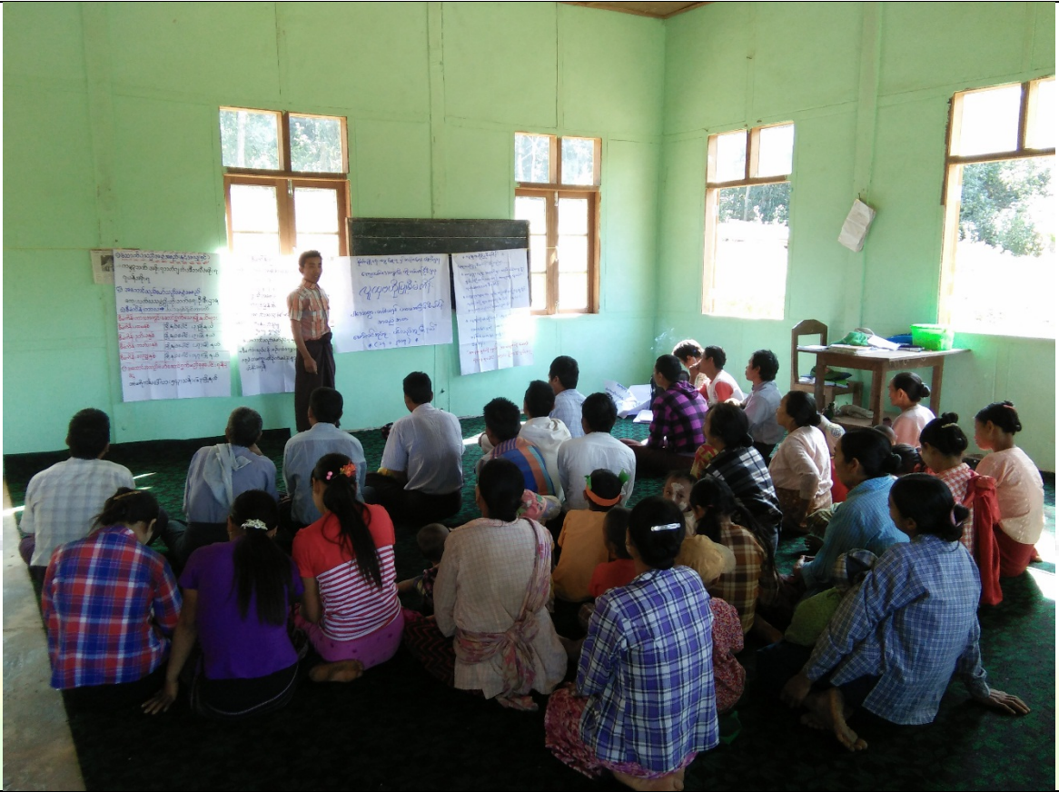
ရွာခွဲခေါင်းဆောင်၏ အစည်းအဝေးအမှာစကားပြောမှတ်တမ်းခါတ်ပုံ