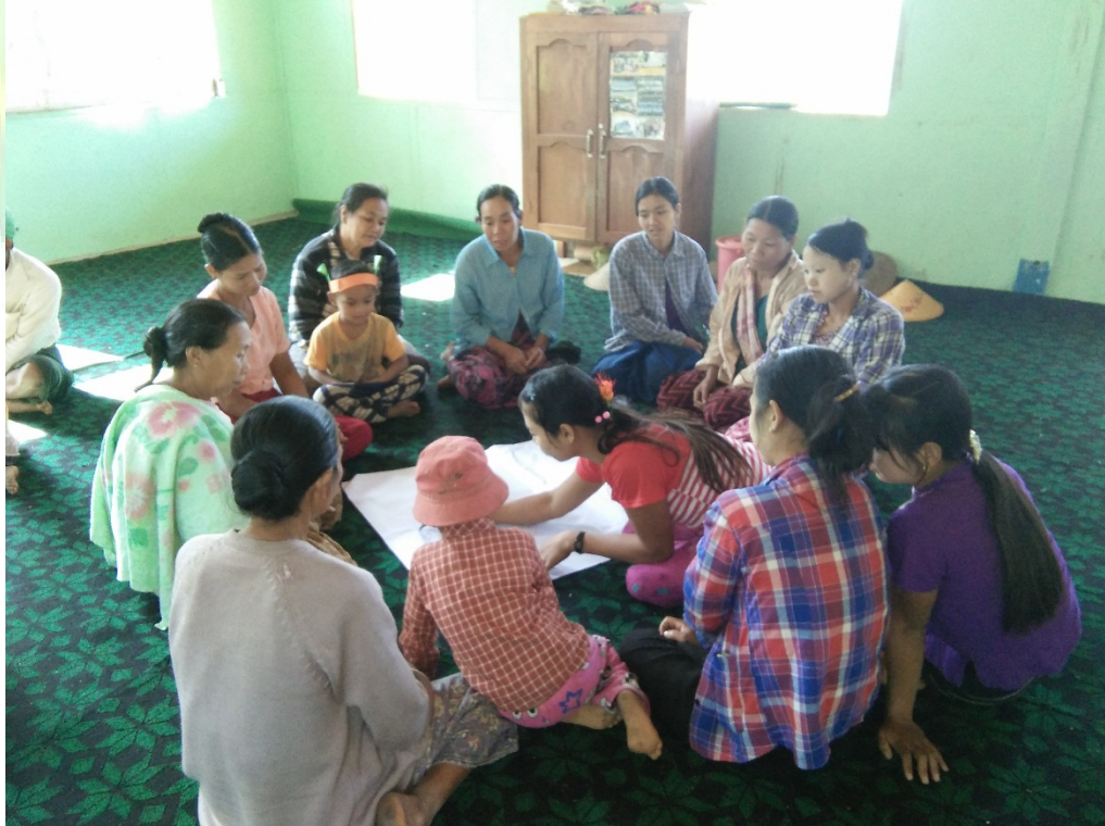
အမျိုးသမီးအုပ်စု၏မှတ်တမ်းခါတ်ပုံ