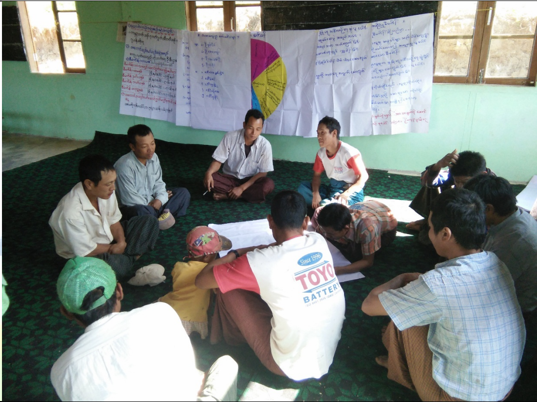
အမျိုးသားအုပ်စု၏မှတ်တမ်းခါတ်ပုံ