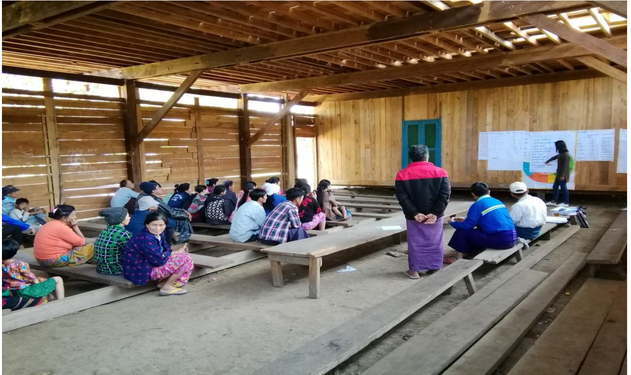
၇။ ကော်မတီဝင်များရွေးချယ်ခြင်းနှင့် ကျေးရွာဖွံ့ဖြိုးရေးအစီအစဉ် ဆောင်ရွက်မှု မှတ်တမ်းဓါတ်ပုံများ