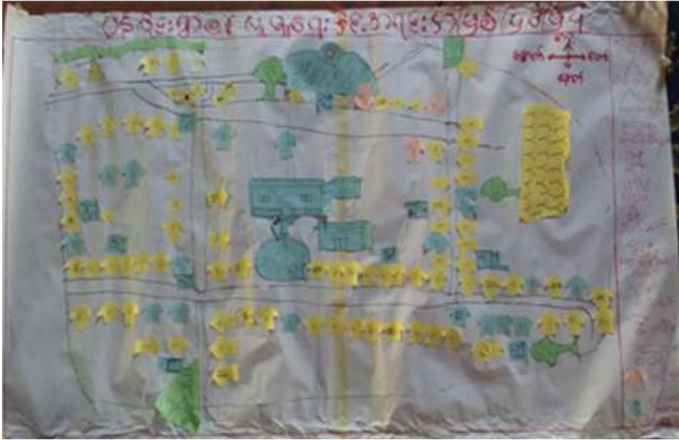
ဘုရားမာရ်ကိစ္စခြေပုံ ဆန်းစစ်ချက်