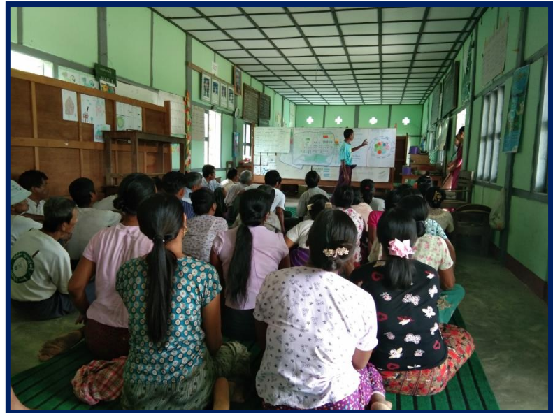
ကျေးရွာကိုယ်စားလှယ်မှပြန်လည်တင်ပြခြင်း