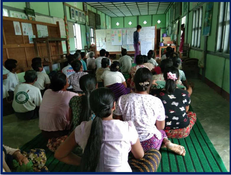
ကျေးရွာကိုယ်စားလှယ်မှပြန်လည်တင်ပြခြင်း