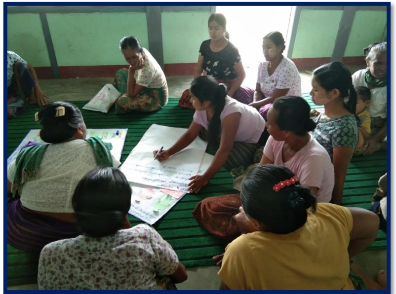
အဖွဲ့လိုက်ဆွေးနွေးမှုပြုလုပ်နေပုံ