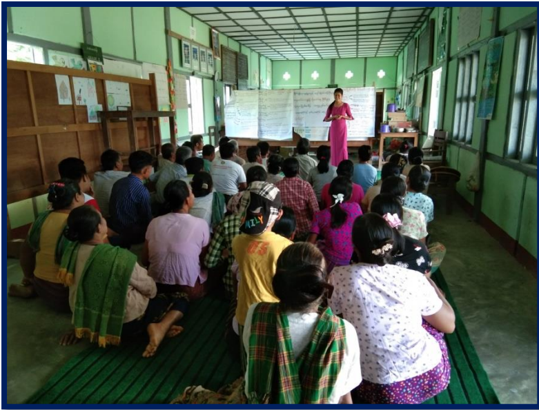
ကျေးရွာအစည်းအဝေးပြုလုပ်နေပုံ