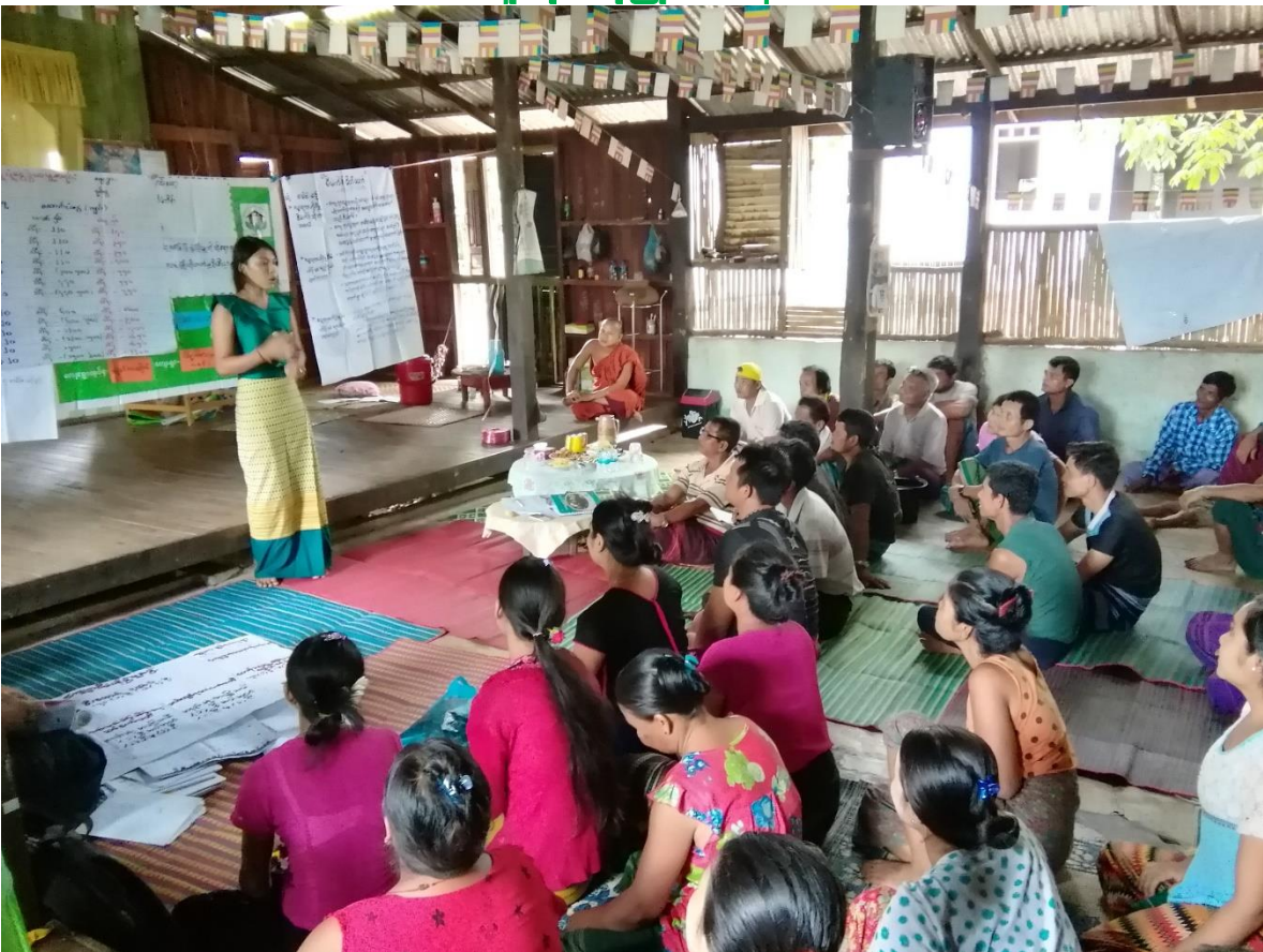
ပတ္တရာ(မွန်စု)ကျေးရွာ၊ ကညင်ကတိုက်ကျေးရွာအုပ်စု၊ ကော့ကရိတ်မြို့နယ်၊ ကရင်ပြည်နယ် ကျေးရွာဖွံ့ဖြိုးရေးအစီအစဉ် ၂၀၁၉ ခုနှစ်