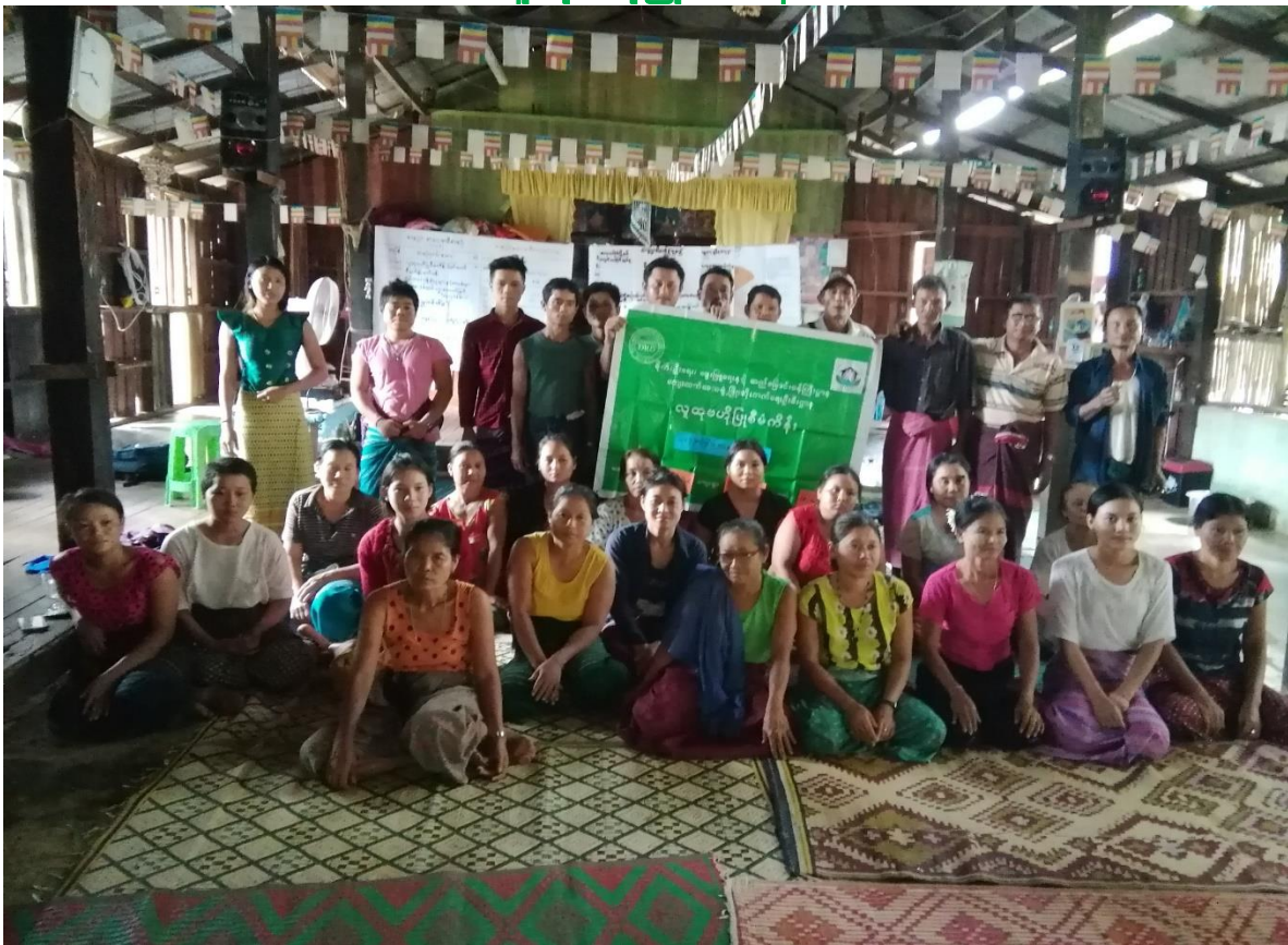
ပတ္တရော (ကရင်စု)ကျေးရွာ၊ ကညင်ကတိုက်ကျေးရွာအုပ်စုကော့ကရိတ်မြို့နယ်၊ ကရင်ပြည်နယ် ကျေးရွာဖွံ့ဖြိုးရေးအစီအစဉ် ၂၀၁၉ ခုနှစ်