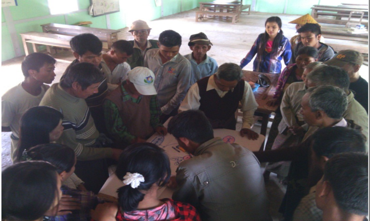
လူငယ်အုပ်စု၏မှတ်တမ်းခါတ်ပုံ