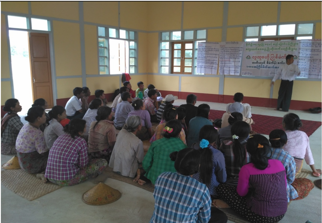
ကော်မတီရွေးချယ်ခြင်းမှတ်တမ်းဓာတ်ပုံ