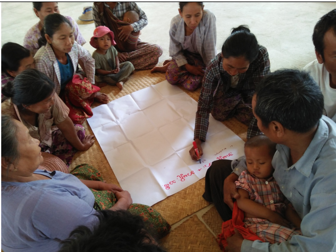
ထိခိုက်လွယ်အုပ်စုများ၏မှတ်တမ်းခါတ်ပုံ