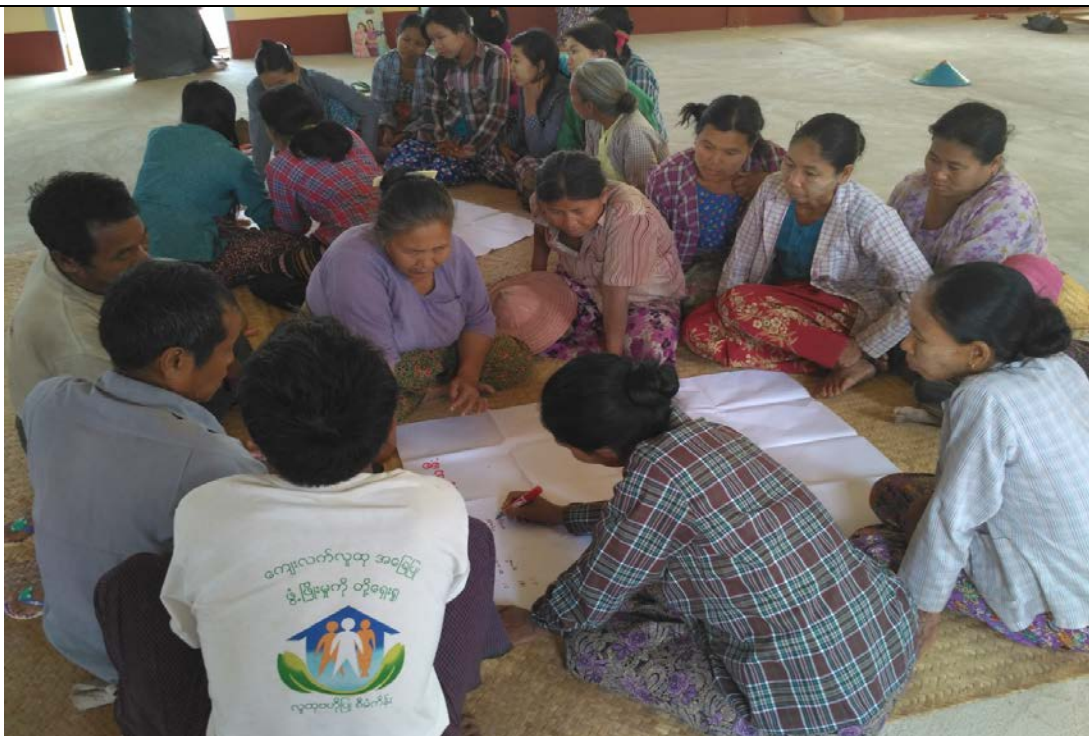
ဖွံ့ဖြိုးရေးအစီအစဉ်ရေးဆွဲခြင်းမှတ်တမ်းဓာတ်ပုံ