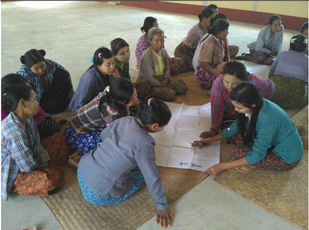
ဖွံ့ဖြိုးရေးအစီအစဉ်ရေးဆွဲခြင်းမှတ်တမ်းဓာတ်ပုံ