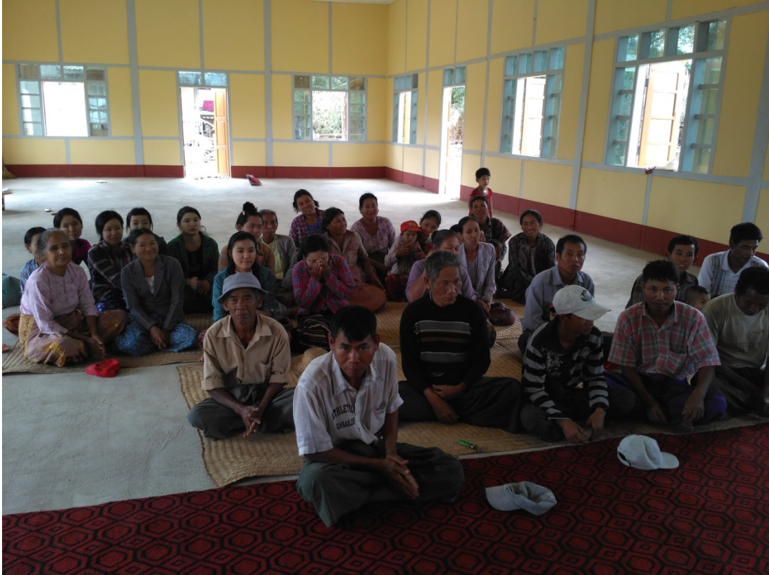
စေတနာ့ဝန်ထမ်းများ၏ချွေးချယ်ခြင်းမှတ်တမ်းဓာတ်ပုံ