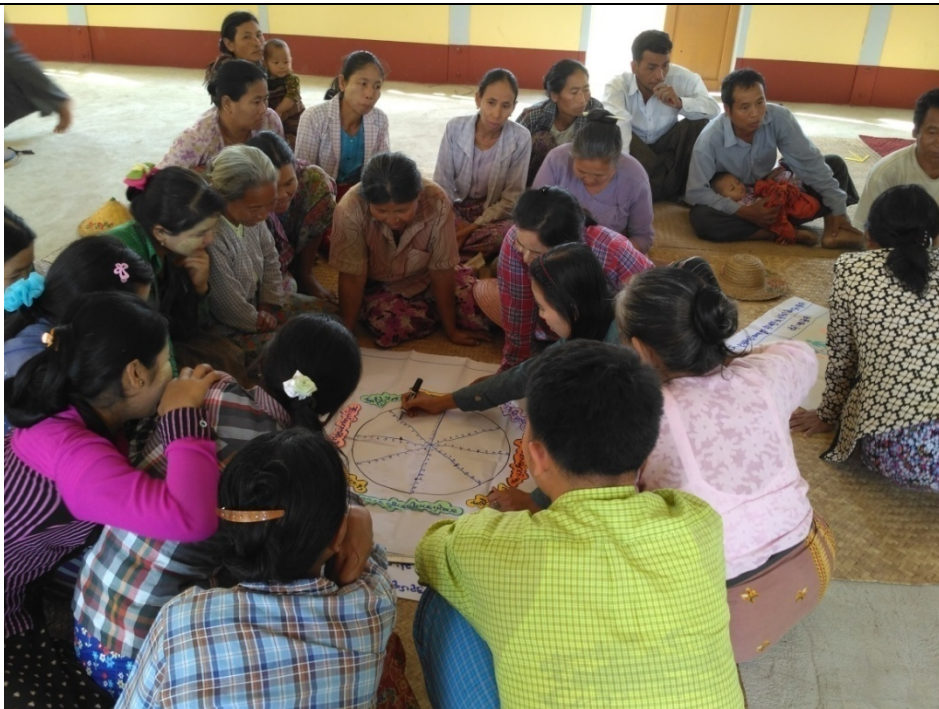
အမျိုးသမီးအုပ်စု၏မှတ်တမ်းခါတ်ပုံ