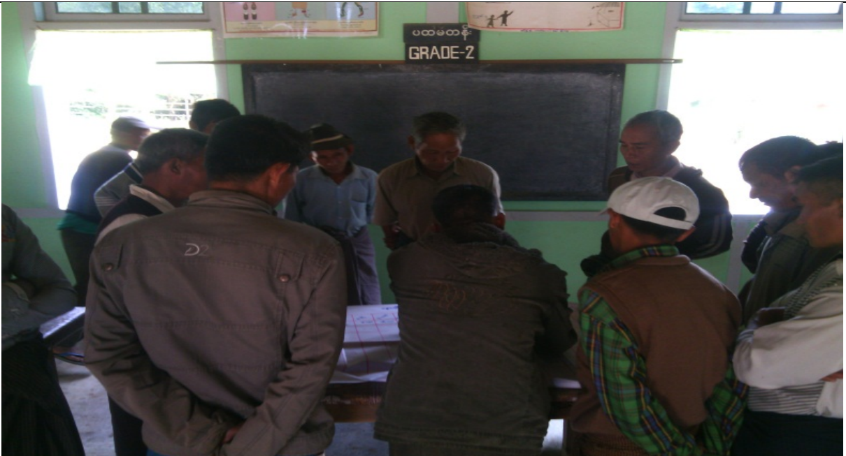
အမျိုးသားအုပ်စု၏မှတ်တမ်းခါတ်ပုံ