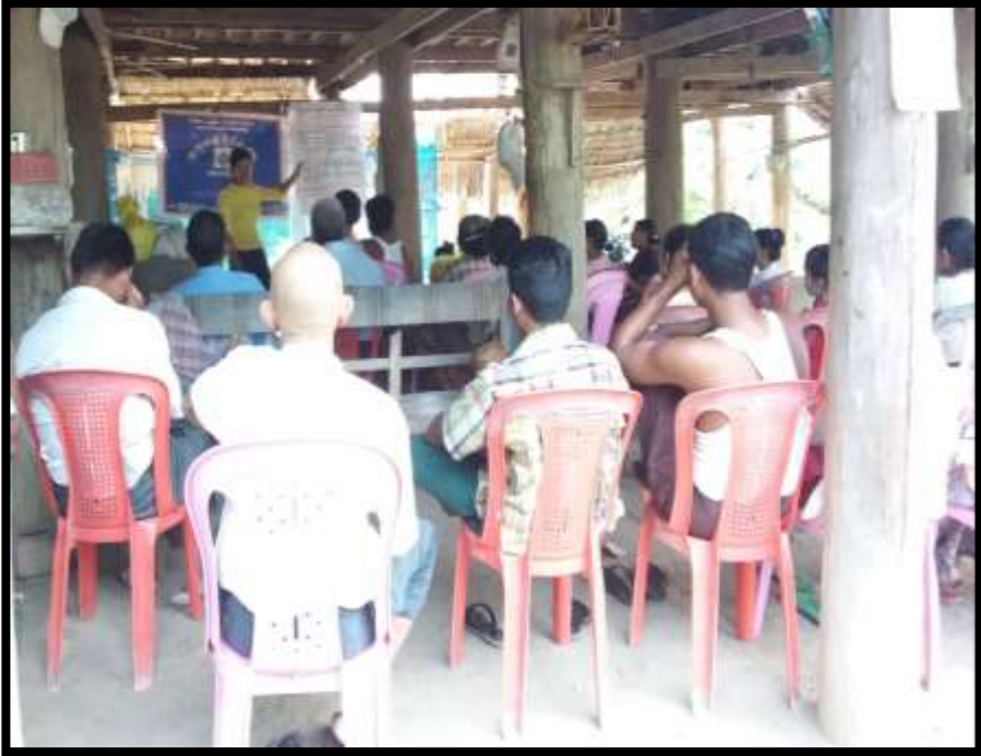
၇.၁။ ကျေးရွာအစည်းအဝေးနှင့် PRA Tools များအသုံးပြု၍အချက်အလက်ကောက်ခံခြင်း