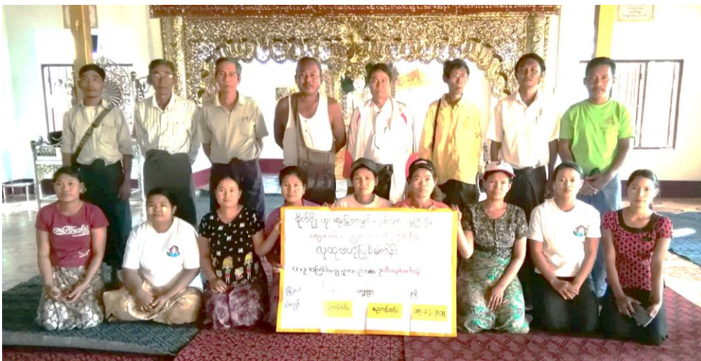
ကျေးရွာစီမံကိန်း အထောက်အကူပြု ကော်မတီဝင်များ