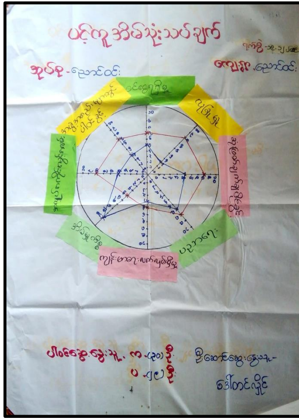
ဆွေးနွေးခြင်းနှင့် ဆန်းစစ်ခြင်း