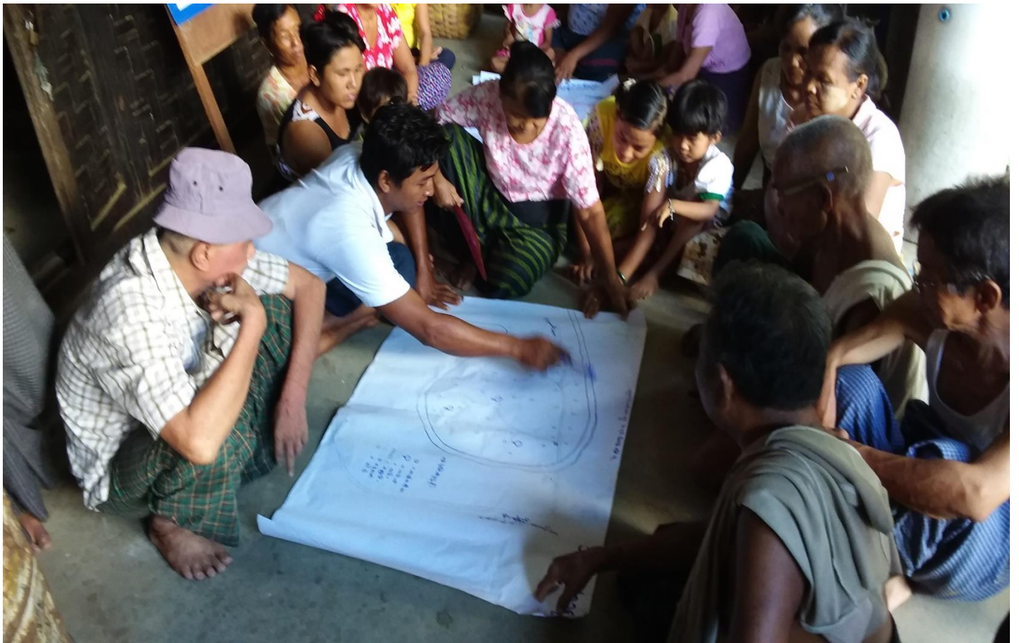
ကျေးရွာသူ၊ ကျေးရွာသားများကျေးရွာလူမှုရေးနှင့် အရင်းအမြစ်ပြုပြင်ရေးဆွဲနေစဉ်