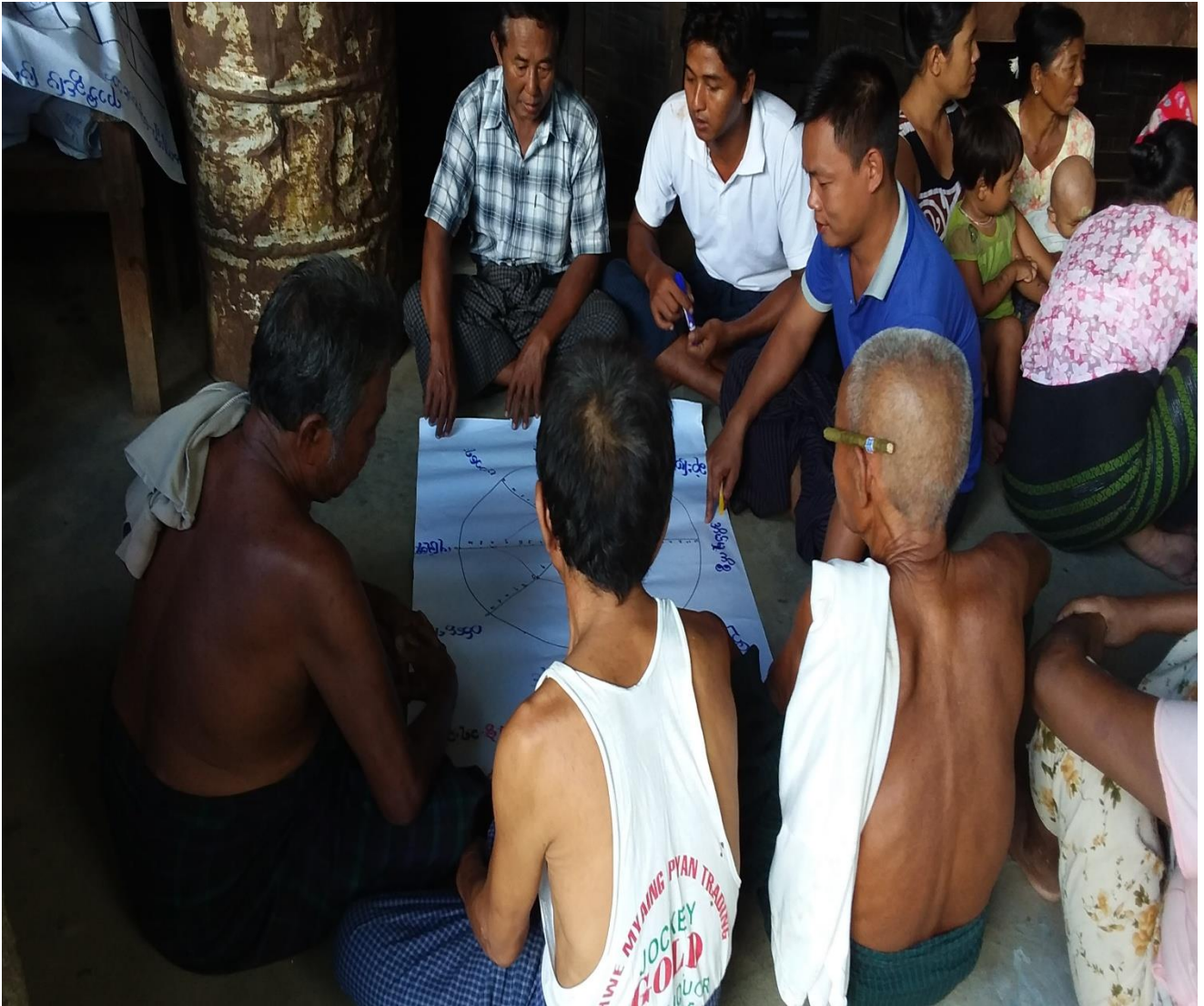
ကျေးရွာသူ၊ ကျေးရွာသားများပင့်ကူအိမ်သုံးသပ်ချက်ပြဇယားရေးဆွဲနေပုံ