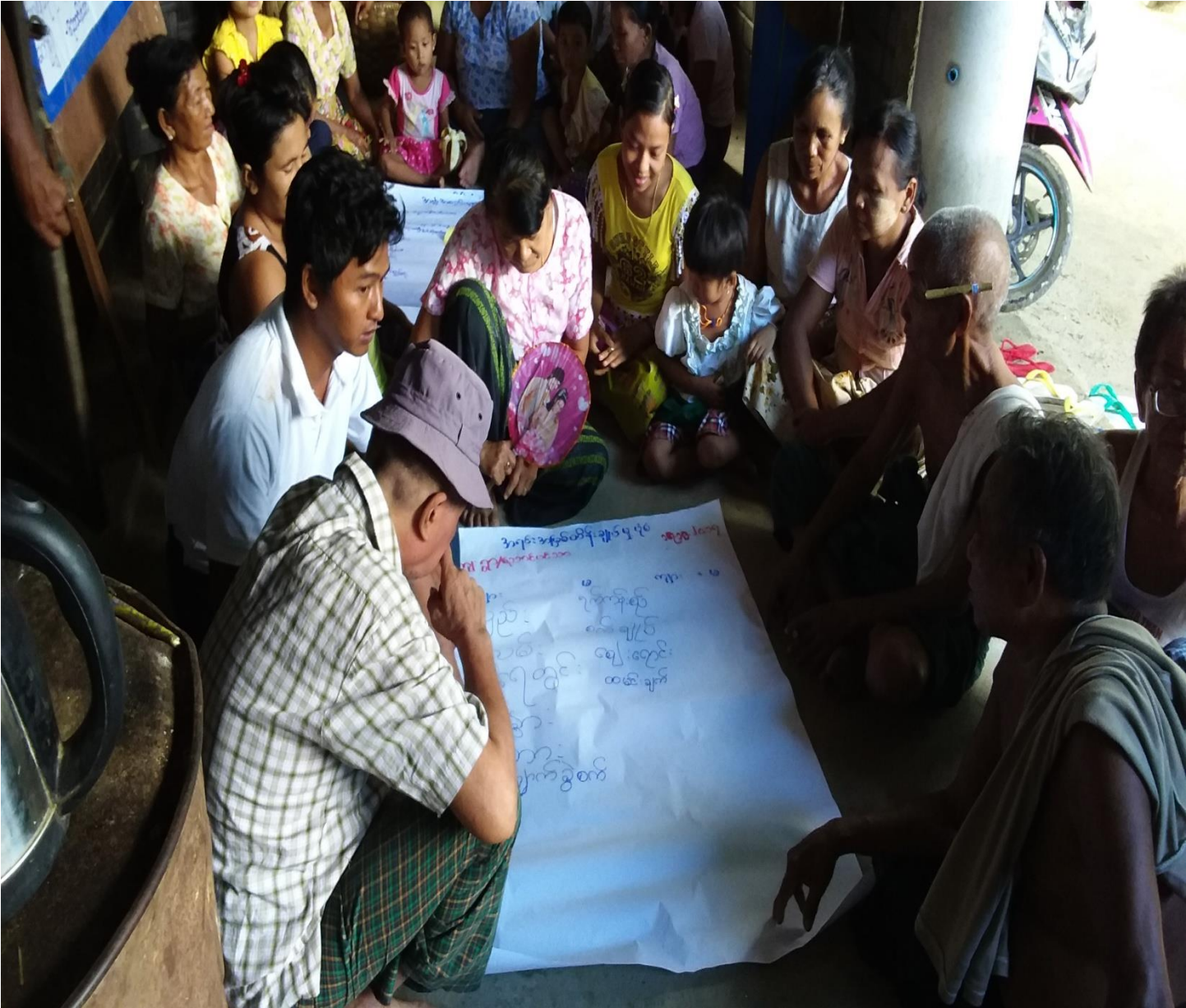
ကျေးရွာသူ၊ ကျေးရွာသားများအရင်းအမြစ် သုံးစွဲမှုနှင့် ထိန်းချုပ်မှုပြဇယားရေးဆွဲနေပုံ