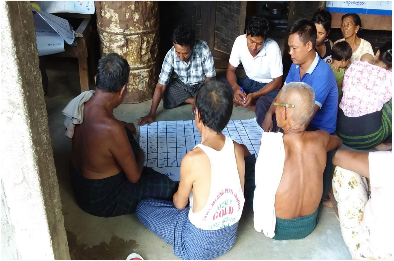
ကျေးရွာသူ၊ ကျေးရွာသားများရာသီခွင်ပြုပြင်ကွဲနိရဲဆွဲနေပုံ