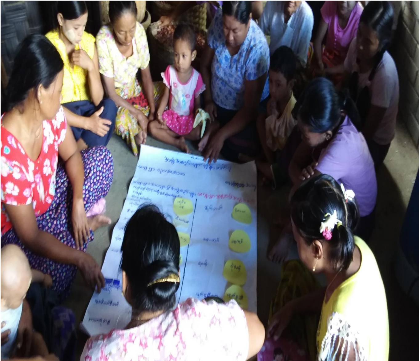
ကျေးရွာသူ၊ ကျေးရွာသားများအဖွဲ့အစည်းချိတ်ဆက်မှုပြ မြေပုံရေးဆွဲနေပုံ