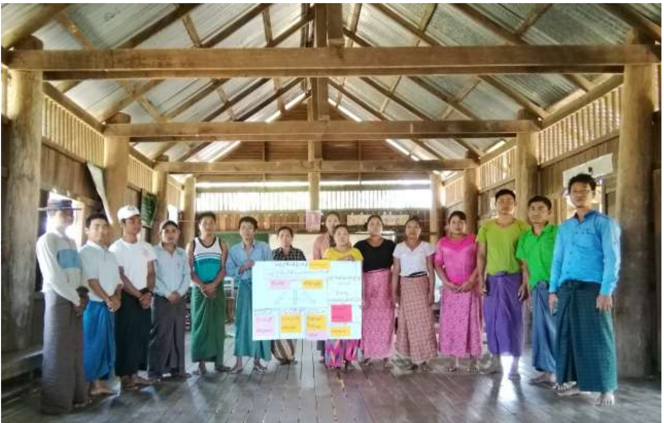
၇။ ကော်မတီဝင်များရွေးချယ်ခြင်းနှင့် ကျေးရွာဖွံ့ဖြိုးရေးအစီအစဉ်ဆောင်ရွက်မှု မှတ်တမ်းဓါတ်ပုံများ